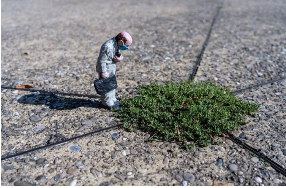
Resim 11. Isaac Cordal, 2020, Neuf-Brisach / Fransa

Cordal'ın beton bir zeminde küçük bir alanda büyümeyi başarmış bir ot birikintisi yanına yerleştirmiş olduğu, yüzünde maske takılı minyatür heykeli oldukça fazla dikkat çeken çalışmaları arasındadır. Betonlaşarak ilerlemekte olan şehir hayatı ve insanların temiz, doğal ortamlarından uzaklaşarak hayat sürdürme çabası bu kurulum ile aktarılmıştır. Minyatür heykel doğrultusunda yeşil alanlarımızın gittikçe az yer kaplar hale gelişini ve maske kullanımı ile de oksijen kirliliği, salgın hastalıklar vs. gibi durumların çoğalışını Cordal ironik bir dil ile izleyiciye sunmaktadır. Yayılmakta olan şehirleşme durumu, yerküreyi beton ve asfalt ile kaplarken biyoçeşitliliğin yok oluşu hatta ekosistemin de zarar görüşü söz konusudur. İnsanoğlu yaşadığı dünyada gelişimini doğaya, kendi topraklarına zarar vererek sürdüreceği takdirde o topraklara duyulacak olan 'hasret' kalacaktır geriye. Bu düşünce kapsamında bireylerin, devletlerin yaşam yerleri oluşturma gayesi ile ormanları; yeşillik alanları katletmek yerine sürdürülebilir yeşil şehirleşme doğrultusunda bir yol izlemesi, yaşanılacak topraklarda gelecek adına bir umut vaad edebilmektedir.