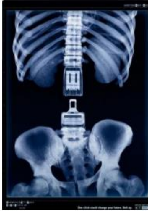
Resim 3. Emniyet Kemerini Kullanımı Konulu Sosyal Afiş, Birsen Çeken, 2016

Resim 3’de kemerin takılacağı alan omurga ve bedeni ikiye bölmüş vaziyette görünmekte. Emniyet kemeri kullanımı izleyici için artık sıkıcı, yaygın bir uyarı niteliğinden ziyade ironik bir anlatım yolu ile daha dikkat çekici bir hal almıştır.