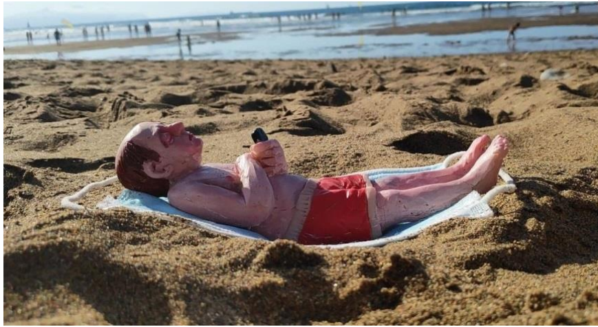
Resim 12. Isaac Cordal, İspanya

Cordal'ın beton bir zeminde küçük bir alanda büyümeyi başarmış bir ot birikintisi yanına yerleştirmiş olduğu, yüzünde maske takılı minyatür heykeli oldukça fazla dikkat çeken çalışmaları arasındadır. Betonlaşarak ilerlemekte olan şehir hayatı ve insanların temiz, doğal ortamlarından uzaklaşarak hayat sürdürme çabası bu kurulum ile aktarılmıştır. Minyatür heykel doğrultusunda yeşil alanlarımızın gittikçe az yer kaplar hale gelişini ve maske kullanımı ile de oksijen kirliliği, salgın hastalıklar vs. gibi durumların çoğalışını Cordal ironik bir dil ile izleyiciye sunmaktadır. Yayılmakta olan şehirleşme durumu, yerküreyi beton ve asfalt ile kaplarken biyoçeşitliliğin yok oluşu hatta ekosistemin de zarar görüşü söz konusudur. İnsanoğlu yaşadığı dünyada gelişimini doğaya, kendi topraklarına zarar vererek sürdüreceği takdirde o topraklara duyulacak olan 'hasret' kalacaktır geriye. Bu düşünce kapsamında bireylerin, devletlerin yaşam yerleri oluşturma gayesi ile ormanları; yeşillik alanları katletmek yerine sürdürülebilir yeşil şehirleşme doğrultusunda bir yol izlemesi, yaşanılacak topraklarda gelecek adına bir umut vaad edebilmektedir.