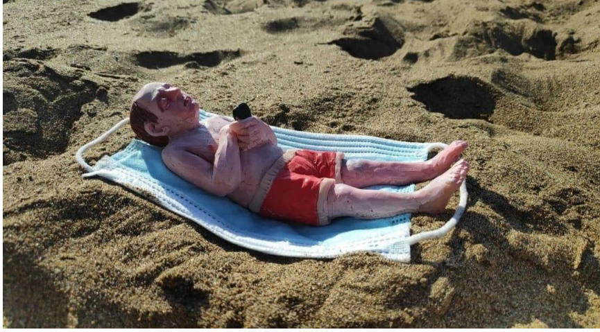
Resim 13. Isaac Cordal, İspanya (Eserin detay görseli)

2019 yılının Aralık ayından bu yana sürmekte olan, birçok ölüme ve bireylerde çeşitli yan etkilere neden olan Covid-19 salgınından korunabilme yöntemi kapsamında takmış olduğumuz maskeler; bu kez Cordal'ın minyatür heykellerinde çalışma ile bütünlük sağlayan bir nesne konumunda kullanılmıştır. Kumsal bir alanda maske ve içerisinde mayosu ile yatan bir figür olarak elinde telefonu yer alan minyatür bir heykel bulunmaktadır. Bir nevi maskeyi kendisine deniz havlusu amacı ile kullanarak uzanmış, güneşlenen bir birey (heykel)... Sanatçı, insanların pandemi sürecinden bunalmalarını; yaz mevsiminde ise denize girebilmelerini ve maskeyi havlu gibi göstererek, maskenin günlük yaşamın bir parçası haline gelmesi konusunu ironik bir dille vurgulamayı hedeflemiştir. Kurulumun küçük şekilde var oluşu çevredeki izleyicilerin dikkatini çektiğinde güldürebilen bir etken iken aslında kendilerine derin bir anlam sunması bakımından ironinin yine başarılı bir şekilde kullanıldığı görülmektedir.