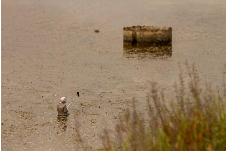
Resim 8. Isaac Cordal, “Selfish”, 2019, Sete