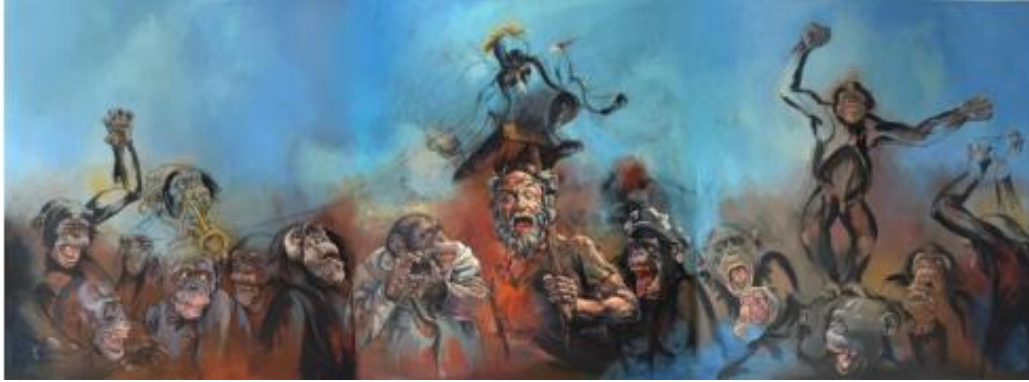
Resim 2. Mehmet Sıddık Turan, Deliliğin Karnaval Ruhu, T.Ü.Y.B., 170x450cm, 2018

Bu açıdan bakıldığında, birçok sanatçının yeni bir anlatım dili arayışındayken ironiye başvurmuş olduğunu görmek mümkündür. Hatta Dada ve Gerçeküstücü dönem içerisinde bunun örneklerine sıkça rastlanabilmektedir. Çünkü resim artık konu olmaktan çıkmıştır ve konular alaya alınmaya başlanmıştır.