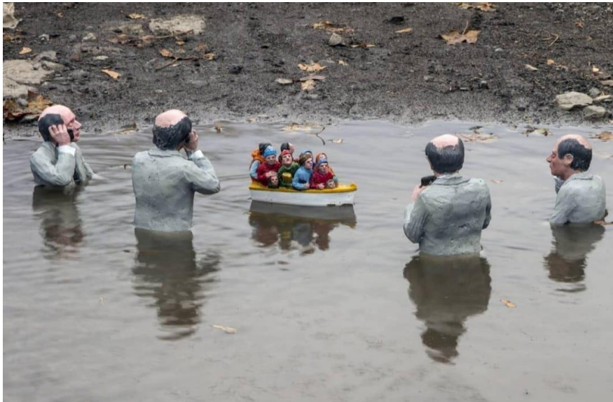
Resim 6. Isaac Cordal, “Horizon Lobby”, 2015, Canada

Cordal, küçük heykellerin üretim süreci için parçaları teker teker kil veya plastilin ile modellediğini daha sonra ise silikon kalıplar çıkarttığını ve parçaları çimento ile tekrar ürettiğini, her şey hazır olduğunda ise tüm parçaları sırt çantasına doldurup yürüyüşe çıktığını ve onları yerleştirmek için rastgele yerler bulduğunu belirtmiştir (Nural, 2021). Sanatçı için sokak, çalışmalarını izleyiciye rahatlıkla sunabilmesi adına önemli bir aracı konumundadır. Sokak, çalışmak için oldukça ilginç bir yer çünkü 24 saat açık; hiç kapanmıyor ve çoğunlukla kullanımı bedava (Cordal, 2021). Cordal, sanat eserini mekana yerleştirdikten sonra, fotoğrafını çekip onları fark edilmeleri, görmezden gelinmeleri veya sürüklenmeleri için geride bırakmaktadır.