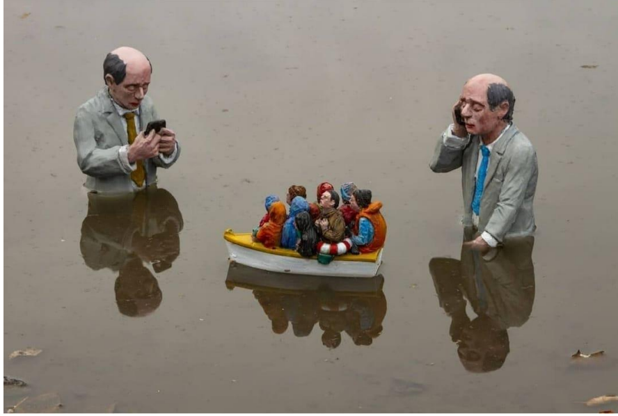
Resim 7. Isaac Cordal, “Horizon Lobby” 2015, Canada (Eserin detay görseli)

Cordal’ın kapitalist sisteme eleştirel bir tavır sunan “Horizon Lobby” isimli çalışması, politikacı iş adamlarını konu alan ve özellikle mülteci sorununu izleyiciye aktaran bir çalışma olmakla beraber; ister teknedeki insanların can yelekli şekilde kalabalık vaziyette yer alması, ister kılık kıyafet tasviri ile olsun yoksul ve çaresiz halleri vurgulanırken, mekan olarak heykellerin su birikintisi içerisinde bulunuyor olması da bu anlamı destekleyen bir başka öğe olarak karşımıza çıkmaktadır. Politikacıların, tekne dışında kalıp onları görüyor olması ve ellerinde telefonlar olması bir şekilde yetkili kişilere ulaşma çabası vs. gibi bir algı yaratırken; su içerisinde kendilerinin de yer alıyor oluşları bir bakıma onların da pek iyi bir durumda olmadıklarına göndermedir. Lakin aynı suda batar vaziyette veya mahsur kalmış şekilde yer alsalar bile ebat farkları da göstermektedir ki iş adamları teknedeki figürlere kıyasla statü bakımından avantajlı konumdadırlar ve sanatçı bu çalışmasıyla, izleyiciye toplumsal sınıflandırılışı ironik şekilde aktarmaktadır.