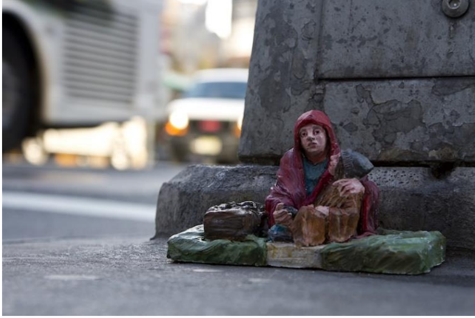
Resim 10. Isaac Cordal, “American Dream”, 2013, New York

olma durumundaki aşırıya kaçış hali bireyi sorgulamaya iten bir durum olmakla beraber Cordal'ın minyatür heykeli de bir nevi ayna görevi üstlenerek izleyiciye kendisini gösteren bir çalışma olmuştur.