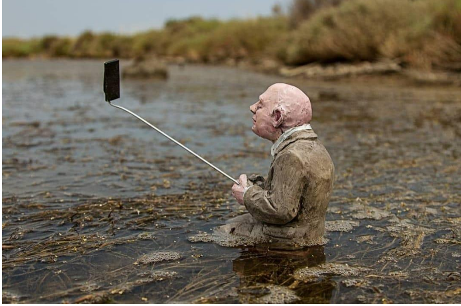
Resim 9. Isaac Cordal, “Selfish”, 2019, Sete (Eser detay görseli)

Teknolojik gelişimin hızla ilerlediği süreç içerisinde, günümüz insanların artık elinden düşmeyen, “selfie” olarak adlandırılan ön kameradan kendini her yerde; her koşulda çekme durumunun oldukça yaygın bir hal aldığı söylemek mümkün. Cordal da bu durumu minyatür heykelleri vasıtasıyla eleştirmiş görünüyor ki, yerleştirdiği mekan olarak bir bataklık ve içerisinde; kılık kıyafeti gayet düzgün bir figür yoluyla, elinde selfie çubuğunu tutarak ucuna da telefonu takmış halde fotoğraf çekilen bir heykel üretmiştir. Seçmiş olduğu mekan doğrultusunda çevre ve su kirliliğine de göndermede bulunan sanatçı, ön kamera ile çekimin İngilizce dilinde “selfie” olarak adlandırılışını, çalışma adına; bencil anlamına gelen “selfish” kelimesi ile bağdaştırarak ironik şekilde aktarmıştır. İnsanların hem yaşadıkları dünyayı kirletmeleri hem de umarsızca kirlettikleri alan içerisinde hala kendini düşünüyor olmaları, fotoğraf çekilebilmeleri bakımından bencilleşmiş vaziyette yer almaları, teknolojiye ve popüler olana bağımlı