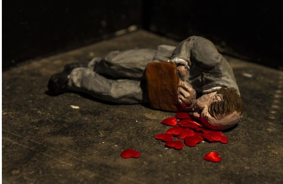
Resim 14. Isaac Cordal, “Failing in Love”, 2017, Fransa

2019 yılının Aralık ayından bu yana sürmekte olan, birçok ölüme ve bireylerde çeşitli yan etkilere neden olan Covid-19 salgınından korunabilme yöntemi kapsamında takmış olduğumuz maskeler; bu kez Cordal'ın minyatür heykellerinde çalışma ile bütünlük sağlayan bir nesne konumunda kullanılmıştır. Kumsal bir alanda maske ve içerisinde mayosu ile yatan bir figür olarak elinde telefonu yer alan minyatür bir heykel bulunmaktadır. Bir nevi maskeyi kendisine deniz havlusu amacı ile kullanarak uzanmış, güneşlenen bir birey (heykel)... Sanatçı, insanların pandemi sürecinden bunalmalarını; yaz mevsiminde ise denize girebilmelerini ve maskeyi havlu gibi göstererek, maskenin günlük yaşamın bir parçası haline gelmesi konusunu ironik bir dille vurgulamayı hedeflemiştir. Kurulumun küçük şekilde var oluşu çevredeki izleyicilerin dikkatini çektiğinde güldürebilen bir etken iken aslında kendilerine derin bir anlam sunması bakımından ironinin yine başarılı bir şekilde kullanıldığı görülmektedir.