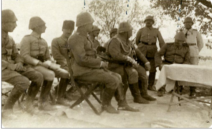
Goltz Paşa ve Diğer Subaylar-1916

Kazım Karabekir bu arada Türkiye’de görev yapmış olan Alman subaylarından General Schlee’den de bahsetmektedir. Schlee, 1914–1918 yılları arasında Türkiye’nin daveti üzerine gelmiş, I. Dünya Savaşı sırasında birçok yararlılıklar göstermiş bir askerdir. General Schlee, 1933 yılında Türkiye’ye tekrar gelerek Mustafa Kemal Paşa’nın huzurunda Cumhuriyet Bayramı’nın onuncu yılı kutlamalarında bulunmuştur. General Schlee Türk milletinin samimi bir dostu olarak kalmıştır (Karabekir, 2001a: 243).