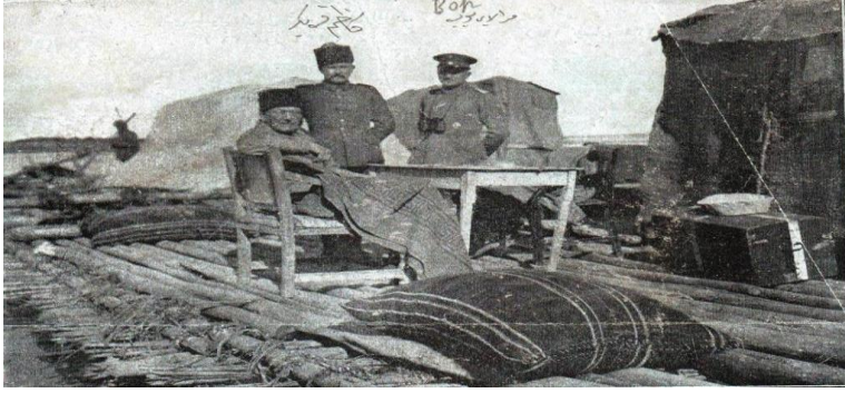
Irak Cephesi-1916/ Kazım Karabekir, Goltz Paşa ile Birlikte (Kazım Karabekir Müzesi)

Kazım Karabekir, Ziya Şakir'den yaptığı alıntıdan Goltz Paşa hakkında şu bilgileri vermektedir; "En büyük zevki, Türk üniformasıyla gezmektir. Ve, Türk ordusunun- ecdattan kalma- kudretine son derecede emindi... Bunun içindir ki, 1914 harbinde Harbiye Nazırı olan-eski talebesi- Enver Paşa'nın davetine icabet ederek yine Türkiye'ye geldi" (Karabekir, 2001a: 276) 10 .