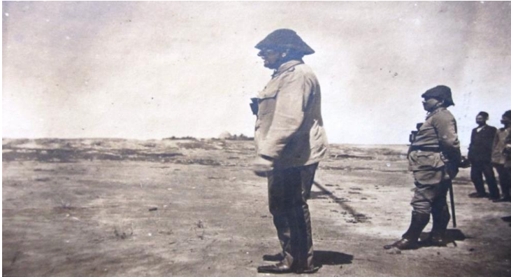
Goltz Paşa ile Birlikte-1916

Kazım Karabekir, Ziya Şakir'den yaptığı alıntıdan Goltz Paşa hakkında şu bilgileri vermektedir; "En büyük zevki, Türk üniformasıyla gezmektir. Ve, Türk ordusunun- ecdattan kalma- kudretine son derecede emindi... Bunun içindir ki, 1914 harbinde Harbiye Nazırı olan-eski talebesi- Enver Paşa'nın davetine icabet ederek yine Türkiye'ye geldi" (Karabekir, 2001a: 276) 10 .