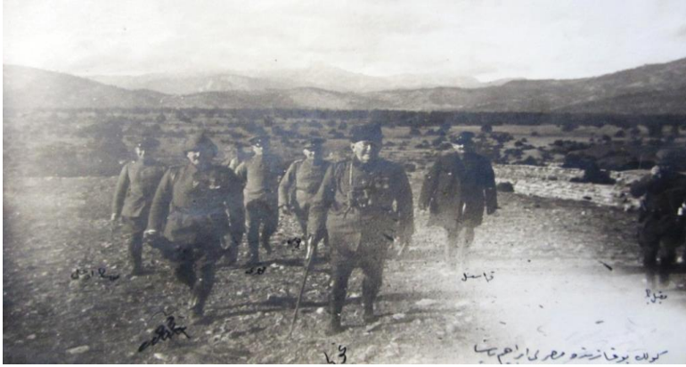
Goltz Paşa, Alman subaylar ile birlikte-1916 (Kazım Karabekir Müzesi)