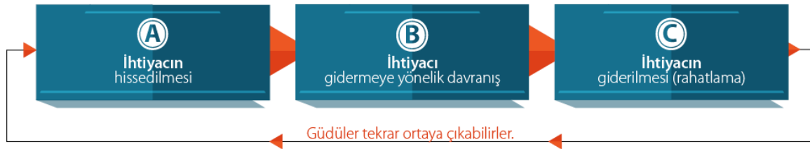
Şekil 2. Güdü döngüsü

İhtiyacın hissedilmesi aşamasında, organizma yoksunluk hisseder ve bunu ihtiyaç olarak görür. Oluşan ihtiyaç hali organizmayı harekete geçirir ve birey oluşan gereksinimi karşılamak için davranışı gerçekleştirir. İhtiyac giderilirse birey üçüncü aşama olan ihtiyacın giderilmesi yani rahatlama evresine girer. Güdüler tatmin edildikten sonra ihtiyaç halinde tekrar ortaya çıkabildiği için rahatlama evresi son aşama olarak görülmemelidir (Bacanlı, 2021). Organizmada meydana gelen bu fiziksel ve psikolojik ihtiyaçlar Maslow'un ihtiyaçlar hiyerarşisinde belirttiği yeme, içme, güvenlik, sevgi, saygı, ait olma gibi gereksinimlerden oluşmaktadır (Maslow, 1987). Gdülenmeyi en çok etkileyen öğrenme çevresinden gelen kaynaklar ise eğitimciler ve ebeveyn hedefleri, sınıfın hedef yapısı, pekiştirici ödül ve ceza sistemleri, öğrenciden eğitimcilerin beklentileri olarak görülmektedir (Ulusoy, 2020).