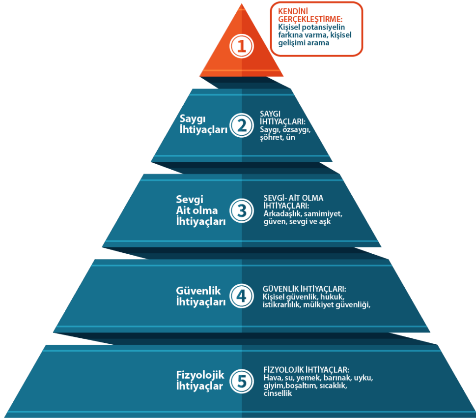
Şekil 1. Maslow'un ihtiyaçlar hiyerarşisi

Maslow, ihtiyaçları ilk etapta beş aşamada incelemiştir. Bunlar; hava, su, yemek, barınak, uyku, giyim gibi fizyolojik ihtiyaçlar; kişisel güvenlik, hukuk, istikrarlılık, mülkiyet güvenliği gibi güvenlik ihtiyaçları; arkadaşlık, samimiyet, güven, sevgi ve aşk gibi sevmeye ve ait olma ihtiyaçları; saygı ve şöhret gibi özsaygı ihtiyaçları; kişisel potansiyelin farkına varma, kişisel gelişimi arama gibi kendini gerçekleştirme ihtiyaçlarından oluşmaktadır. Maslow, daha öncede belirttiği gibi, insan ihtiyaçlarının hiyerarşi içinde olduğunu dile getirmektedir (Maslow, 1987).