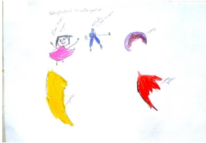
Şekil 3. Ç26 kodlu çocuğun yaptığı bilim insanı konulu resim

Ç25 kodlu çocuğun bilim insanı kavramına yönelik algısını belirlemek için ona yaptırılan resimde kırmızı elbise giyen, sarı ve uzun saçlı kadın bir bilim insanı bulunmaktadır. Mekân olarak dış ortam çizilmiştir. Ayrıca resimde trafik ışığı bulunmaktadır. Ç28'e göre bu bilim insanı işe gitmektedir.