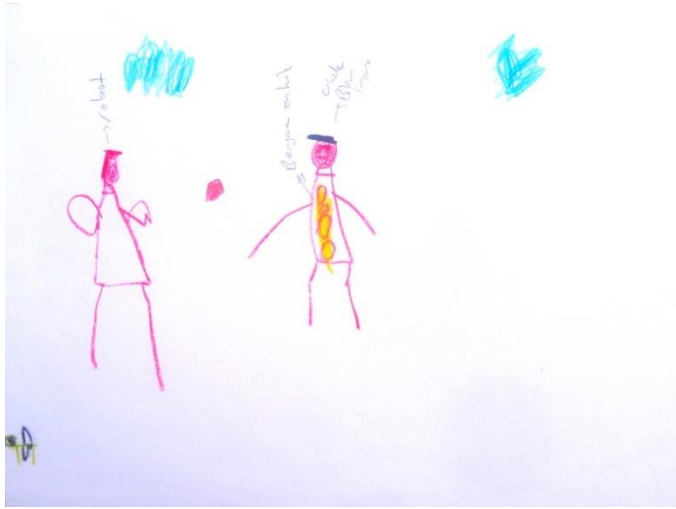
Şekil 1. Ç6 kodlu çocuğun yaptığı bilim insanı konulu resim

Tablo 2'ye göre çocukların %66,17'si bilim insanını erkek, %22,05'i ise bilim insanını kadın olarak resmetmiştir. Çocukların %11,76'sı ise resimlerinde farklı cinsiyette birden fazla bilim insanı yaparak bilim insanlarının hem kadın hem de erkek olabileceğini belirtmişlerdir. Bilim insanlarının cinsiyetleri konusunda Ç6, yaptığı resimdeki bilim insanı modelini: "...bilim adamları erkektir..." şeklinde açıklamıştır. Ç28 ise resmindeki bilim insanı modelini: "...benim çizdiğim bilim adamı kız..." şeklinde belirtmiştir. Ç26 ise bilim insanı modelini: "...erkek bilim insanı da olur kadın da olur..." şeklinde ifade etmiştir. Çocukların açıklamalarına yönelik yaptıkları resimler Şekil 1, Şekil 2 ve Şekil 3'te sunulmuştur.