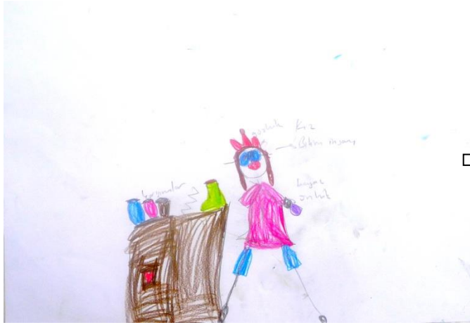
Şekil 7. Ç1 kodlu çocuğun yaptığı bilim insanı konulu resim