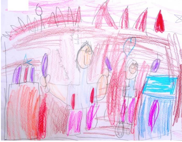
Şekil 10. Ç17 kodlu çocuğun yaptığı bilim insanı konulu resim