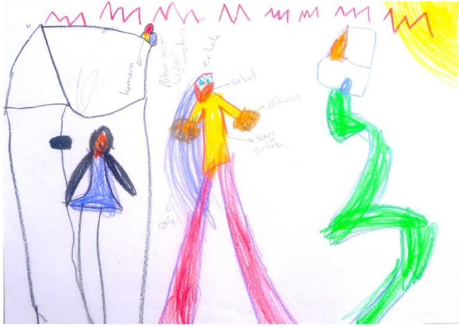
Şekil 8. Ç42 kodlu çocuğun yaptığı bilim insanı konulu resim

Ç1 kodlu çocuğun bilim insanı kavramı hakkındaki algısını belirlemek için ona yaptırılan resimde gözlüklü, önlüklü, şort giyen ve elinde büyüteç olan kadın bir bilim insanı bulunmaktadır. Ayrıca resimde bir masanın üzerinde bulunan ve içerisinde karışımlar olduğu laboratuvar malzemeleri de yer almaktadır. Ç1'e göre bu bilim insanı karışımlar oluşturmaktadır.