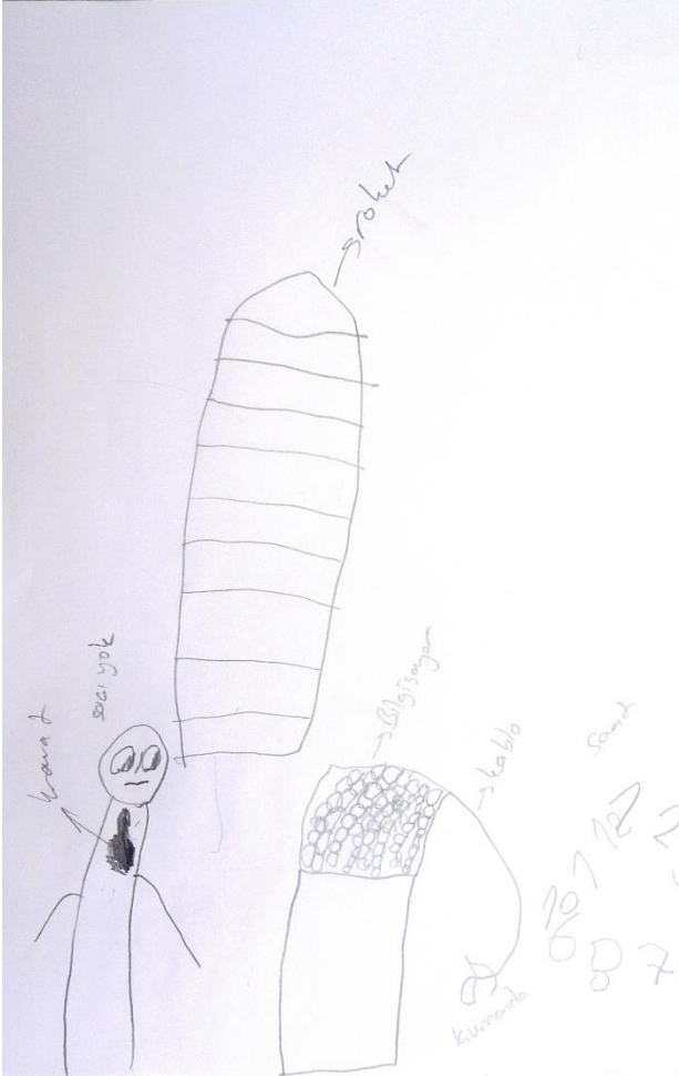
Şekil 16. Ç18 kodlu çocuğun yaptığı bilim insanı konulu resim

Ç34 kodlu çocuğun bilim insanı kavramı hakkındaki algısını belirlemek için ona yaptırılan resimde saçı olmayan, kravat takan ve diğer kıyafetleri konusunda herhangi bir bilgi bulunmayan erkek bir bilim insanı bulunmaktadır. Ayrıca resimde roket, bilgisayar, kablo, kumanda, masa ve saat nesnelere yer verilmiştir. Ç34'e göre bu bilim insanı roket yapmıştır ve roketi uzaya göndermektedir.