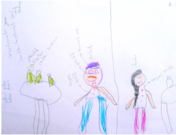
Şekil 9. Ç2 kodlu çocuğun yaptığı bilim insanı konulu resim

Tablo 5'e göre çocuklar yaptıkları resimlerde bilim insanlarının çalışma ortamları konusunda %16,1'i laboratuvarı, %1,4'ü sınıfı, %25'i çalışma odasını ve %39,7'si ise belirsiz bir yeri kullanmışlardır. Bilim insanlarının çalışma ortamının doğa olduğunu belirten çocuklardan %17,6'sı yaptığı resimde bitki, %8,8'i hayvan, %7,3'ü yıldız, %2,9'u ay, %17,6'sı güneş, %22'si bulut ve %4,4'ü ise gökkuşağı modeline yer vermiştir. Bilim insanlarının çalışma ortamına dair Ç2: "...burası bir laboratuvar...", Ç11: "...burası sınıf...", Ç67: "...bilim insanı odasında çalışır..." ve Ç17: "...bilim adamı doğada yıldızları inceler..." şeklinde açıklama yapmıştır. Herhangi bir açıklama yapmayan çocuklardan bazıları bilim insanlarının çalışma ortamını kapalı bir mekân olarak resmederken bazıları ise ortam konusunda herhangi bir sınırlama getirmeyerek belirsiz bir mekânda çalışma ortamını resmetmiştir. Çocukların açıklamalarına yönelik yaptıkları resimler Şekil 9, Şekil 10 ve Şekil 11'de sunulmuştur.