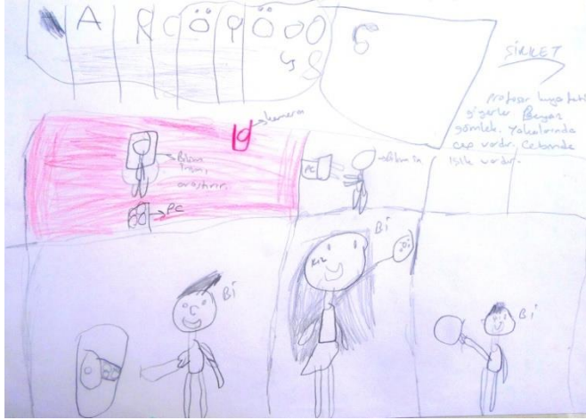
Şekil 4. Ç61 kodlu çocuğun yaptığı bilim insanı konulu resim

Ç61 kodlu çocuğun bilim insanı kavramına yönelik algısını belirlemek için ona yaptırılan resimde birden fazla ve farklı cinsiyetlerde bilim insanları bulunmaktadır. Resimdeki bilim insanları beyaz gömlek giymektedirler ve kendilerine ait kapalı bir çalışma odaları vardır. Ayrıca yapılan resimde bilgisayarlar, kamera ve masalar bulunmaktadır.