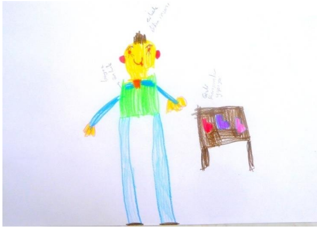
Şekil 5. Ç20 kodlu çocuğun yaptığı bilim insanı konulu resim

Ç61 kodlu çocuğun bilim insanı kavramına yönelik algısını belirlemek için ona yaptırılan resimde birden fazla ve farklı cinsiyetlerde bilim insanları bulunmaktadır. Resimdeki bilim insanları beyaz gömlek giymektedirler ve kendilerine ait kapalı bir çalışma odaları vardır. Ayrıca yapılan resimde bilgisayarlar, kamera ve masalar bulunmaktadır.