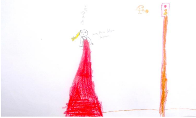
Şekil 2. Ç28 kodlu çocuğun yaptığı bilim insanı konulu resim

Ç25 kodlu çocuğun bilim insanı kavramına yönelik algısını belirlemek için ona yaptırılan resimde kırmızı elbise giyen, sarı ve uzun saçlı kadın bir bilim insanı bulunmaktadır. Mekân olarak dış ortam çizilmiştir. Ayrıca resimde trafik ışığı bulunmaktadır. Ç28'e göre bu bilim insanı işe gitmektedir.