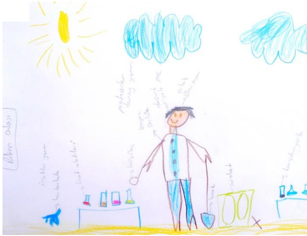
Şekil 12. Ç7 kodlu çocuğun yaptığı bilim insanı konulu resim

teleskopa, %2,9'u küreğe, %1,4'ü merceğe, %1,4'ü alet çantasına, %1,4'ü hesap makinesine, %1,4'ü saate, %1,4'ü lambaya, %1,4'ü kabloya, %1,4'ü tahtaya, %1,4'ü dolaba ve %1,4'ü de makineye yer vermiştir. Bilim insanların kullandıkları araç gereçlere dair Ç26: "...bilim insanı odasında teleskopuyla yıldızlara bakar...", Ç43: "...elinde küreği var...", Ç7: "...bunlar masanın üstünde duran deney tüpleri. İçinde karışımlar yapar...", Ç66: "...mercekle yazıları okuyor...", Ç51: "...roketin kalkması için saatine bakarak hesap makinesinden zamanı ayarlıyor...", Ç28: "...bilim adamı kablolarla lambayı yakacak...", Ç1: "...bilim insanı alet çantası taşır elinde...", Ç15: "...köyü korumak için evin çatısına kamera taktı..." şeklinde ifade etmiştir. Herhangi bir açıklama yapmayan veya açıklamalarını eksik yapan çocukların resimlerinde dolap ve tahta nesnelere de olduğu görülmüştür. Çocukların açıklamalarına yönelik yaptıkları resimler Şekil 12, Şekil 13 ve Şekil 14'te sunulmuştur.