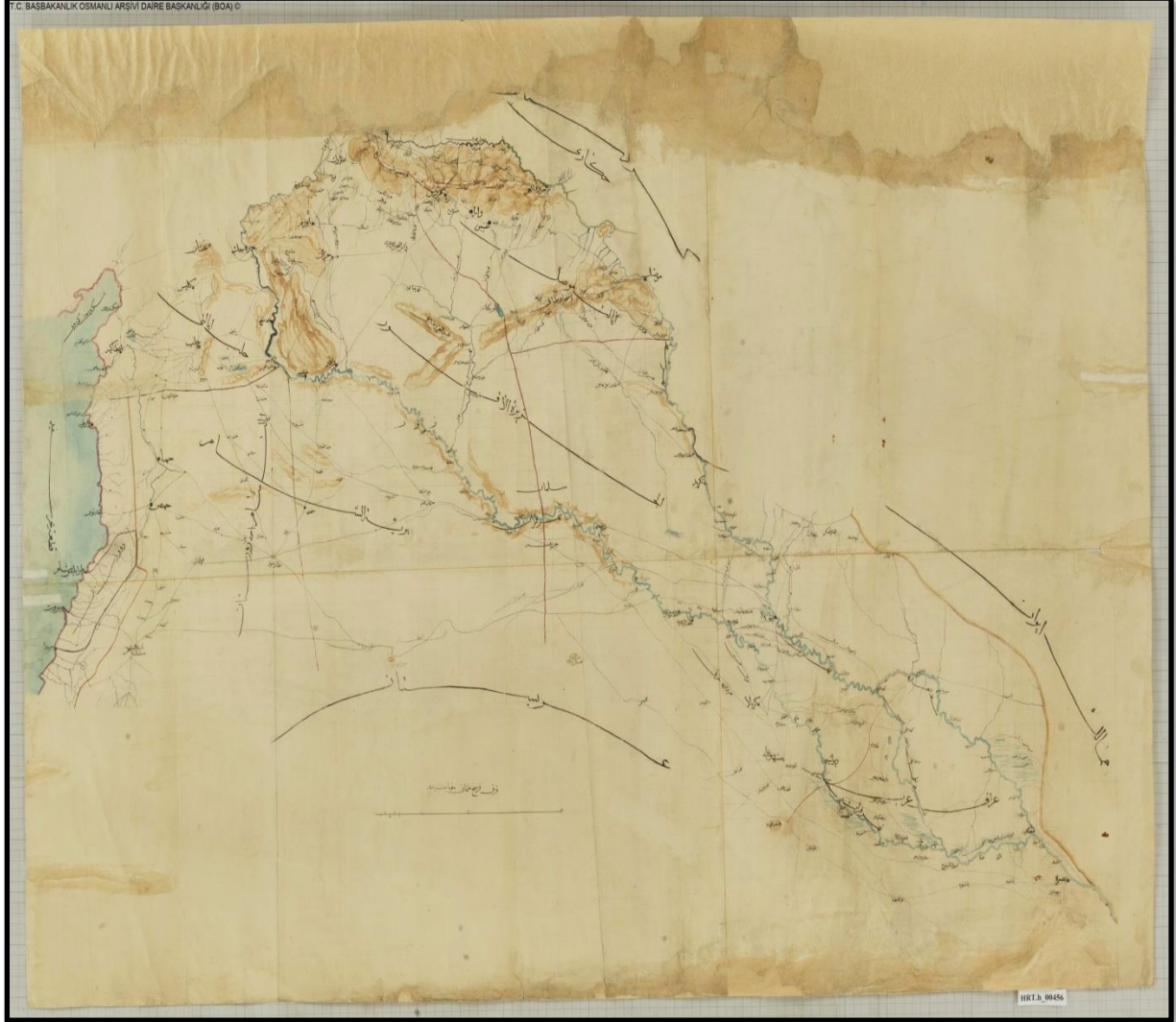
Harita 1: Urfa, Fırat, Suriye, Irak Gibi Yerleşim Yerleri, Dağları ve Akarsuları Haritası 173