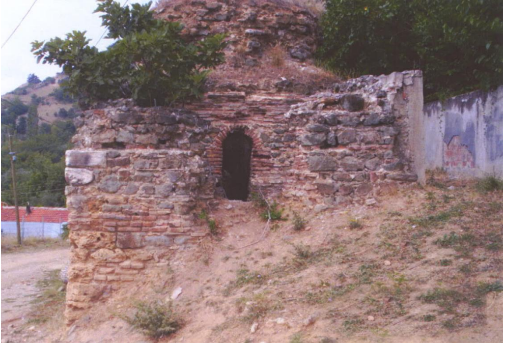
Resim 2: Kuzey cephede esas giriş