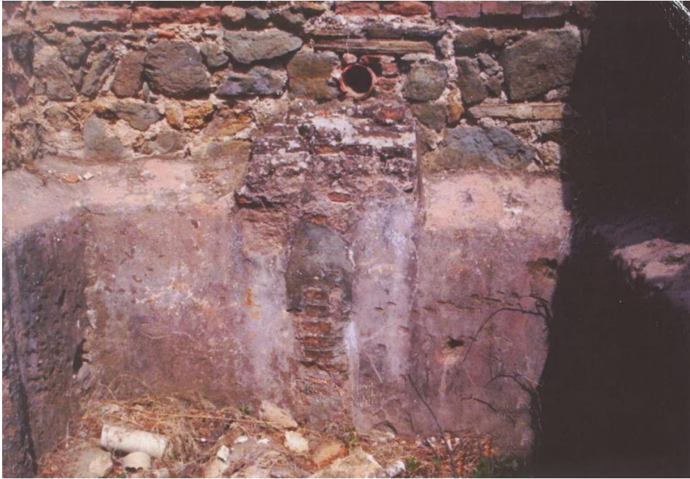
Resim 12: Su deposunda doğu duvarındaki künk ağzı ve önünde aşınmış tuğla kademe