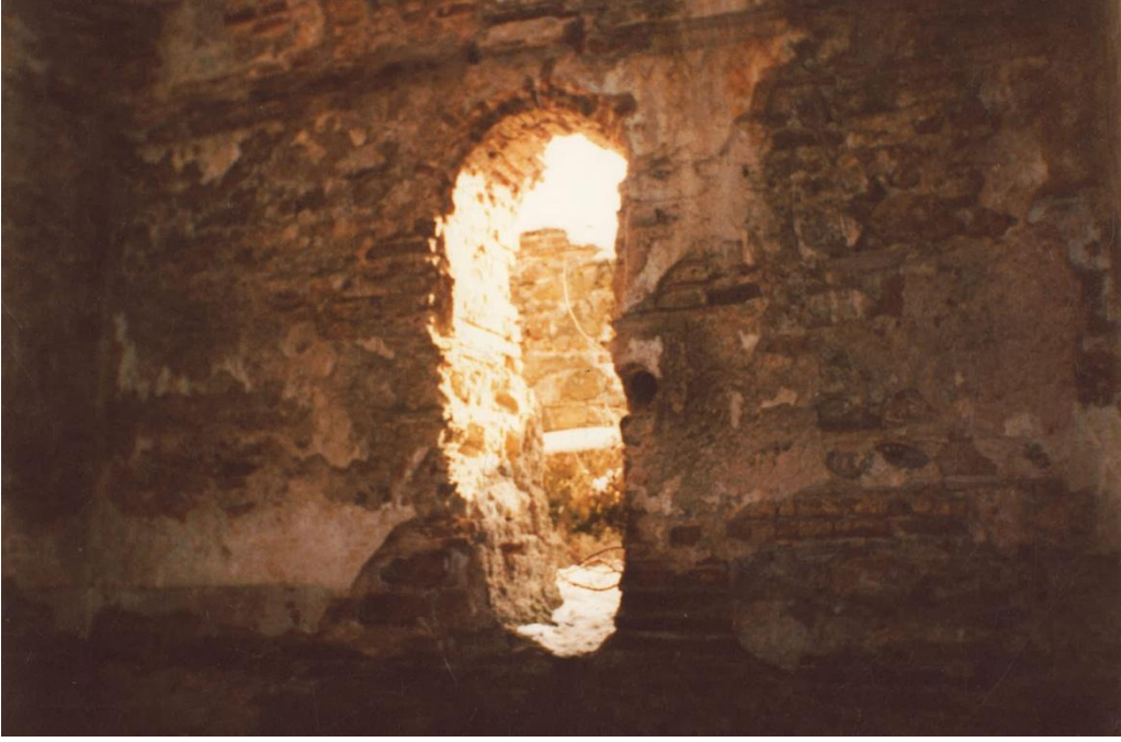
Resim 11: Su deposunda kuzey duvarındaki pencere nitelikli açıklık