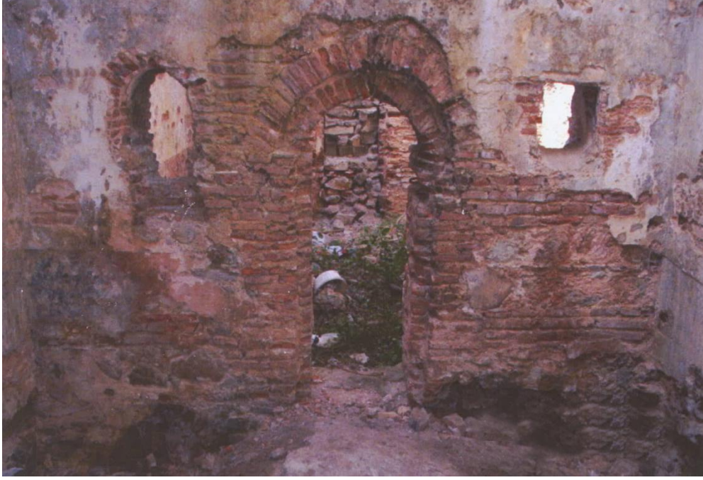
Resim 9: Sıcaklıkta kuzey duvarındaki geçiş açıklığı