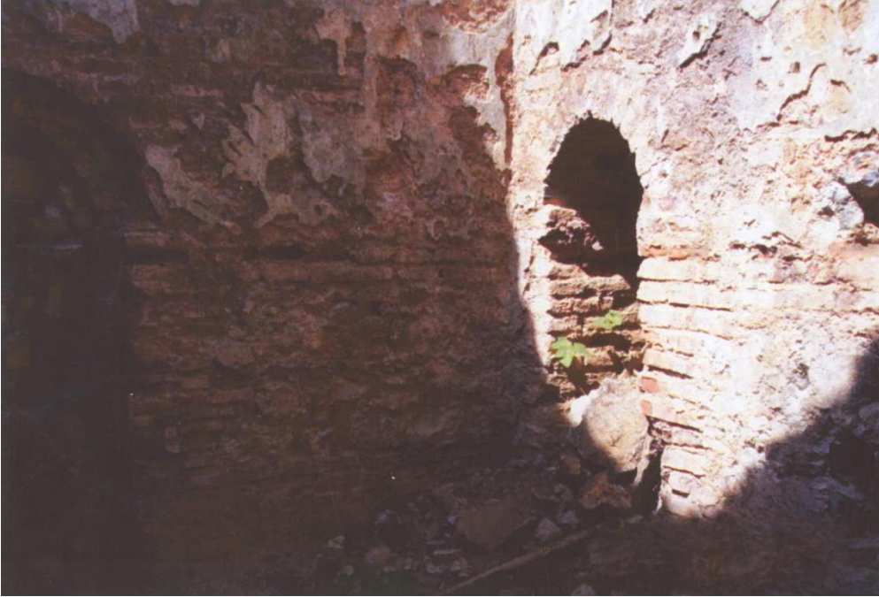
Resim 6: Ilıklıkta doğu duvarındaki yan giriş