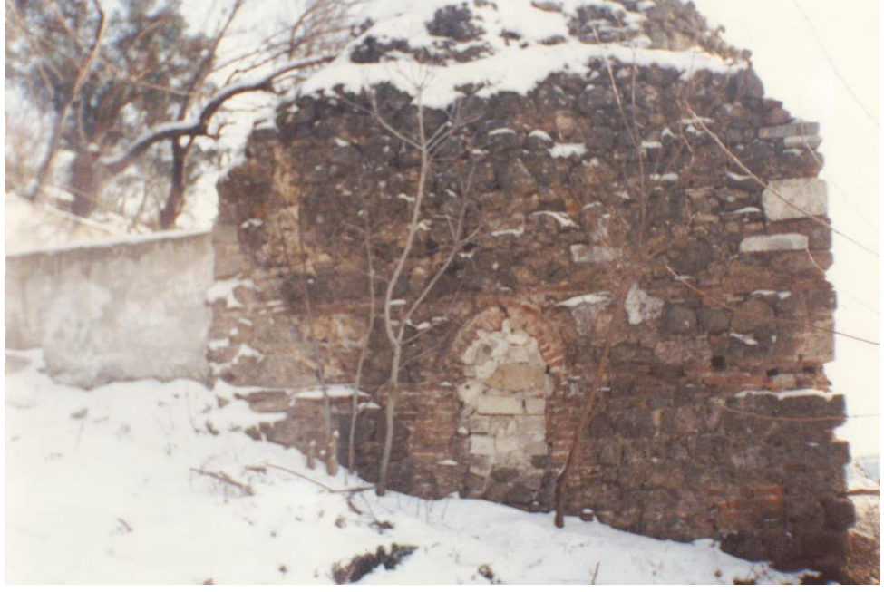
Resim 1: Kuzey ve batı cephe