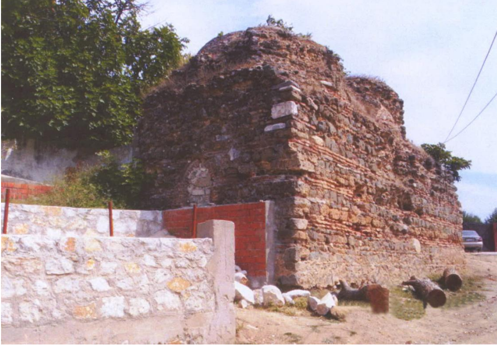
Resim 3: Güney cephe