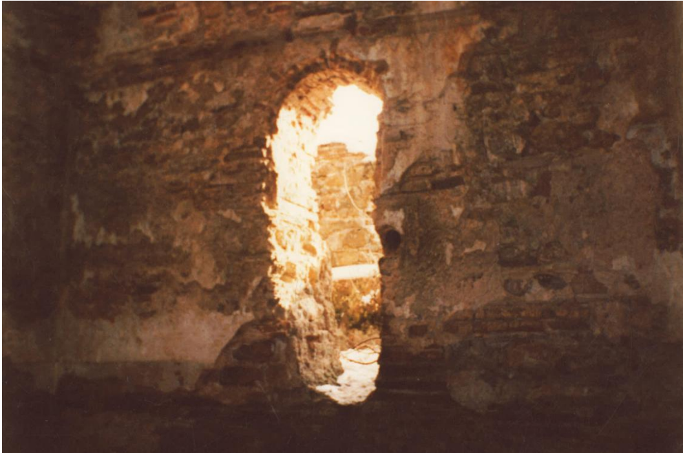
Resim 10: Sıcaklıkta güney duvarındaki pencere nitelikli açıklık