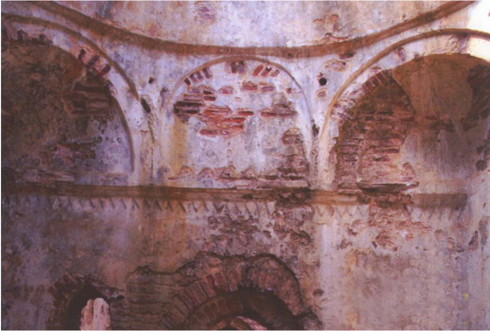
Resim 8: Sıcaklıkta malakari süsleme