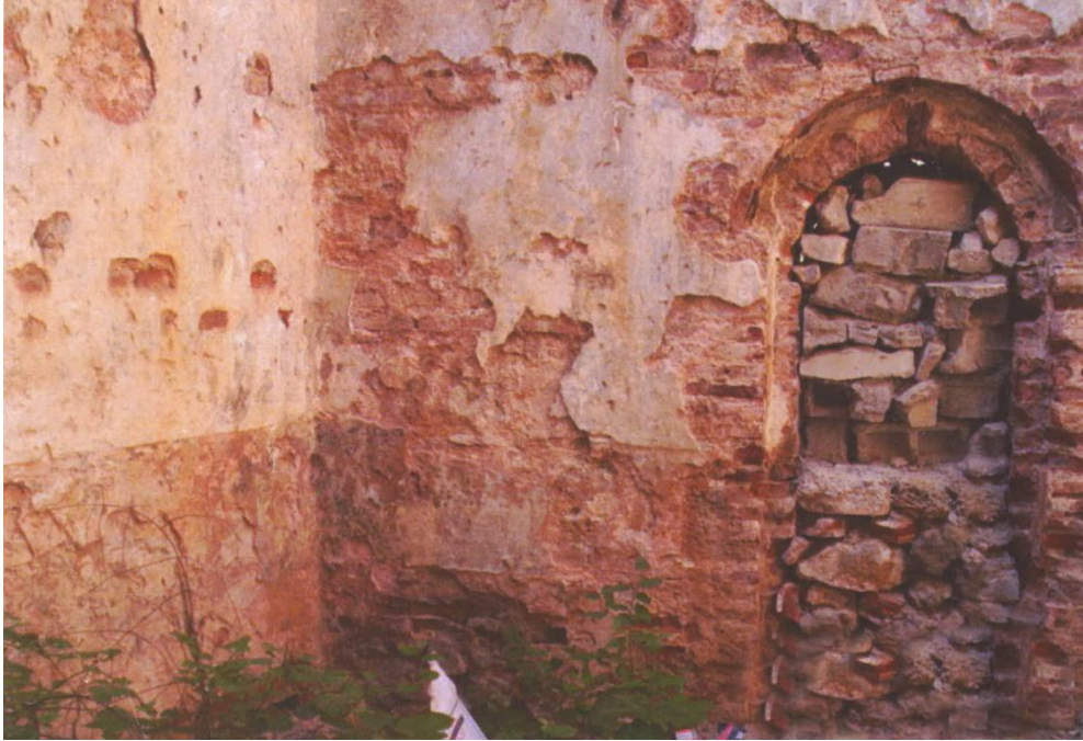
Resim 4: Ilıklıkta kuzey duvarı