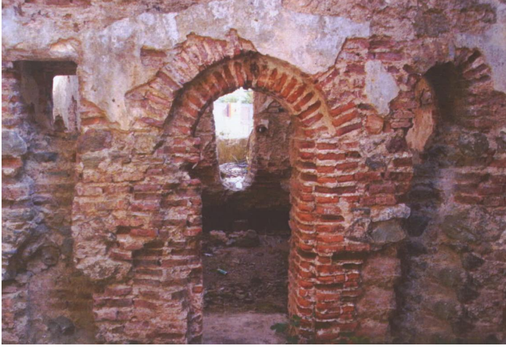
Resim 7: Ilıklıkta güney duvarındaki geçiş açıklığı