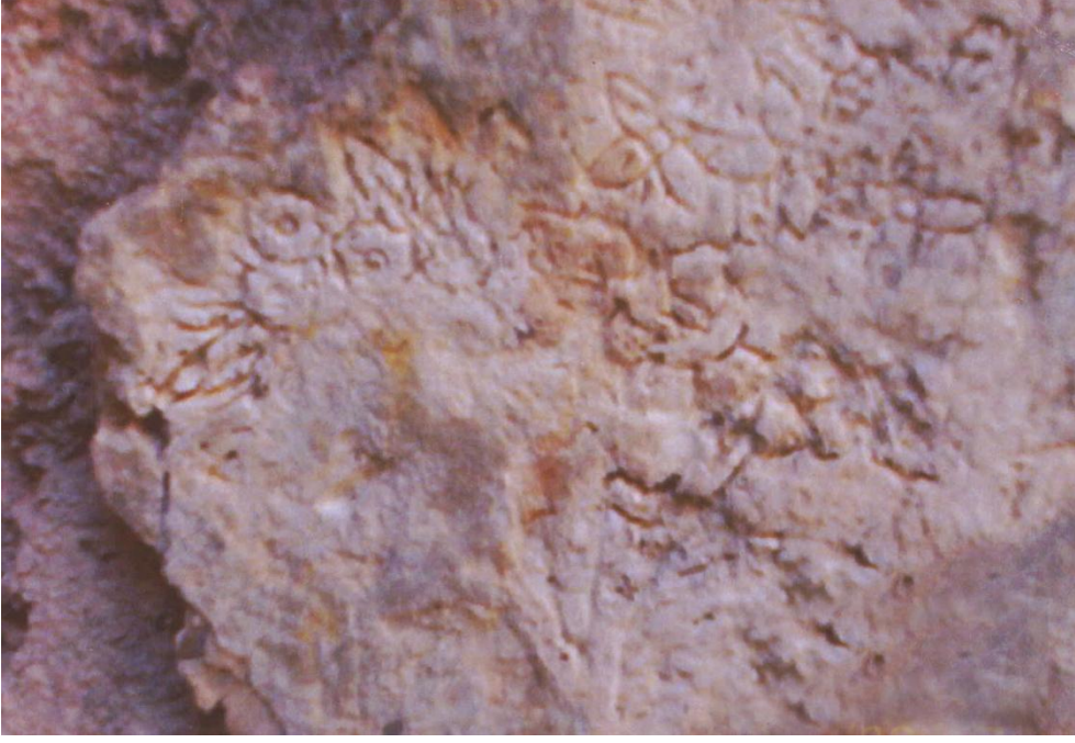
Resim 5: Ilıklıkta stampa süsleme