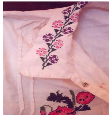
Fotoğraf 37-38. Gömlek, Hülya sezgin, Milas (Photo 37-38. Shirt, Hülya sezgin, Milas)