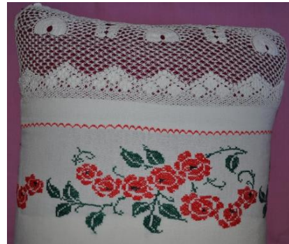
Fotoğraf 26. Kısa yastık, Zuhal Kırcağız, Milas (Photo 26. Short pillow, Zuhal Kırcağız, Milas)