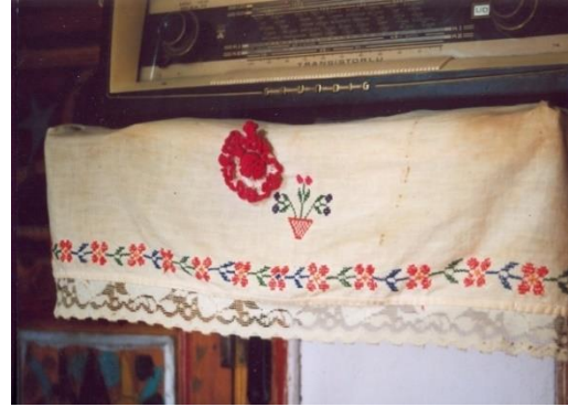
Fotoğraf 21-22. Raf örtüsü, Fatmana Ertuğrul, Çomakdağ-Kızılağaç (Photo 21-22. Wood shelf cover, Fatmana Ertuğrul, Çomakdağ-Kızılağaç)

Sandık örtüsü; evlenme geleneklerinin nişan ve düğün hazırlığı adetleri içinde yer alan ve içine eşya koyup temiz bir şekilde saklamak ya da taşımak için (Fatmana Ertuğrul, Kişisel Görüşme, 18.06.2016) kullanılan sandıkları örtmek ve süslemek için hazırlanan, genellikle 65x100 cm. boyutlarında olan dikdörtgen formundaki ürünlerdir. Genellikle patiska kumaşından yapılmakta ve üç kenarı bordürlerle bezenmektedir (Fotoğraf No:23). Seccade; çeyiz hazırlama adetleri içinde yer alan türlerdendir. Üzerinde bir tek kişinin namaz kılabileceği büyüklükte ortalama 70x140cm. boyutlarında, etamin kumaşından hazırlanmaktadır. Yörede "namazlağ" adı verilmektedir (Zuhal Kırcağız, Kişisel Görüşme, 20.09.2016) (Fotoğraf No:24).