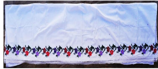
Fotoğraf 11-12. Karyola eteği, Ayten Sezgin, Milas (Photo 11-12. Bedstead skirt, Ayten Sezgin, Milas)

Kapı örtüsü; Milas ve çevresinde çeyiz adetleri içinde yer alan, gelin evi kapılarının üst kısımlarını süslemek için kullanılan, beyaz patiskadan hazırlanan, iki dar kenarı işlemeler ile bezenen, genellikle 45x90 cm. boyutlarında olan örtülerdir. Örtü, kapı üzerinde eşit olmayan katlama biçimi ile kullanıldığından, işlemenin ters yüzü görünmemesi için işlemeler ürünün farklı yüzeylerine uygulanmaktadır. Yörede kapı örtüsü "kapı süsü" olarak isimlendirilmektedir (Ünzile Öngel, Kişisel Görüşme, 20.08.2016) (Fotoğraf 10).