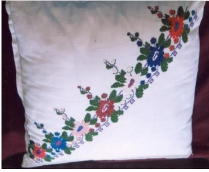
Fotoğraf 27. Yastık, Arzu Çetinavcı, Milas (Photo 27. Pillow, Arzu Çetinavcı, Milas)