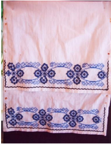
Fotoğraf 10. Kapı örtüsü, Fatma Kadın Çelik, Milas (Photo 10. Door cover, Fatma Kadın Çelik, Milas)