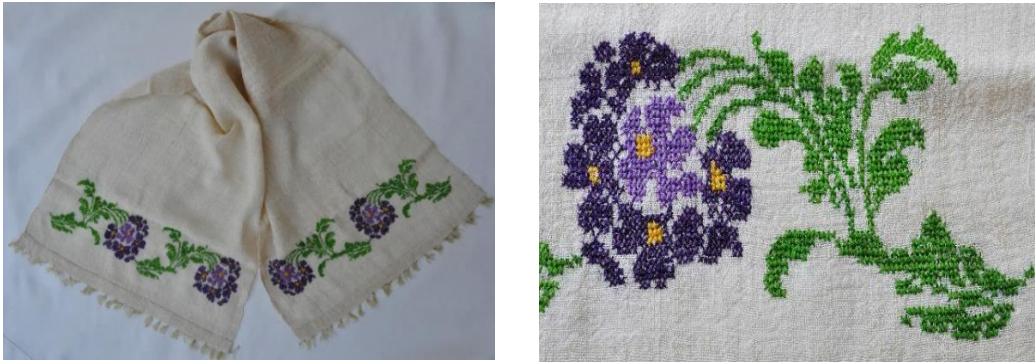
Fotoğraf 19-20. Peşkir genel görüntü, Atiye Sert, Milas-Selimiye (Photo 19-20. Towel, Atiye Sert, Milas-Selimiye)

Raf örtüsü; ev eşyaları için üretilen bir tür çeşididir. Milas ve çevresinde konutların oda iç donatı elemanı olan ve genellikle radyo, bardak, sürahi, fincan gibi eşyaların konduğu ahşap rafların üstünü örtmek ve süslemek için hazırlanan örtülerdir. Bu örtülerin boyutları raf ölçülerine bağlı değişmektedir. Genellikle bir uzun kenarı kanaviçe işlemeli bordürler ile süslenmektedir. Bazı örneklerde bir motifin bordür ile birlikte yer aldığı görülmektedir (Periye Çelebilik, Kişisel Görüşme, 22.06.2016) (Fotoğraf 21-22).