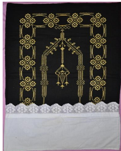
Fotoğraf 23. Sandık örtüsü, Fatmana Ertuğrul, Çomakdağ-Kızılağaç (Photo 23. Chest cover, Fatmana Ertuğrul, Çomakdağ-Kızılağaç)