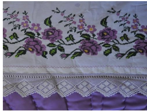
Fotoğraf 31-32. Yorgan kapağı, Zuhal Kırcağız, Milas (Photo 31-32. Quilt cover, Zuhal Kırcağız, Milas)