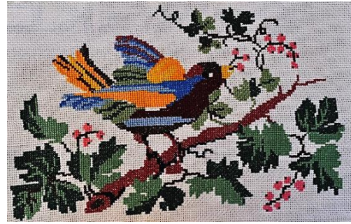
Fotoğraf 16. Pano, Ayten Sezgin, Milas (Photo 16. Wall frame, Ayten Sezgin, Milas)

Pano; çeyiz hazırlama adetleri içinde ev eşyaları için üretilen türlerdendir. Pano ev duvarlarını süslemek amaçlı, genellikle etamin kumaşlar üzerine kanaviçe işlemler ile farklı boyutlarda hazırlanmaktadır. Çoğunlukla figürlü bezeme motiflerinin konu olarak seçildiği görülmektedir (Fotoğraf 15-16).