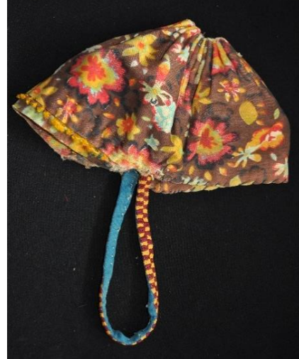
Fotoğraf 39-40. Sakındırak, Nazmiye Alkaya, Çomakdağ-Kızılağaç (Photo 39-40. Sakındırak, Nazmiye Alkaya, Çomakdağ-Kızılağaç)