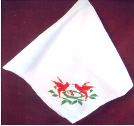
Fotoğraf 4. Bohça, Fatma Kadın Çelik, Milas (Photo 4. Bundle, Fatma Kadın Çelik, Milas)

29.09.2016) (Fotoğraf 5). Dolap örtüsü; çeyiz hazırlama adetleri içinde ev eşyalarından olan aynalı ahşap elbise dolaplarının üzerini süslemek ya da tozdan korumak amaçlı kullanılan, patiska kumaştan yapılan, üç kenarı bordürlerle süslenen, 80x150 cm. boyutlarında olan dikdörtgen formundaki örtülerdir (Periye Çelebilik, Kişisel Görüşme, 22.06.2016) (Fotoğraf 6-7). Elbise örtüsü; evlenme geleneklerinin çeyiz hazırlama adetleri içinde ev eşyaları için üretilen bir türdür. Duvara sabitlenen veya çiviye asılan metal ya da ahşap elbise askılarında bulunan giysileri tozdan korumak ve süslemek için kullanılan, ortalama 100x150 cm. boyutlarında, dikdörtgen formundaki örtülerdir. Düz örtü ve kılıf biçiminde iki çeşidi vardır. Düz elbise örtüleri örtücü nitelikte, kılıf olanların ise kaplayıcı nitelikte giysileri koruduğu görülmektedir. Düz örtü, giysilerin üzerinde eşit olmayan katlama biçimi ile kullanıldığından, katlanan kısımdaki işlemin tersi görünmemesi için kumaşın diğer yüzeyine işlemler yapılmaktadır. Bu örtülerin iki dar kenarı işlemeli bordürler ile bezenmektedir. Kılıf biçimi elbise örtülerinde ise işlemeli bordürler üç kenarda yer almaktadır. Yörede "bısat örtüsü" adı da verilmektedir (Özlem Özler, Kişisel Görüşme, 22.06.2016) (Fotoğraf 8-9).