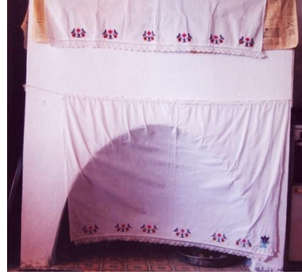
Fotoğraf 14. Ocak gergisi ve ocaklık başı örtüsü, Emine Koçan, Selimiye (Photo 14. Oven cover Melek Yatakçı Milas)