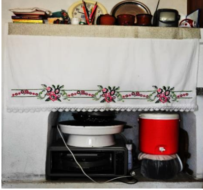
Fotoğraf 13. Ocak gergisi, Melek Yatakçı, Milas (Photo 13. Oven cover Melek Yatakçı Milas)

Genellikle ocak gergileri; 80x100 cm., ocaklık başı örtüleri ise 40x80 cm. boyutlarında olup, birer uzun kenarları kanaviçe işlemeli bordürler ile süslenmektedir. Ocak gergisi yörede "ocak peçesi" olarak da adlandırılmaktadır (Periye Çelebilik, Kişisel Görüşme, 22.06.2016) (Fotoğraf 13-14).