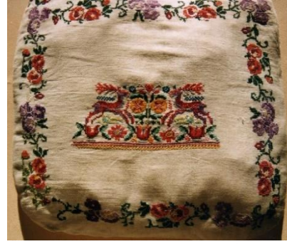
Fotoğraf 28. Yastık, Raziye Gümüş, Selimiye (Photo 28. Pillow, Raziye Gümüş, Selimiye)