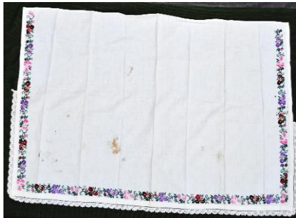
Fotoğraf 6-7. Dolap örtüsü, Ayten Sezgin, Milas (Photo 6-7. Cover wardrobe, Ayten Sezgin, Milas)