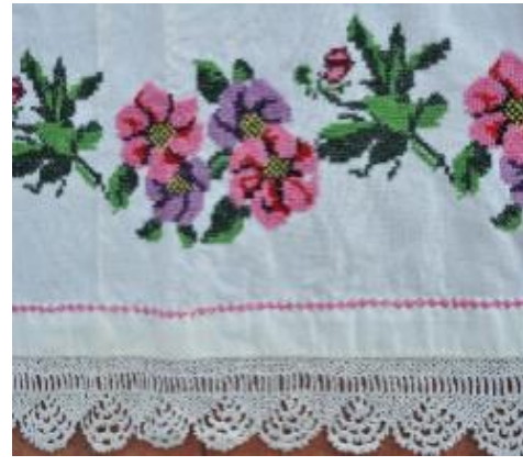
Fotoğraf 29-30. Yastık örtüsü, Hülya Sezgin, Milas (Photo 29-30. Pillow cover, Hülya Sezgin, Milas)

Yorgan kapağı; düğün ve doğum gelenekleri içinde çeyiz ve bebeğe eşya hazırlama adetlerinde önemli bir yer tutar. Yatak odası takımlarının bir parçasıdır. Yörede yorganlara "yorgan kaplama" adı verilen uygulama ile çarşaf dikimi yapılmaktadır. Çarşaf dikilen yorganlara kanaviçe işlemeli yorgan kapağı, üst kısmı ayak kısmından ayırt etmek ve süslemek amaçlı teyellenerek dikilmektedir. Uzun kenarı bordürlerle bezenen yorgan kapakları, 100x125 cm. boyutlarında dikdörtgen formundadır (Zuhal Kırcağız, Kişisel Görüşme, 30.09.2016) (Fotoğraf No:31-32).