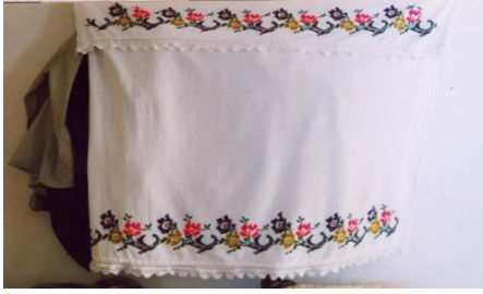
Fotoğraf 8. Elbise örtüsü, Özlem Özler, Derince (Photo 8. Dress cover, Özlem Özler, Derince)