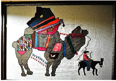
Fotoğraf 15. Pano, Zuhale Kırcağız, Milas (Photo 15. Wall frame, Zuhale Kırcağız, Milas)