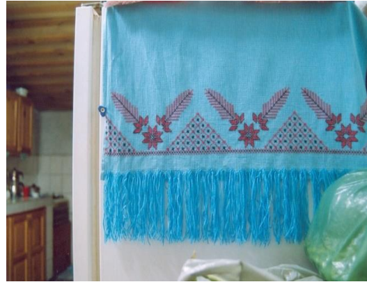
Fotoğraf 5. Buzdolabı örtüsü, Yeliz Akçin, Milas (Photo 5. Refrigerator cover, Yeliz Akçin, Milas)