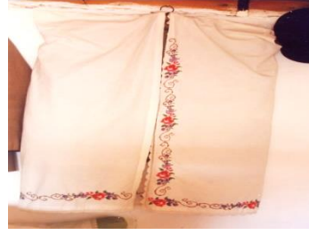
Fotoğraf 9. Elbise örtüsü, Mehmet Derince, Derince (Photo 9. Dress cover, Mehmet Derince, Derince)