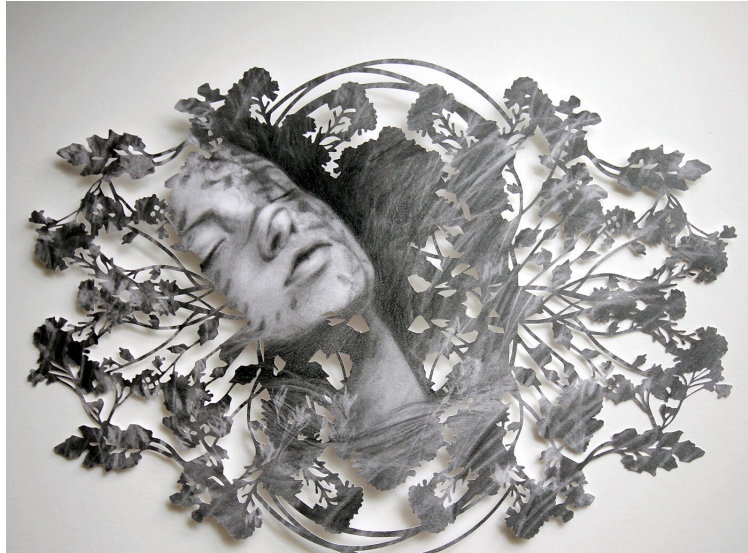
Resim 7. “İsimsiz” Gölge Kutusu Çerçevesine Monte Edilmiş Grafik Kâğıt Çizimi, 17x22 cm (2019)

Sanatçının bu ifadeleri ile bitkisel motifleri hangi amaçla kullandığını anlıyoruz. Eserlerinde kullandığı her nesne, parça ve kavramın bütünü oluşumundaki önemli etkisini vurgulayan sanatçı, raslantısallığın bilinçli hamlelere dönüşme sürecine de değiniyor. Eser oluşturulan süreçler sanatçılar için hem bilinçli hareket edilen hem de her hamle ile yeni bakış açılarının kapısının aralandığı sürprizlerle doludur. Christine Kim, kendi eser üretim süreçlerinde anlık gelişen görsel etkileri planlı bir şekilde kullanmaya başlamış ve kendi üslubunu domine eden tarzını oluşturmuştur.