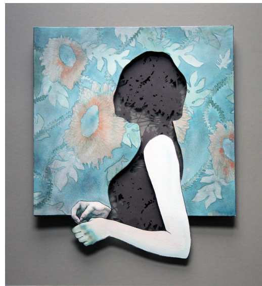
Resim 9. “Too Much Too Little 1ve 2”, Karışık Teknik Kolaj, 12x18 Cm, (2015)