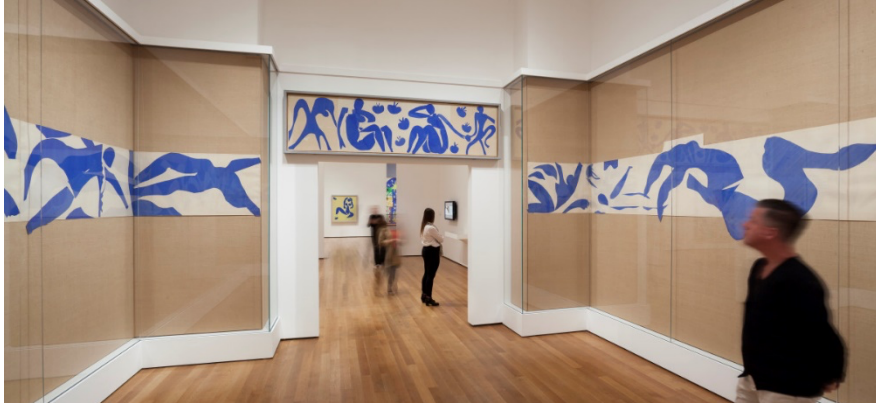
Resim 3. Henrie Matisse- New York Modern Sanat Müzesi

en ünlü eserlerini ürettiği yaşamının son on yılında renkli kâğıtlardan kesilmiş malzemelerle üretim yapmıştır. Bu "kesme" çalışmalarını "makasla çizim" olarak nitelendiren sanatçı, bu tekniği çeşitli boyut ve konulardaki çalışmalar için kullanmıştır. Matisse'in sanatının bu son dönemi, New York Modern Sanat Müzesi'ndeki "Henri Matisse: The Cut-Outs" ismiyle sergilenmektedir (Resim 3).