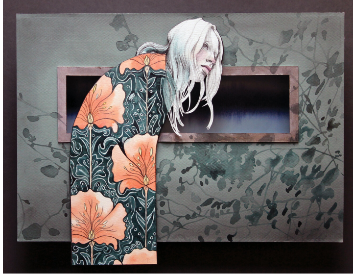
Resim 10. “All The More Near” Karışık Teknik Kolaj, 22x17 Cm (2015)

Kim, çürümenin, kırılmanın ve parçalanmanın rahatsız edici güzelliğini sunmaktadır. Aslında kağıt, bir materyal olarak, sığınak ve mahremiyetten bahsetmek için yüzey, ekran ve gölge olarak kullanmaktadır. Sanatçı bu serisini “bir zamanlar var olan ama artık olmayan bir odanın mahremiyetini yutan bir doğa akışını gözlemlemek olarak” yorumlamaktadır.