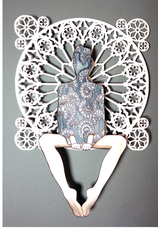
Resim 11. “Window Seat” Karışık Teknik Kolaj, 9x13 Cm (2015)

Window Seat (Resim 11) Cam Kenarı adını verdiği çalışmasında Kim, adeta motiflerden oluşan pencerenin kenarına oturan bir kadın figürü resmetmiştir. Buradaki kâğıt kesim biçiminde dekoratif geleneğe ait izler olsa da ön plandaki figürde daha güncel bir yorum olduğunu görmekteyiz. Mimari, moda ve insan vücudu arasındaki ilişkinin ortak ifadesini gördüğümüz bu eserde hem katman hem de derinlik olarak sanatçının amaçladığı heykelsi etkinin oluştuğu görülmektedir.