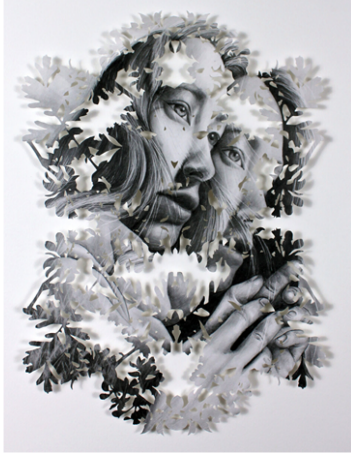
Resim 6: “İsimsiz” Gölge Kutusu Çerçevesine Monte Edilmiş Grafik Kâğıt Çizimi, 15x20 cm (2019)

Çalışmalarının çizim, boya kullanımı ve kâğıt kesme süreçlerinin bir kombinasyonunu içerdiğini söyleyen sanatçı, karmaşık katmanlı kolaj-portre illüstrasyonları oluşturmaktadır (Resim 5). Kimlikleri açığa çıkarmak ve gizlemek arasındaki ilişkiden etkilenen Kim, eserlerini bu düşünce ile üretmektedir. Portrelerin izleyici ile teması her ne kadar izleyicinin anlamlandırması ile değişken bir etki bıraksa da sanatçının “gizem” ve “çözümleme” terimleri odağındaki üretimleri mistik bir hava yaratmaktadır. Bu bağlamda incelendiğinde Resim 5’teki eserin gizlenme refleksi ile yüzünü saklayan bir figürün bitkisel formlarda kesilmiş kâğıt yüzeyindeki yansımaları görmekteyiz. Sanatçının eserlerini tanımlarken heykelsi ifadesini kullanmasının aslında iki boyutlu yüzeyde nasıl üç boyutlu bir derinlik kazandığını göstermektedir.