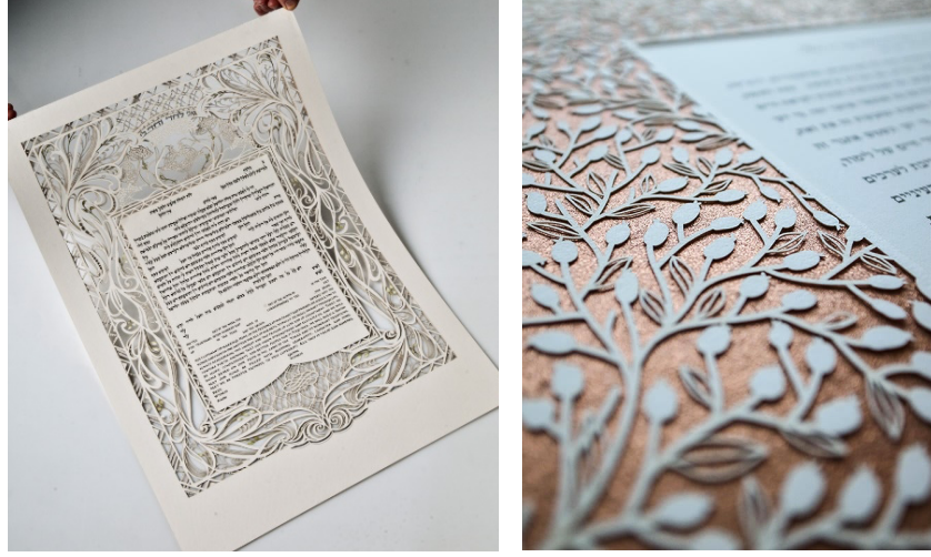
Resim 1. Ketubotu Örneği