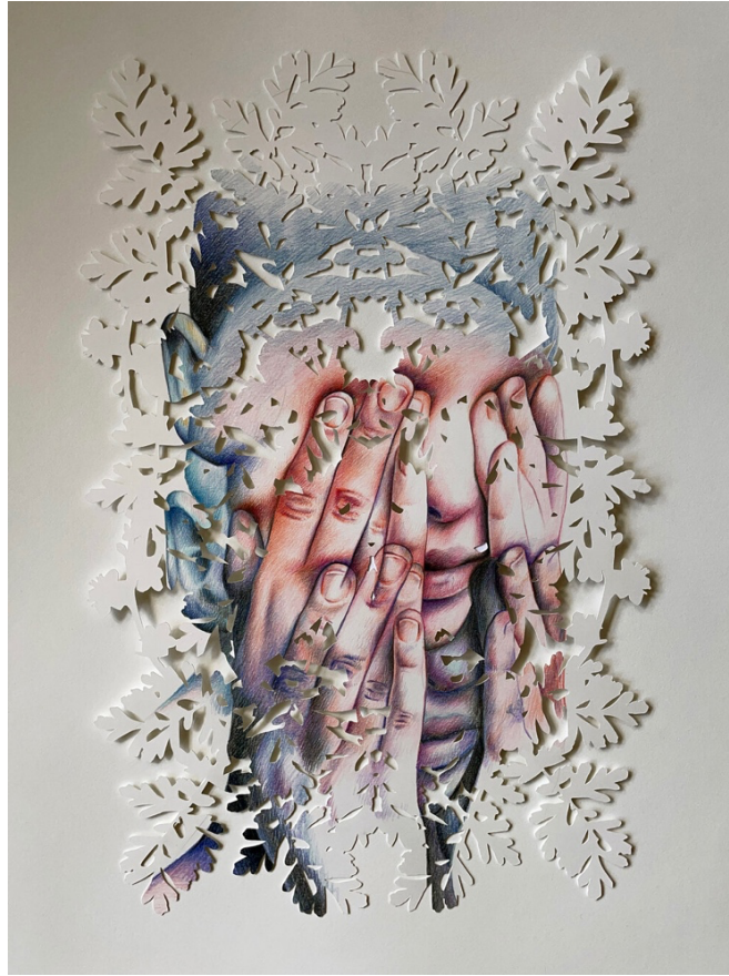
Resim 5: “Over And Over” Paper-Cut Üzerine Renkli Kalem 11x14 Cm (2021)

Karmaşık bir şekilde kesilmiş tek katmanlı çizimler üzerinde çalışan sanatçı, pozitif ve negatif alan arasındaki etkileşim üzerine gitmektedir. Yaptığı portre çizimlerinin kopyasını alıp her biri üzerine farklı kesim tasarımları kurgulamaktadır. Ayrıca kâğıt katmanlarının kendi içinde oluşturduğu gölgeler de eserlerin oluşumuna yön veren etkenlerdendir (URL 9).