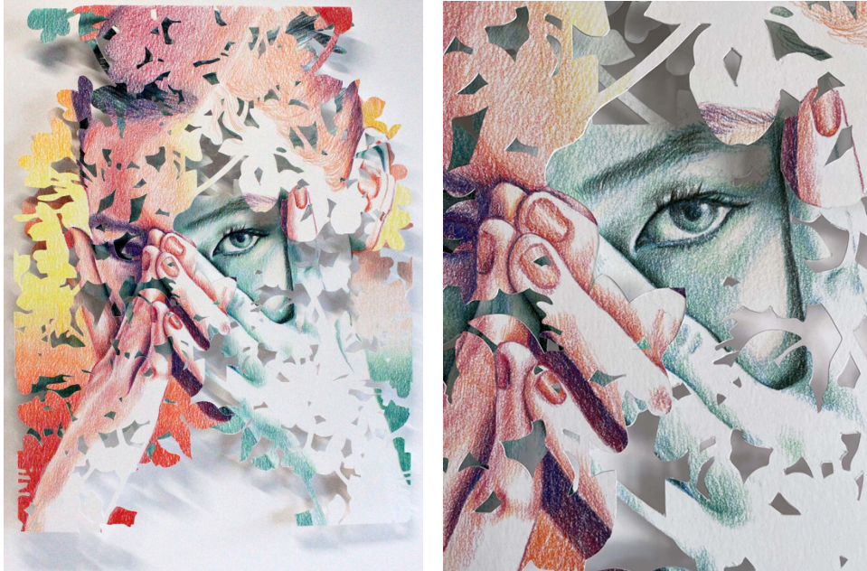
Resim 4. "We Are Shadows" Katmanlı Kâğıt Kesim Üzerine Renkli Kalem, 11x14 Cm, (2021)

Kâğıtla çalışmanın en iyi yanı onun uygun fiyatlı, geri dönüştürülebilir ve taşınabilir olmasıdır. Çizmek ve boyamak için harika bir yüzey olmasının yanı sıra, kesildiğinde ve boyandığında heykel formları alabilir. Kâğıdın her aşamada sanatçı için ulaşılabilir olması güzel bir durumdur (N.D. Dinç, Kişisel İletişim, 11 Ocak 2022).