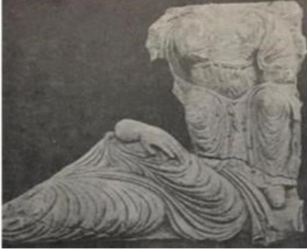
Resim 6 32

Yakalanmış yabani hayvanlar sahnesinde, çevredeki asma yapraklar, kıvrım dallar ve hayvanların hareketleri Suriye topraklarında bulunan Bizans tezyinatından alındığı görülmektedir. 31