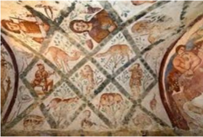
Resim 4 22

Bu vaziyet İslam dininin getirdiği ve Müslümanlar için ortaya koyduğu kuralların dışına çıktığının bir göstergesidir. Genel itibariyle Emevi yapılarında İslami hassasiyet geçerliliğini korurken maalesef halifelere ait bu tür saraylarda İslami kurallar dikkate alınmadan kural dışı figürler işlendiği bilinmektedir.. Figürlerin konusu çok geniş bir yelpazeden meydana gelmektedir. Meslek erbapları, av sahneleri, astrolojik semboller, mitolojik olaylar gibi değişik temalardaki figürlerle bezenen sarayda hamamda yıkanan kadınlar, çıplak halde duran dansözler, ( resim 2) geyiklerin ardında koşan tazılar gibi hayvan mücadelelerini de aktaran süslemeli figürlerde vardır. 21 Resim 4