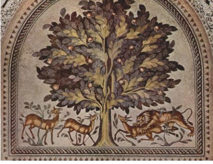
Resim 5 27

Kasru'l-Hayri'l Garbi sarayı, Palmyra'ya yakın eski ticaret yolu üzerinde Halife Hişam b. Abdülmelik tarafından yapılmıştır. Kare planlı olarak inşa edilen saray hamam, han ve bahçesiyle tam bir kompleks halinde görülmektedir. 28 Sarayın Palmyra'ya yolu üzerinde olması nedeniyle sarayda bulunan kabartmalarda Palmyra etkisi açıkça görülmektedir. Palmyra Emevî prenslerinin gençlik yıllarında gezdikleri bir yer olduğu bilinmektedir. Palmyra görkemi nedeniyle Araplar tarafından Süleyman Peygambere atfedilen şehirlerden biridir. Günümüzde bile görenleri hayran bırakan ihtişamlı yapısıyla bu kent Müslüman sanatkarlara sürekli ilham verdiği fark edilmektedir. 29