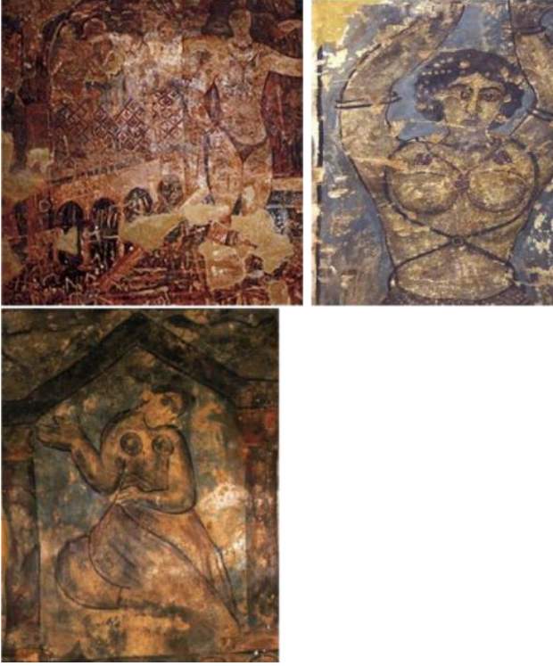
Resim 3 20

Bu vaziyet İslam dininin getirdiği ve Müslümanlar için ortaya koyduğu kuralların dışına çıktığının bir göstergesidir. Genel itibariyle Emevi yapılarında İslami hassasiyet geçerliliğini korurken maalesef halifelere ait bu tür saraylarda İslami kurallar dikkate alınmadan kural dışı figürler işlendiği bilinmektedir.. Figürlerin konusu çok geniş bir yelpazeden meydana gelmektedir. Meslek erbapları, av sahneleri, astrolojik semboller, mitolojik olaylar gibi değişik temalardaki figürlerle bezenen sarayda hamamda yıkanan kadınlar, çıplak halde duran dansözler, ( resim 2) geyiklerin ardında koşan tazılar gibi hayvan mücadelelerini de aktaran süslemeli figürlerde vardır. 21 Resim 4