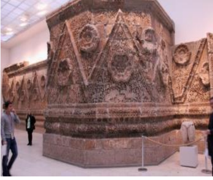
Resim 7 36