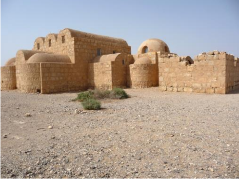
Resim 2 18

Emevi sanatı için oldukça önemlidir. 17 Dış cephe düzenlemesi bezeme açısından sade tutulmuşken, iç mekân oldukça yoğun bir süsleme programına sahiptir. Resim 2