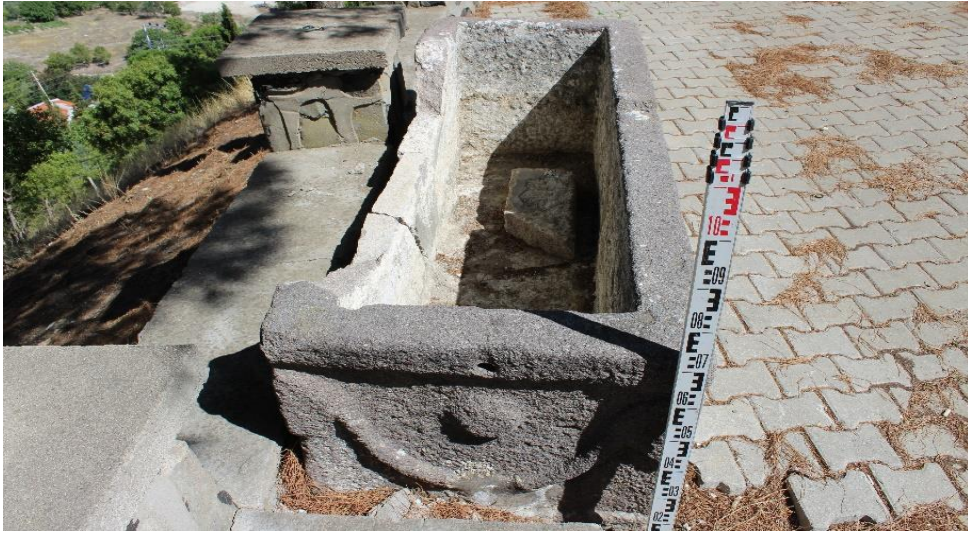
Resim 3: Lahit Sağ Yan Yüz Görünümü