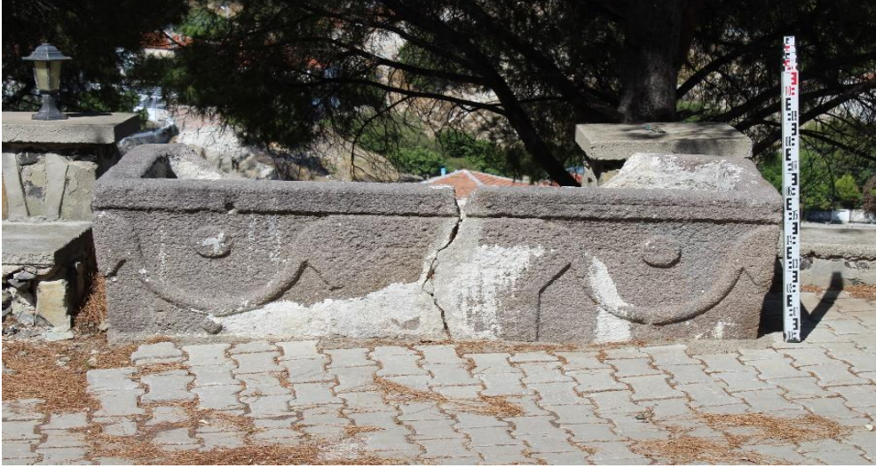
Resim 2: Lahit Ön Yüz Görünümü