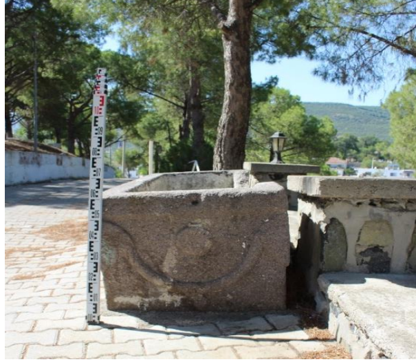
Resim 4: Lahit Sol Yan Yüz Görünümü