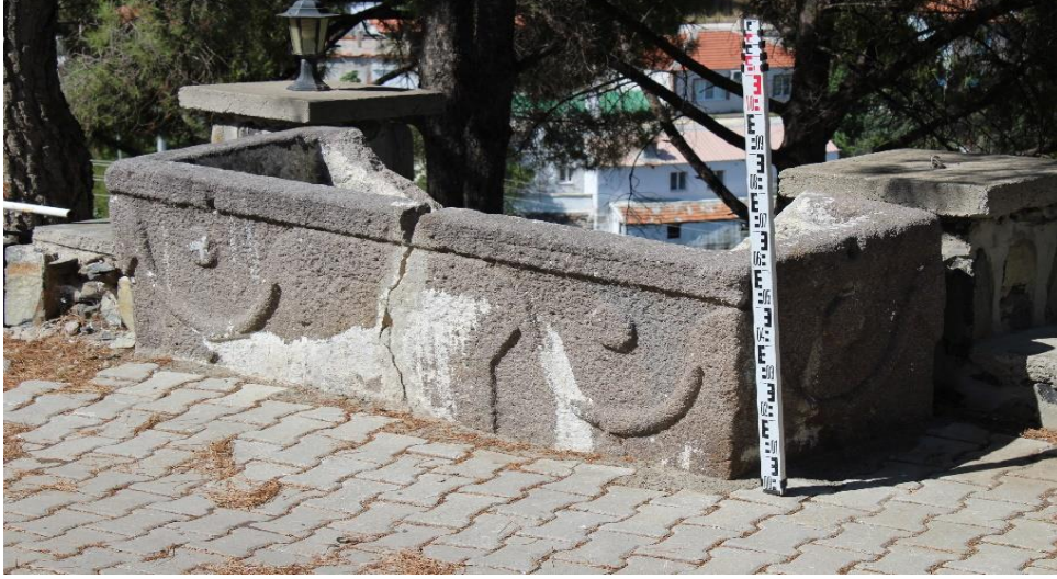
Resim 1: Lahit Genel Görünümü