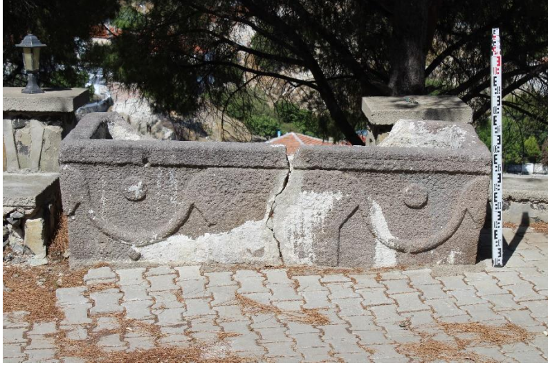
Resim 2: Lahit Ön Yüz Görünümü