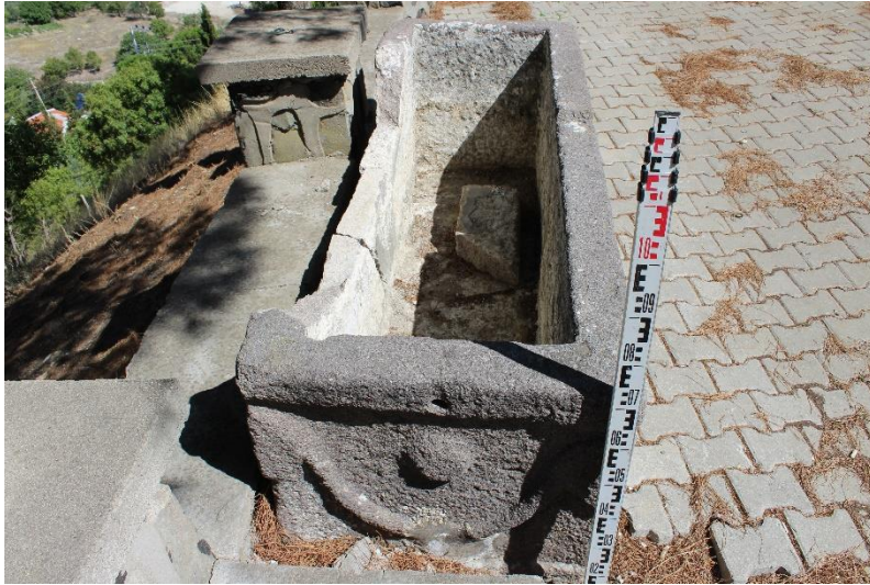
Resim 3: Lahit Sağ Yan Yüz Görünümü