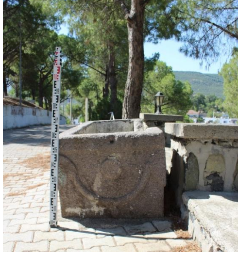
Resim 4: Lahit Sol Yan Yüz Görünümü