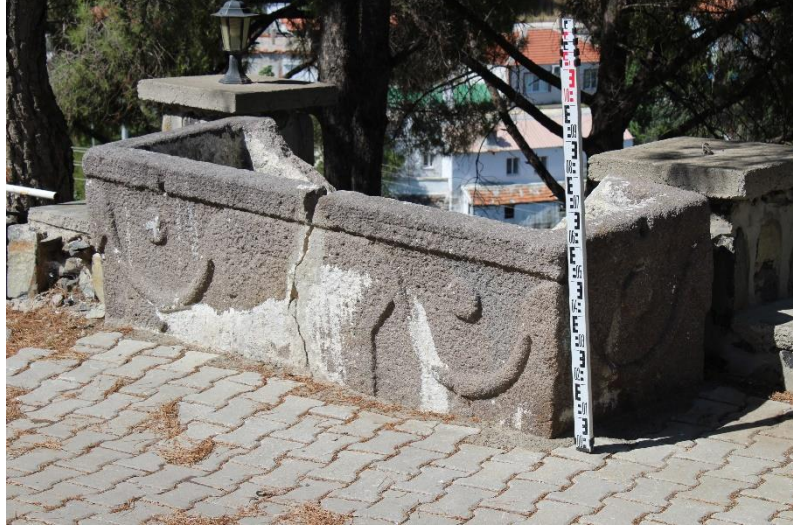
Resim 1: Lahit Genel Görünümü