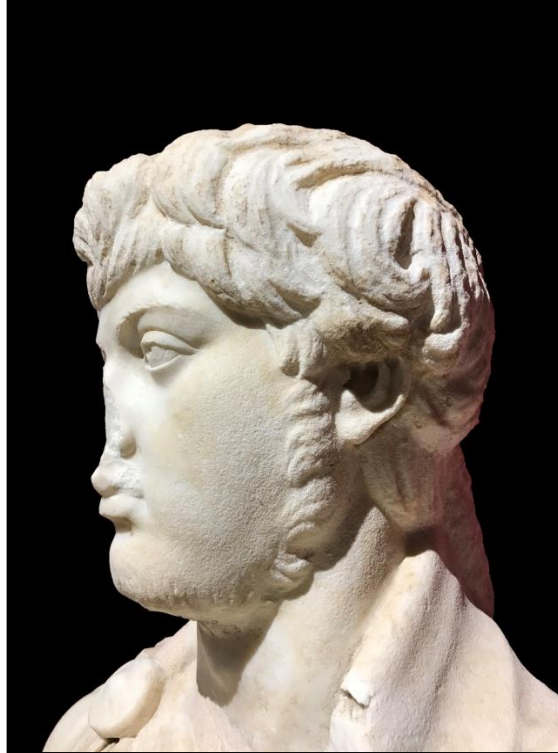
Resim 7. Portre Başın Sol Profilden Görünümü.