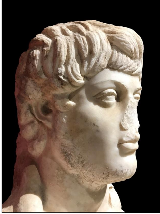
Resim 8. Portre Başın Sağ Profilden Görünümü.