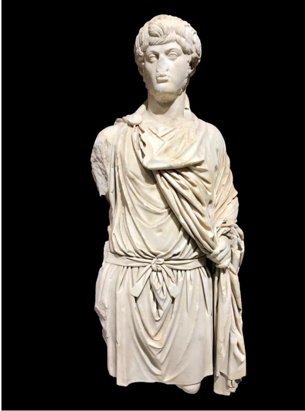
Resim 5. Portre Heykelin Cepheden Görünümü.