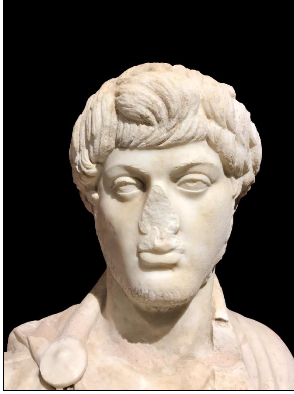
Resim 6. Portre Başın Cepheden Görünümü (Fotoğraf: Y. ARLI).