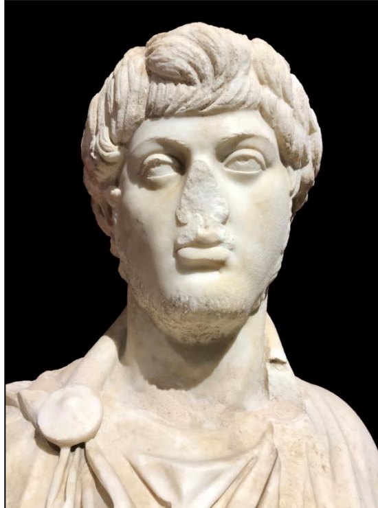
Resim 9. Portre Başın Cepheden Görünümü.