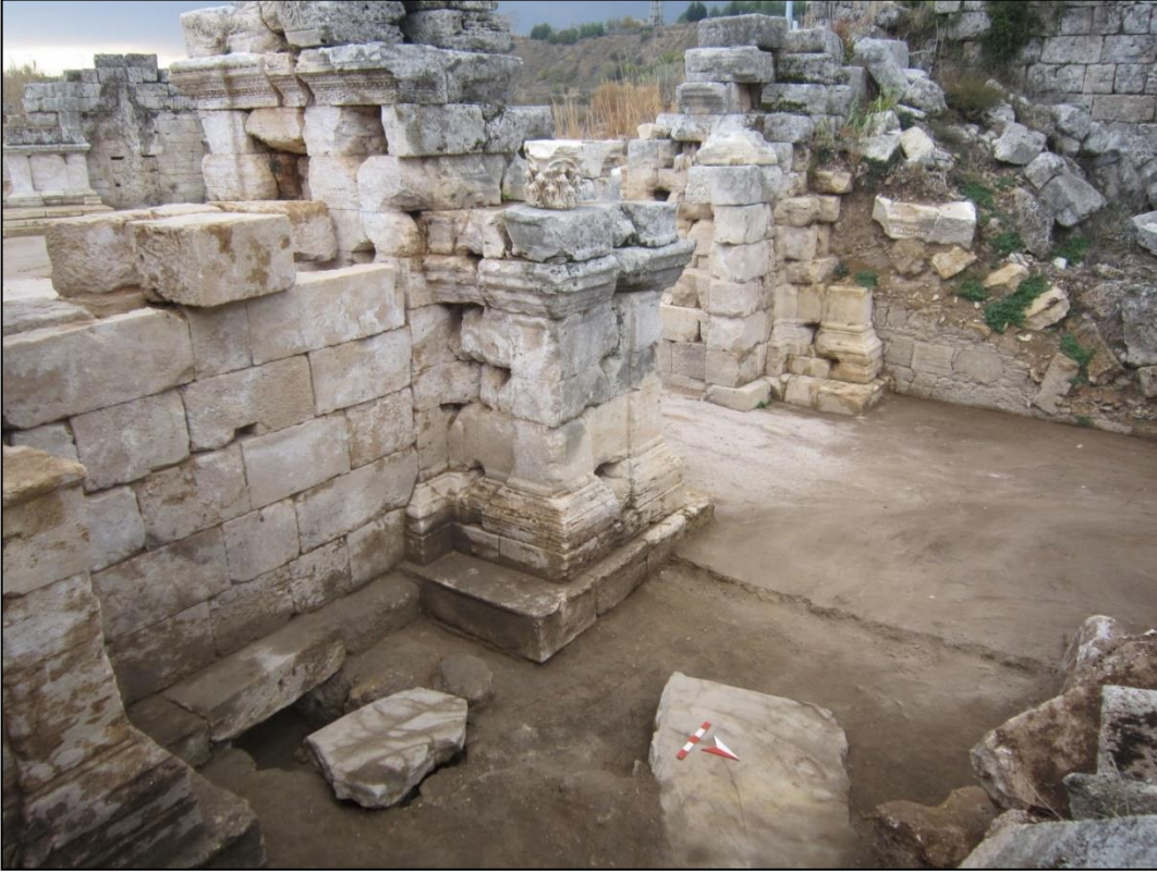
Resim 4. Kazı Sonrası Alanın Genel Görünümü.