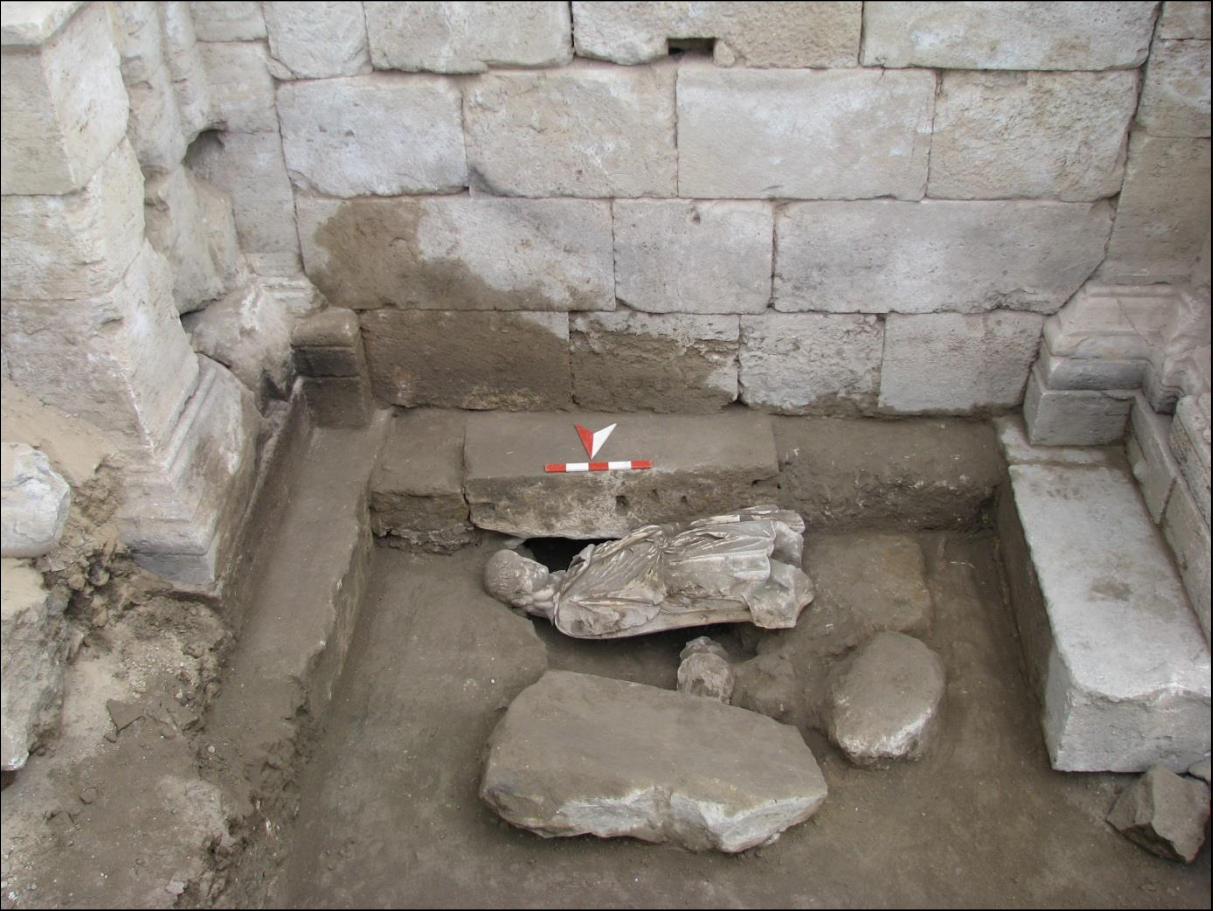
Resim 3. Heykelin Buluntu Durumu (Antalya Müzesi Perge Kazı Arşivi).