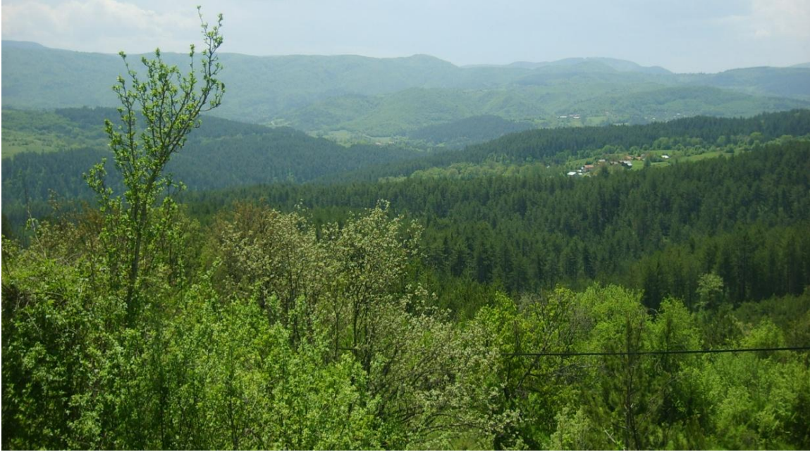
Şekil 3: Pazarköy kuzeyinden havzanın doğal görünümü

Karadeniz Bölgesi'nin batı bölgesinde yer alan Mengen Havzası (denizi olmayan) Karadenizin doğal güzelliklerini sunmaktadır. Bilindiği gibi, Karadeniz Bölgesi sahip olduğu doğal güzellikleri ile her zaman dikkat çekmiş, fakat turizm bakımından hak ettiği konuma hiçbir zaman gelememiştir.