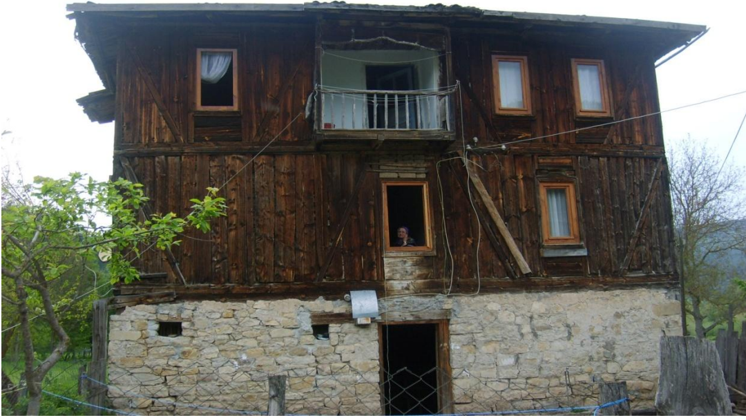
Şekil 10: Konaklamaya açılabilir meskenler

Mengen Havzası içinde yer alan Mengen evleri turizm faaliyetlerinde değerlendirilebilecek potansiyele sahiptir. Havza içinde eski evlerden mimari özellikleriyle dikkat çekenler orijinal plan ve malzemelerine uyarak yapılacak restorasyonlarla küçük butik oteller ve lokantalar oluşturularak hizmete açılması turizm bakımından önemli olacaktır. Bu sebeple tarihi doku bozulmadan turizm faaliyetine açılacak bu evler ile kültürel miras da korunmuş olacaktır. Görüldüğü gibi, Mengen Havzası'nda doğal turizm değerleri ve buna bağlı olarak potansiyeli umut vericidir. Sahip olunan bu değerleri planlı olarak turizme katmak havza geneline verilecek önem ve yatırımlara bağlıdır. Doğa turizmi yatırımlarının uzun vadeli kredilerle, yapılması imkân dahilindedir. Özellikle Avrupa Birliği'nin kırsal kalkınma alanında karşılıksız hibe şeklinde verdiği parasal yardımlar bu alanda takip edilerek değerlendirilmelidir.