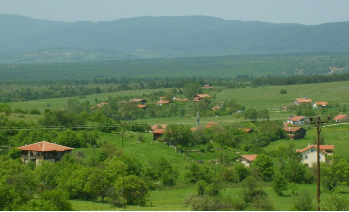
Şekil 4: Rüknettin Köyü ve havzaya bir bakış