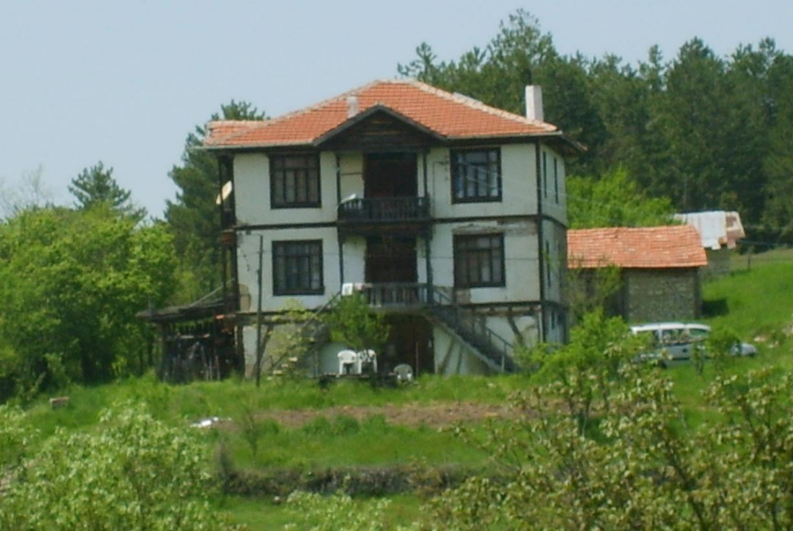
Şekil 6: Konaklamaya açılabilir meskenler

Eğlenme, gezme, görme, yeme-içme özellikle de dinlenme için bu havzaya gelen turistlerin buralarda ikincil konut sistemini harekete geçirebileceği ihtimali de yüksektir. Bu ikinci konutlar büyük şehirlerin kalabalık ve gürültülü hayatını insan üzerinde atmasını sağlaması bakımından tercih edilmesi mümkün olacaktır.