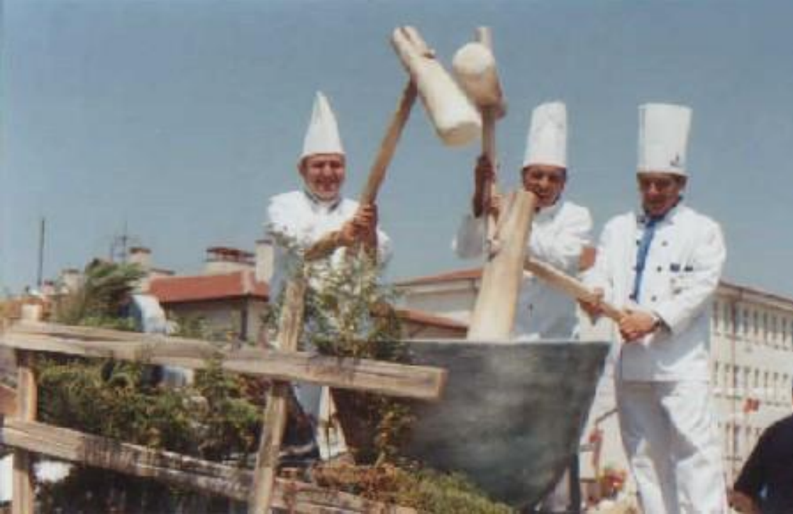
Şekil 7: Mengen’li aşçılar ve arka planda Mengen Aşçılık Meslek Yüksek Okulu

Eğlenme, gezme, görme, yeme-içme özellikle de dinlenme için bu havzaya gelen turistlerin buralarda ikincil konut sistemini harekete geçirebileceği ihtimali de yüksektir. Bu ikinci konutlar büyük şehirlerin kalabalık ve gürültülü hayatını insan üzerinde atmasını sağlaması bakımından tercih edilmesi mümkün olacaktır.