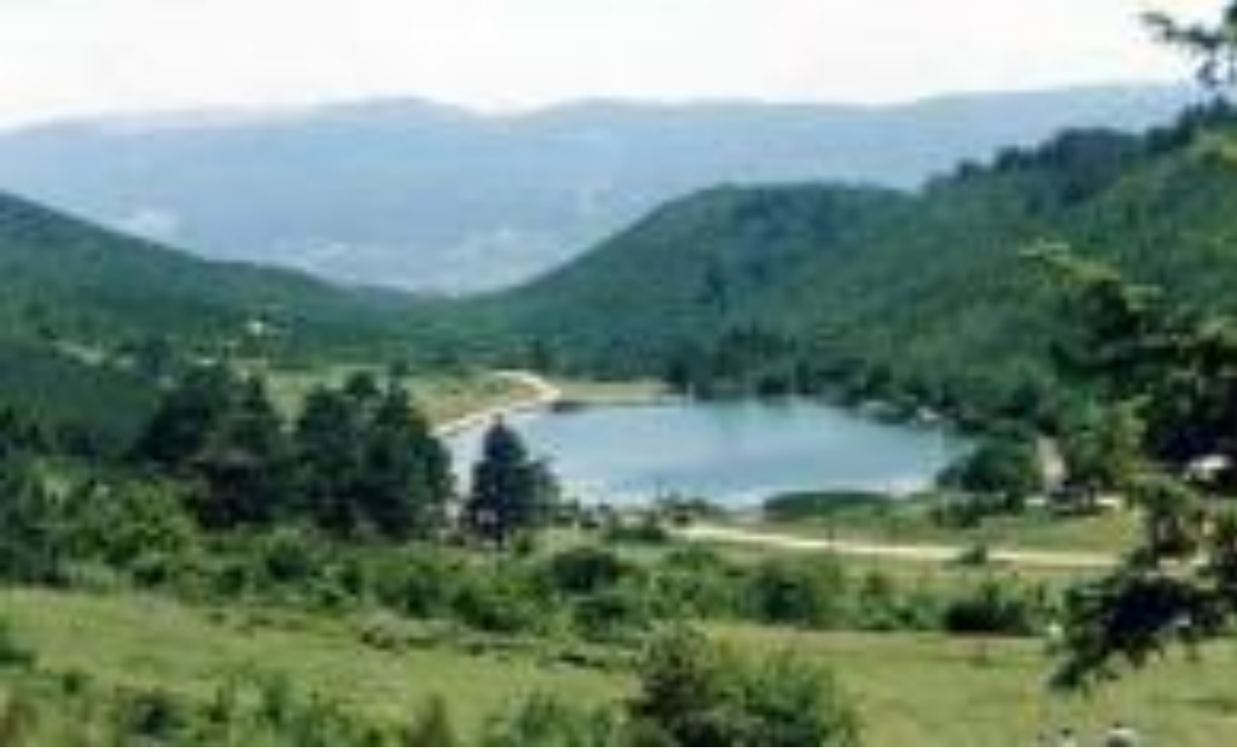
Şekil 9: Şirinyazı Gölü

Bu göller çalışma sahamızın doğal ortamını ve güzelliğini tamamlayan unsurlardır. Bu göllerin orman içinde muhteşem görüntü sağlaması dikkat çekmektedir. Göller çevresinde bazı yıllar Gençlik Spor Müdürlüğü'nce öğrencilere yönelik kamplar kurulmaktadır. Göller çevresinde ekolojik özelliklerini bozmadan kamp ve piknik alanları oluşturulmalı, koşu, yürüyüş ve bisiklet kulvarları yapılarak spora yönelik faaliyetler canlandırılmalıdır. Doğal çevre varlığı olarak görülen Geyikli gölü Yaban Hayatı Koruma Alanı ilan edilmiş, geyikler burada koruma altına alınmıştır.