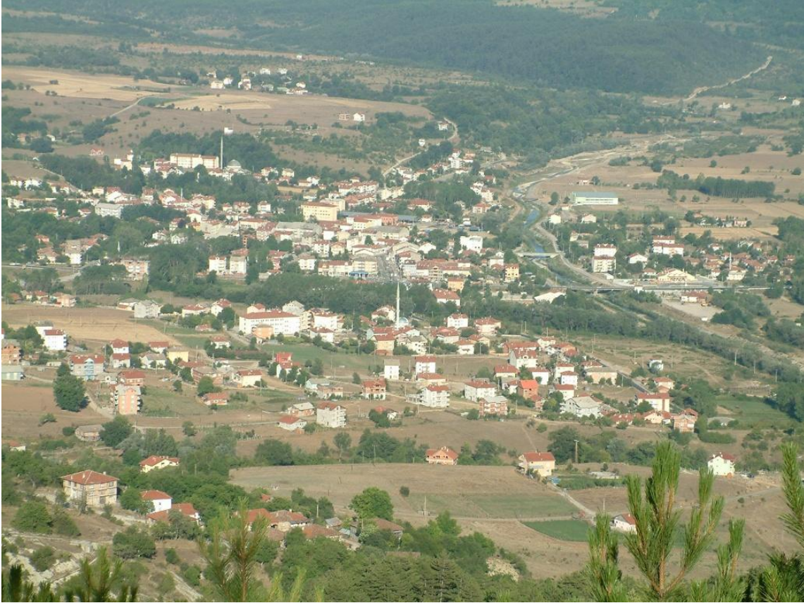
Şekil 2: Mengen şehri ve havzasından görünüm

Mengen havzası 849.9 km 2 alan kaplamakta olup, bunun yaklaşık olarak 650 km 2 si orman alanıdır. Bu ormanlık alanlar çalışma sahamızda doğal güzellik yaratmakta ve doğa turizmüne de imkân tanımaktadır.