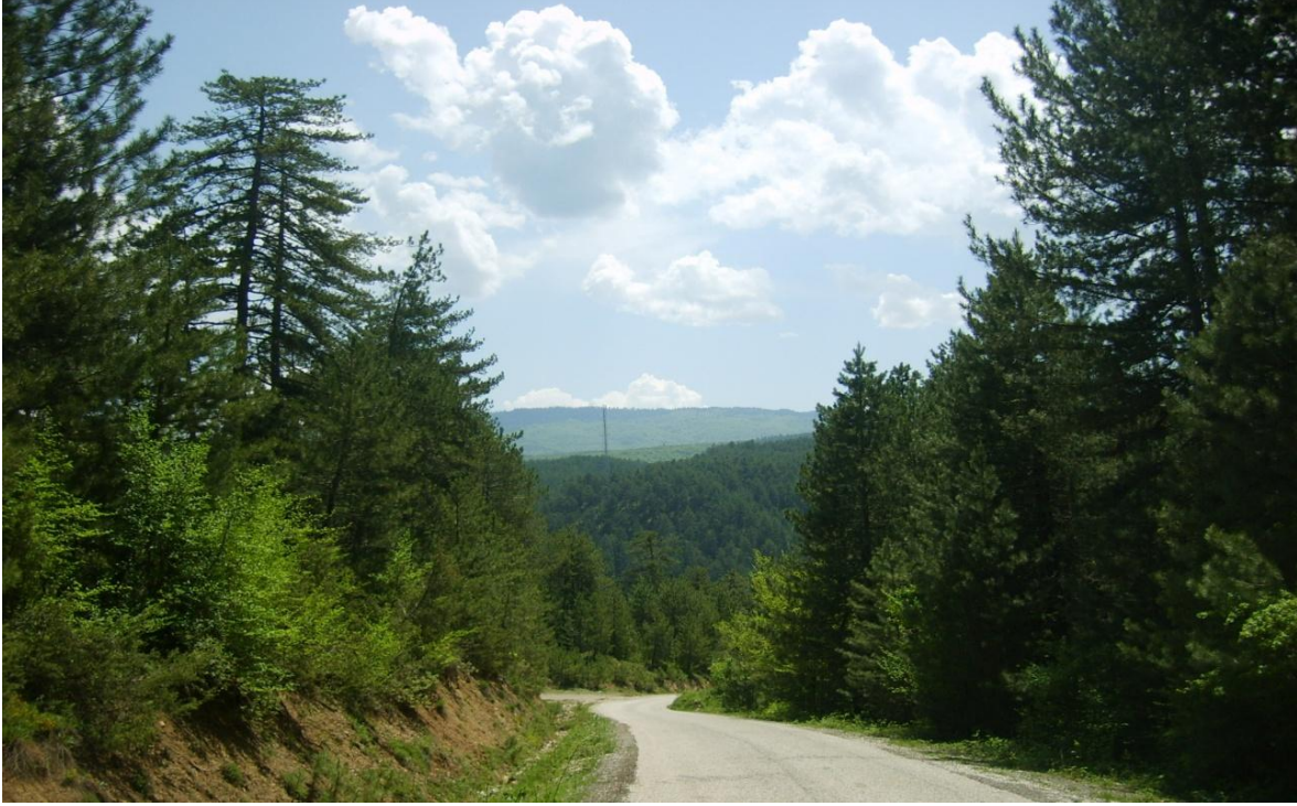
Şekil 5: Ulaşılabilir doğal güzellikler

Ülkemizde turizm faaliyetleri daha çok kıyı turizmi olarak algılanmakta ve yaşanmaktadır. Bu düşünce ve anlayışla ülkemizin sahip olduğu diğer doğal güzellikler sürekli ikinci planda kalmıştır. Mengen Havzası'nda da tarım, hayvancılık, ormancılık ve madencilik gibi iktisadi faaliyetleri yaşarken, sahip olduğu doğal güzelliklere rağmen turizm fonksiyonu kazanamamıştır. Çalışma sahamızda tarihsel sürece bağlı olarak kültürel turizm, yayla turizmi, spor turizmi içinde doğa yürüyüşü ve koşuşu, kamp ile piknik, golf ve avlanma turizmi oluşturulabilir.