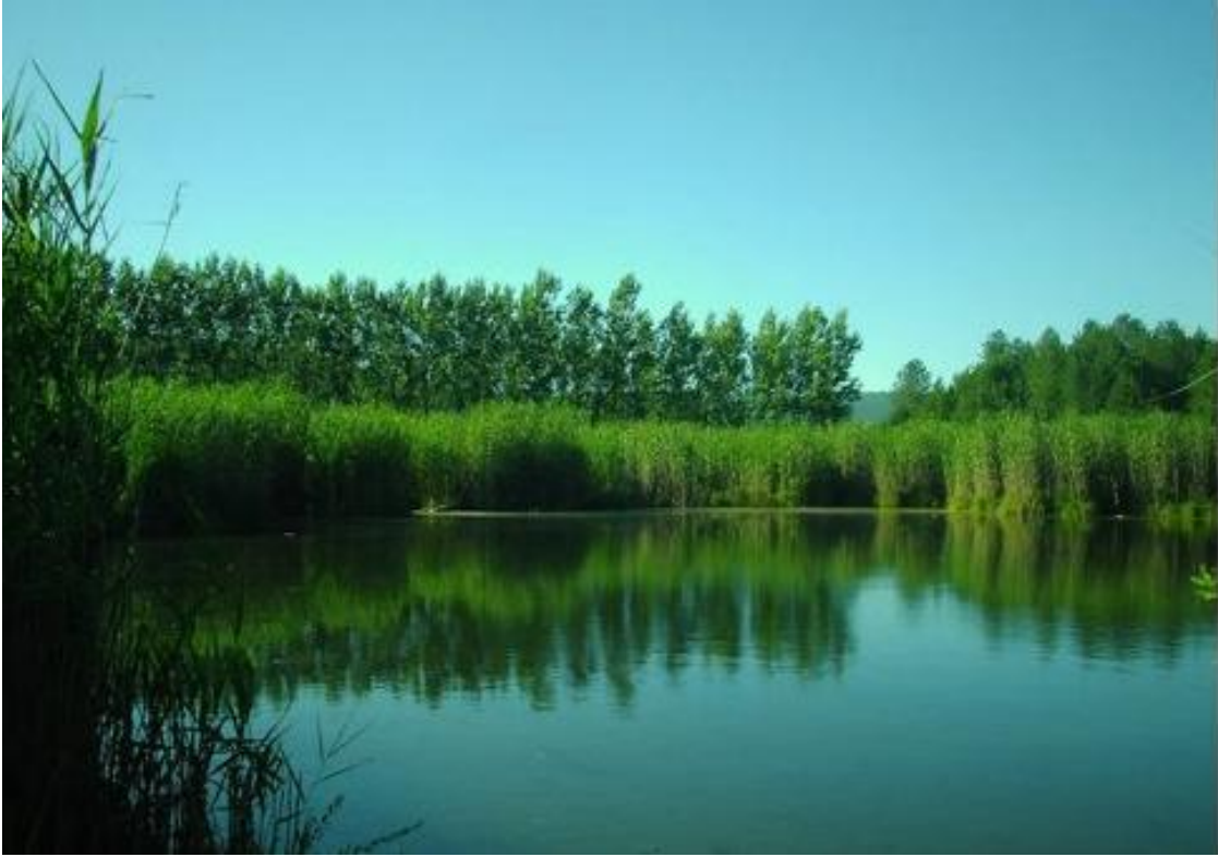
Şekil 8: Ağalar Gölü

Mergen Havzası'nda dikkat çeken doğal göller bulunmaktadır. Bu göller Şirinyazı, Hızarderesi, Ağalar, Ödek, Sinan gölleridir. “Göllerin turizm açısından asıl büyük çekiciliği, bitki örtüsü ve faunayı su ortamıyla birlikte sunmaları ve özellikle yaz aylarında kalabalıklaşan deniz kıyılarına göre daha sakin olmalarıdır” (Doğaner, 2001: 93). Gerçekten de havzadaki göller görülmeye değer nitelikte olup yıl boyunca insanları kendine çekebilecek doğal güzelliktedir.