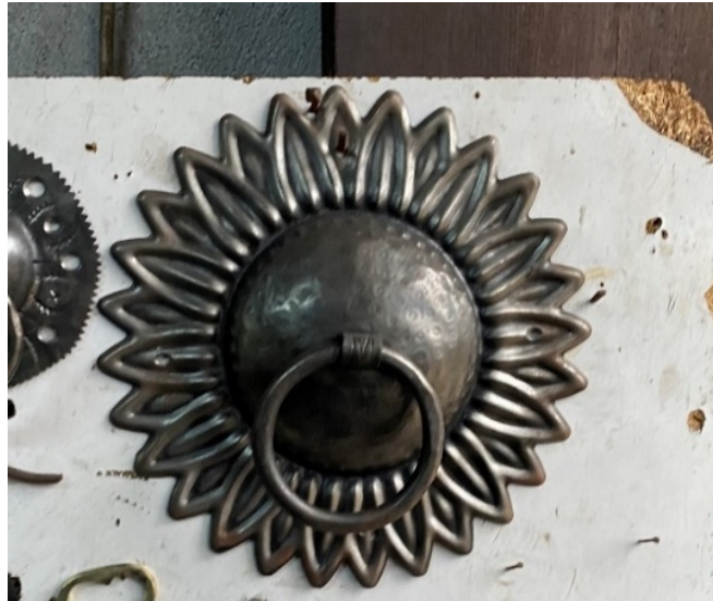
Resim 1: Kadınların kapı çalmak için kullandığı kapı tokmağı için örnek görsel (Hüseyin Şahin Özdemir’in eseri).

“Eski dönemlerde evlerde elektrik yoktur. Ev ahalisinde rastgele kapı açamayacak durumda olanlar vardır. Gelen kişi kadın ise evdeki kadın açar, erkek misafir gelirse evdeki erkek kapıyı açar. Bunun için iki farklı tokmak vardır. O zamanki insanlar buna göre eğitilmiştir, kimin çaldığını bu şekilde anlar. Erkek tokmağı daha tok bir ses çıkarır, kadın tokmağı ise daha az” (Özdemir, 2021).