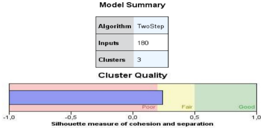
Şekil 1. İki Aşamalı Kümeleme Analizi Özet Tablosu

İki aşamalı kümeleme analizi özet tablosuna göre analize dahil edilen değişken sayısı 180, belirlenen küme sayısı 3'tür. Analize dahil edilen değişkenler ankette sorulan sorulardır ve ekte yer almaktadır. Bu çalışmada yapılan iki aşamalı kümeleme analizinin performans değerlendirmesinde Silhouette değerine yer verilmiştir. Bu değer Rousseeuw (1987, s.57-59) tarafından geliştirilmiş olan ve kümeleme analiz sonuçlarını değerlendirmek üzere kullanılan bir performans ölçüsüdür. Silhouette indeksi her bir birimin yer aldığı kümeye uygunluğunu belirlemek amacı ile geliştirilmiştir. Silhouette değeri 1'e yaklaştığında kümeleme performansı iyi, 0'a yaklaştığında ise kümeleme performansının kötü olduğu söylenebilmektedir. Şekil 1'de sunulduğu üzere iki aşamalı kümeleme analizi genel performans sonucunu gösteren Silhouette değeri incelendiğinde bu değer orta düzeyde olduğu ve kümeleme performansının kabul edilebilir seviyede olduğu görülmektedir.