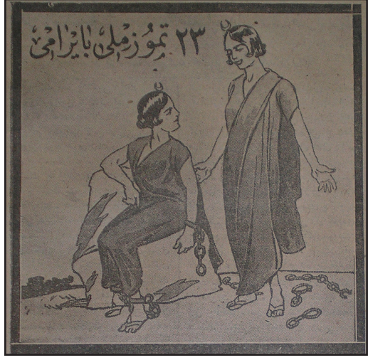
Cumhuriyet, 23 Temmuz 1925

Bu anlamlı günün her yıl kutlanması gerektiğini düşünen bazı Mebusan Meclisi üyelerinin sundukları önerge sayesinde 10 Temmuz (Miladi: 23 Temmuz 1908) günü ulusal bayram olarak kabul edildi ve her yıl resmi makamlar ve halk tarafından coşkulu bir şekilde kutlanmaya başlandı. Meşrutiyet gibi önemli bir kavramın halk nezdinde anlamını bulması ve yerleşmesi bakımından büyük önem taşıyan Hürriyet Bayramı, Cumhuriyet'in ilanından sonra da kutlanmaya devam etti. I. Dünya Savaşı'nın patlak vermesiyle Ulusal bayram kutlamalarındaki coşku daha da arttı. Benzeri örnekleri bugün bile karşımıza çıkmaktadır. Ulus olma