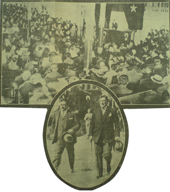
İstanbul Üniversitesinde Lozan Günü Kutlamaları

durumlarla Türkiye büyük devletlerle aynı ayak üzerinde konuşmuştur... Bu konferansta Türkiye, tam egemenlik ve bağımsızlık noktasında ısrar etmiştir. Artık bu devlet kendi başına yürümeyi istemektedir..." 10 .