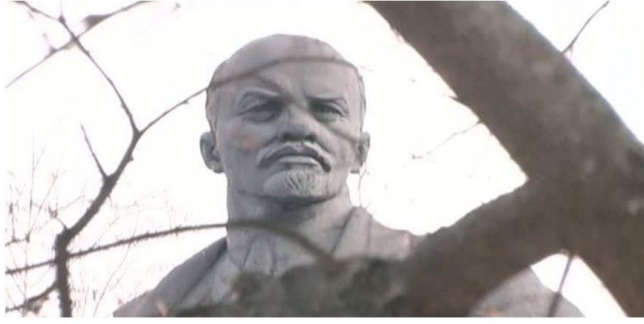
Şekil 7. Vesti.Ru haber sitesinde 22.02.2014 tarihli haber

"Ленинопад": за сутки на Украине снесли 16 памятников