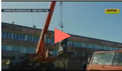
Şekil 4. NTN haber sitesinde 24.02.2014 tarihli haber