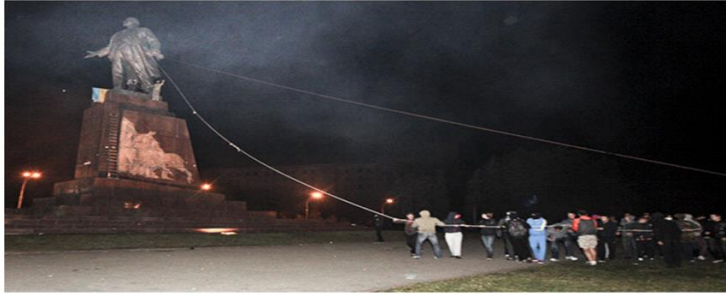
Şekil 8. Rbc.ru haber sitesinde 28.09.2014 tarihli haber

Милиция сначала открыла уголовное дело, однако позже оно было закрыто по распоряжению губернатора.