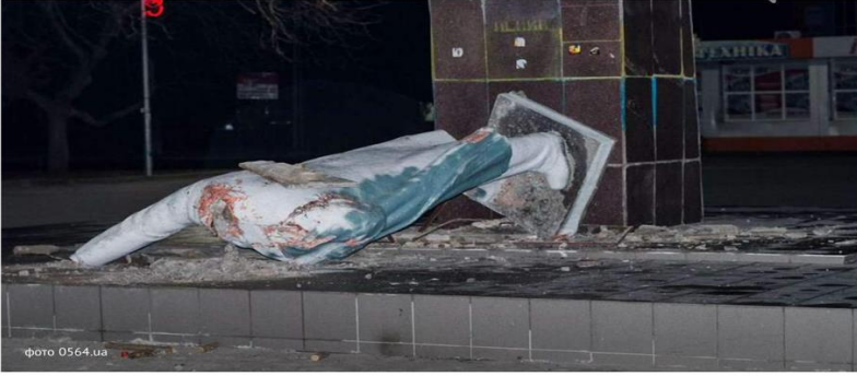
пам'ятник Леніну у Кривому Росі

Суспільство — Оксана Руда, 13:35, 12 листопада 2014 1057 0