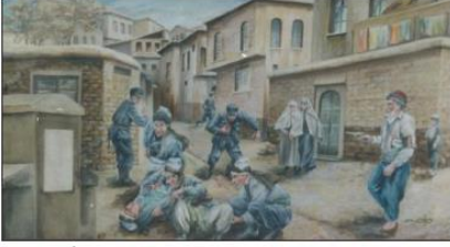
Sütçü İmam'ın Uzunoluk Çarşısı'nda Fransızlara karşı sığıdığı kurşunu anlatan temsili tablo

Ders Kitabı'nda verilen resim ve fotoğraflar şöyledir: