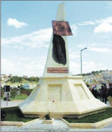
Kurtuluş Şehitleri Anıtı (Şanlıurfa-1987)