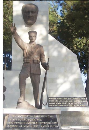
Şahin Bey adına dikilen anıt (Gaziantep)