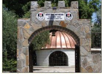
Sütçü İmam'ın Anıt Mezarı-Kahramanmaraş