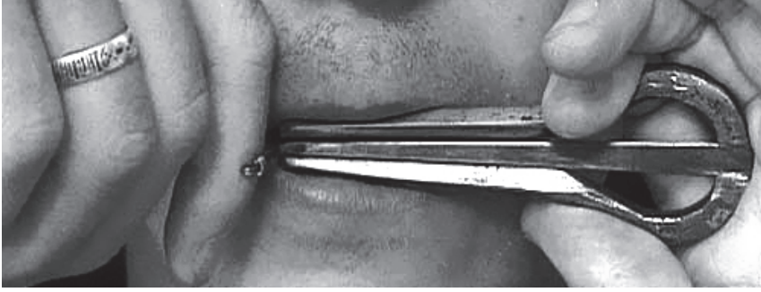
Resim 4. Varganın ağızda tutuluşu

Vargan notaları yazma sistemlerinden genellikle ve en sık olarak kullanılanı, aşağıda örnek olarak verilmiştir (Şekil 3 ve Şekil 4). Görünüm olarak standart Avrupa nota yazımını andırır; ancak daha basitleştirilmiş bir şeklidir. Bütün melodiler do majör tonalitede yazılır; notalar belli bir sesin tonunu değil, belli bir doğuşkanı gösterir. Böylelikle notanın transpoze edilmesine gerek kalmaz. Bu sistem herhangi bir tona ayarlanmış çalgı için kullanılabilir.