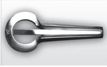
Resim 2. Yakut varganı