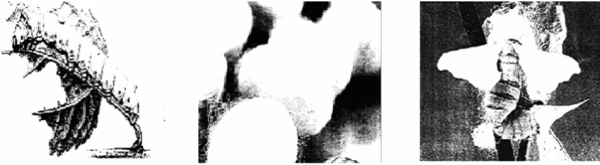
Resim 3: Beyaz dut ağacı (Morus Alba) İpek böceği kurdu, kozası ve kelebeğe dönüşümü (Drege-Bührer 1989: 23-25).

Çin’de yetişen iki cins dut ağacı vardır; birisi yaban, diğeri kulture edilmiş olanı. Morus Alba denilen kulture edilmiş dut ağacı, kalın ve geniş yapraklı olanıdır. Bunlar, Bombyx Mori L cinsinin beslendiği ağaç cinsi olup ipeğin kalitesinde önemli rol oynar. Yaban olan dut ağacında kaliteli ipek böceği yetişmez. Çin’de verimli, sağlıklı dut ağacı yetiştirmek, büyütme geleneksel bir uygulama olmuştur. Bugün aşılama suretiyle de kulture dut ağacı yetiştirilmekte, ekildikten 5 yıl sonra ipek böceği kurduunun besleneceği ağaç haline getirilmektedir (Drege-Bührer 1989: 24).