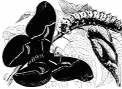
Resim 1: Ailanthus - yaban ipeği kelebeği, kurdu ve kozau (Rehmons, s. 277)