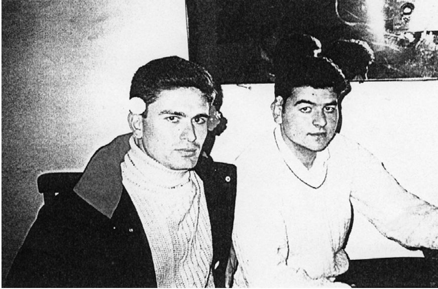
F.1. Yağşılar köyünden, nişanlı bir delikanlı (çift çiçekli=nişanlı) ile, Tekeler köyünden, sözlü bir delikanlı (tek yün çiçekli=sözlü) bir bayram günü Yağşılar köyü kahvesinde “muhabbet ederken”