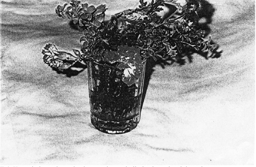
F.4. Kız evinden oğlan evine bayramda gönderilmiş nişan çiçeği demeti