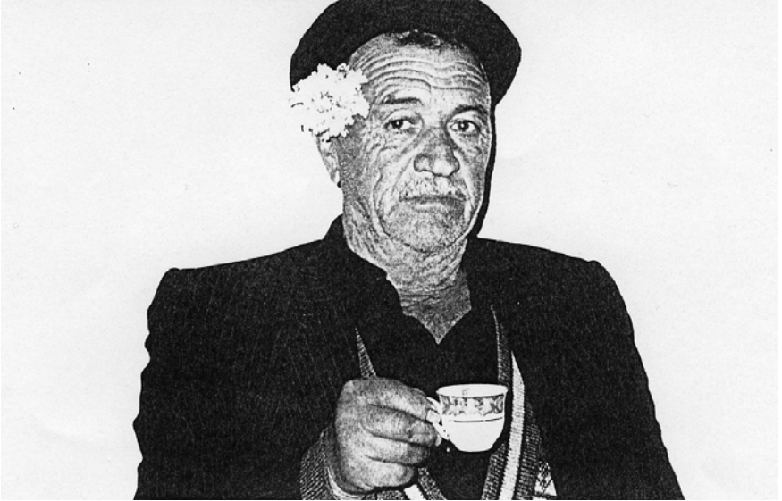
F.3. Bir bayram günü akşamı Yađşılar köyü kahvesinde bir köylü. (taze, tek çiçekli=evli).