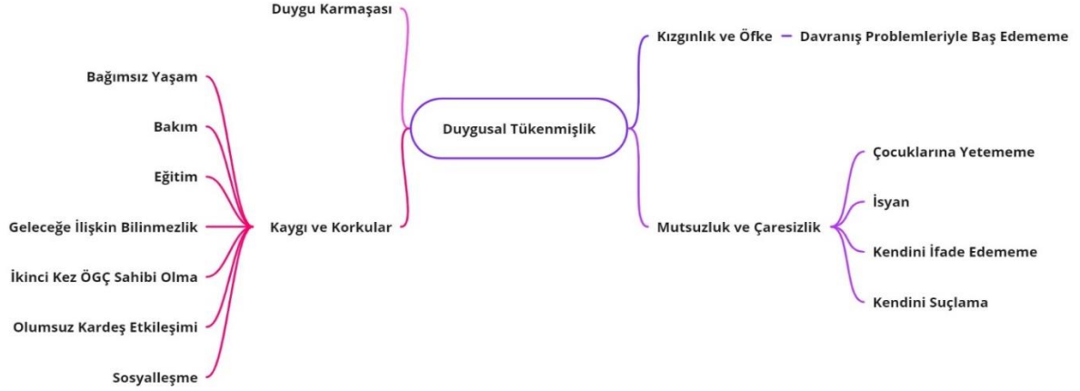
Şekil 1. Duygusal tükenmişlik