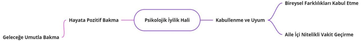
Şekil 2. Psikolojik iyilik hali