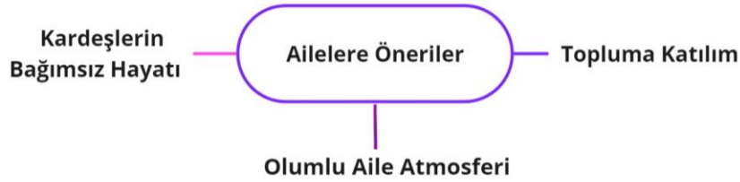
Şekil 6. Ailelere öneriler