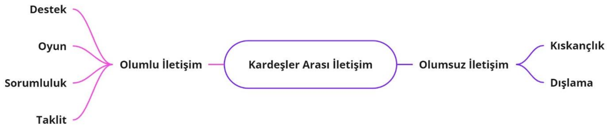
Şekil 4. Kardeşler arası iletişim