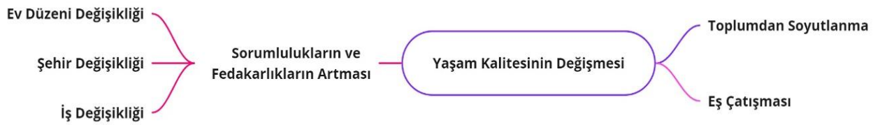
Şekil 5. Yaşam kalitesinin değişmesi