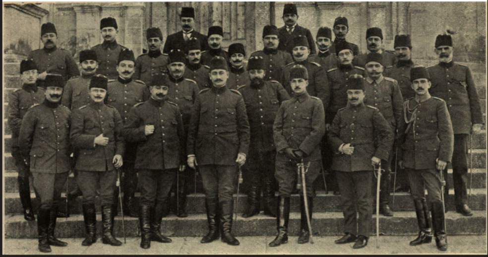
Menzil Müfettişliği Heyeti

14 Nisan 1913 tarihinde Şehbal gazetesinde; tam olarak anlayışlamamış olan ve Harbin başlangıcından ateşkes kadar kendisinden beklenen performansı gösteremeyen Menzil Teşkilatı'nın iase ve geri hizmetleri layıkıyla yerine getirememesinden dolayı Osmanlı Ordusu'nun başarısızlığının en önemli sebepleri arasında gösterildiği anlatılmaktadır. Bu nedenle kötü gözle bakılan teşkilatın lağvedilmesinin bile gündeme geldiği ifade edilmiştir. Seferber bir ordunun savaşta ikmal ve iasesinin sağlanarak başarılı olabilmesinin, doğru bir şekilde teşkil edilmiş menzil teşkilatı ile tesis edileceği değerlendirilerek bu düşünceden vazgeçildiği anlaşılmıştır. Habere göre menzil teşkilatında görevli personelin gayretli çalışmaları sonucunda Osmanlı Ordusu'nda uygulanamayacağı düşünülen "mühim ve nazik menzil hidematı yeniden" düzenlenerek ihtiyacı karşılanmıştı. Yine aynı yazıda çalışkan ve uzman personel sayesinde banka muamelatı kadar nazik ve zor bu işin üstesinden gelinerek, Osmanlı Ordusu'nun ihtiyacının Bulgar Ordusu'na kıyasla daha uygun bir şekilde düzenlemeye başlandığı dile getirilmiştir 97 .