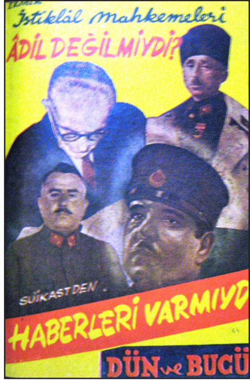
Dün ve Bugün Dergisinin 21 Eylül 1956 tarihli 44. sayısının kapağı