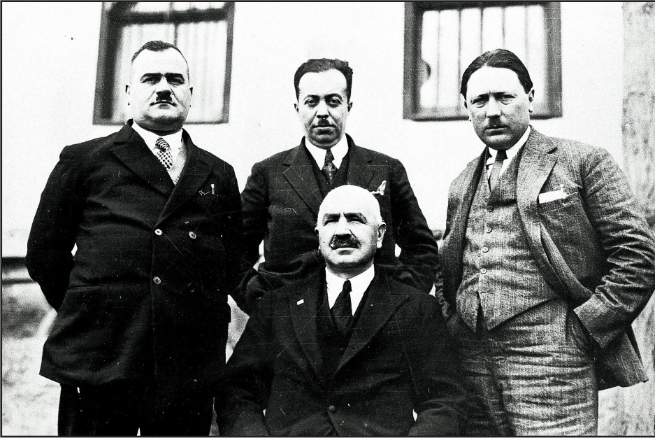
Ankara İstiklal Mahkemesi Üyeleri

Mevlit için Şişli Camii avlusunda toplanan kalabalık içerisinde eski İttihatçılar önemli bir yer tutuyorlardı. Saat 16 dolaylarında başlayan mevlide mahkûmların aileleri ve yakınlarının yanı sıra hatırı sayılır bir meraklı izleyici grubu da eşlik ediyordu. Hafız Esad Gerede, Hafız Mecid Sesigür, Hafız Cevdet Soydanses gibi dönemin saygın hocaları tarafından okunan mevlit, duaların ardından sona ermişti 2 .