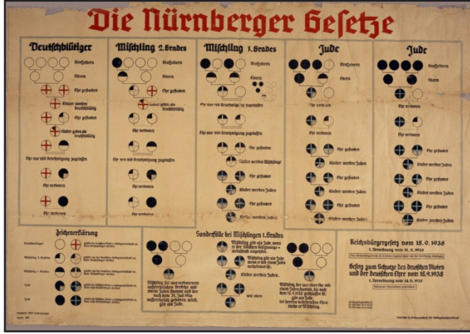
Tablo: 1935 Alman kanununun saflığını grafiklerle gösteren bir tablo 10

Kamu görevlilerinin durumunu düzenleyen 1933 tarihli yasada kullanılan ölçütler, insanları arischer Abstammung (Aryan soyundan olanlar) ve nicht arischer Abstammung (Aryan soyundan olmayanlar) olmak üzere iki sınıfa ayırmaktaydı. " nicht arischer Abstammung " (Aryan soyundan olmayanlar) ifadesiyle Yahudilerin kastedildiği belliydi. Zira Nasyonal Sosyalist terminolojide Arier (aryan veya indo-cermen) sözcüğü, deutschblütig (Alman kanından olan) ve nichtjüdisch (yahudi olmayan) ile aynı anlama gelecek şekilde kullanılmaktaydı. Yahudiler dışında çingener ve Avrupa dışında kalan ırklar ise yabancı ( artfremd ) sayılmaktaydı 11 .