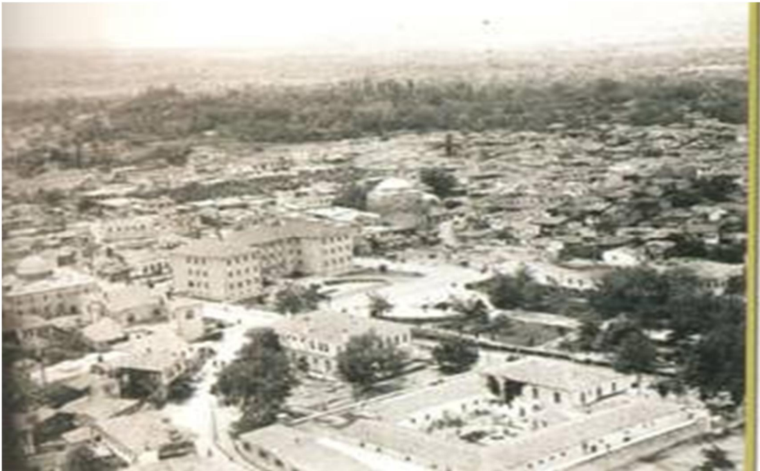
Şekil-9: 1950'lerde çekilen bu resim kentin eski mekansal özelliklerini (Yeni Hükümet Binası dışında) Cumhuriyet Döneminde de koruduğunun bir göstergesidir (Kaynak: Isparta 1880-1980, 2001)