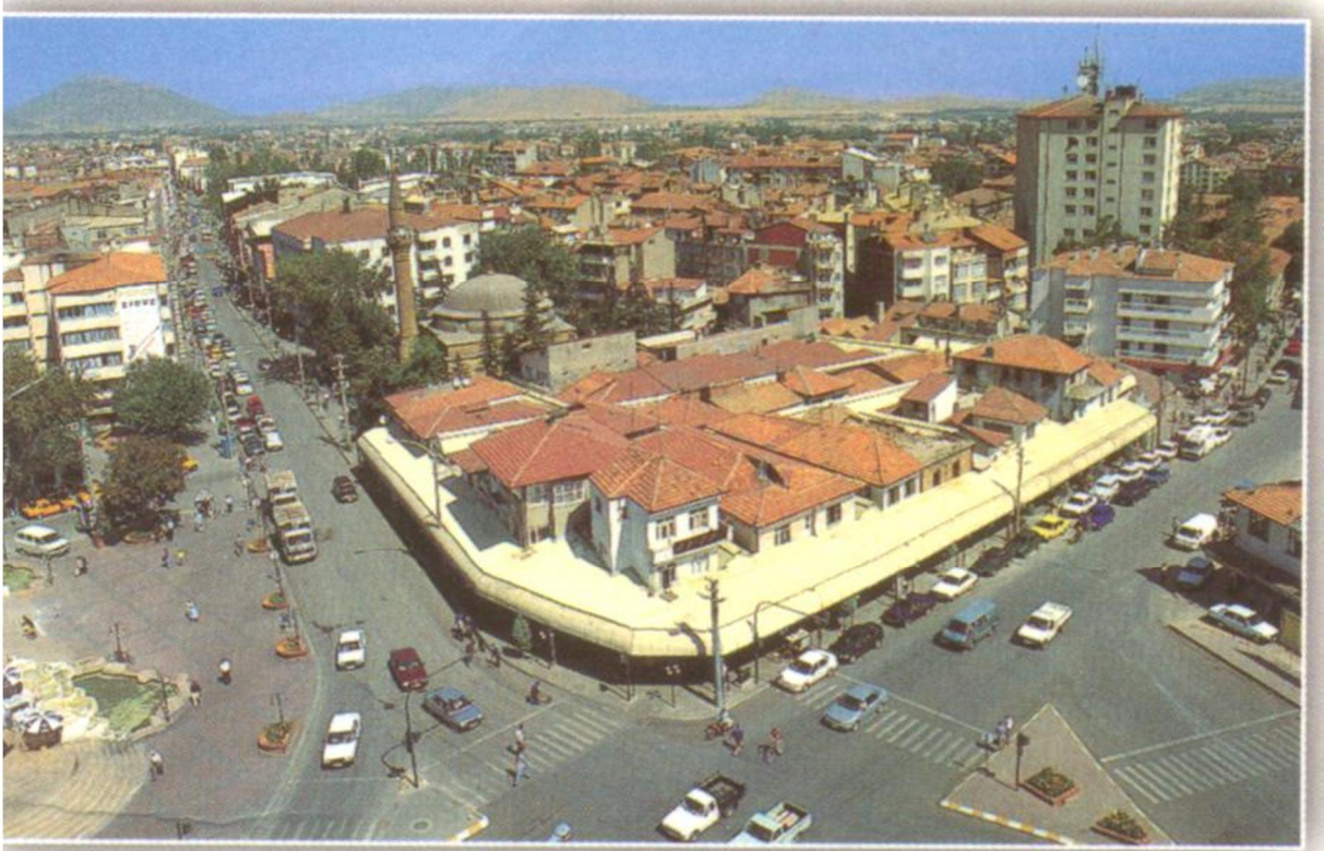
Şekil-12: Geniş saçak uygulamaları ve kat ilavesinden sonra Üzüüm Çarşısının Durumu (Kartpostal)