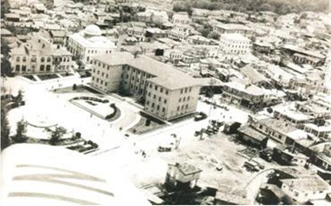
Şekil-8: Tarihi Kent Merkezinin yeni Hükümet Konağı ile ilişkisi (Kaynak: Isparta 1880-1980, 2001)

bağlandığı noktada konumlanan bu çok önemli kamu yapısı, yeni gelişme aksına doğru yönlendirilmiştir (Şekil-8). Kentin sürekliliği bağlamında önemli bir kırılmaya neden olacak bu düzenlemenin ardından, tarihi kent merkezinin geçmişten beri süregelen mekansal niteliğinde ciddi bir değişim yaşanmıştır. Bu süreçle birlikte Kaymak Kapı Meydanı da eski önemini büyük ölçüde kaybetmiştir. Ancak yaşanan değişimlere rağmen tarihi ticari kent merkezi, 1950'li yıllara kadar var olan mekansal yapısını büyük ölçüde korumuştur. O yıllarda çekilen bazı resimlerde (Şekil-9), 19. yüzyıldaki şehirsal dokunun varlığını hala koruduğu açıkça görülmektedir.