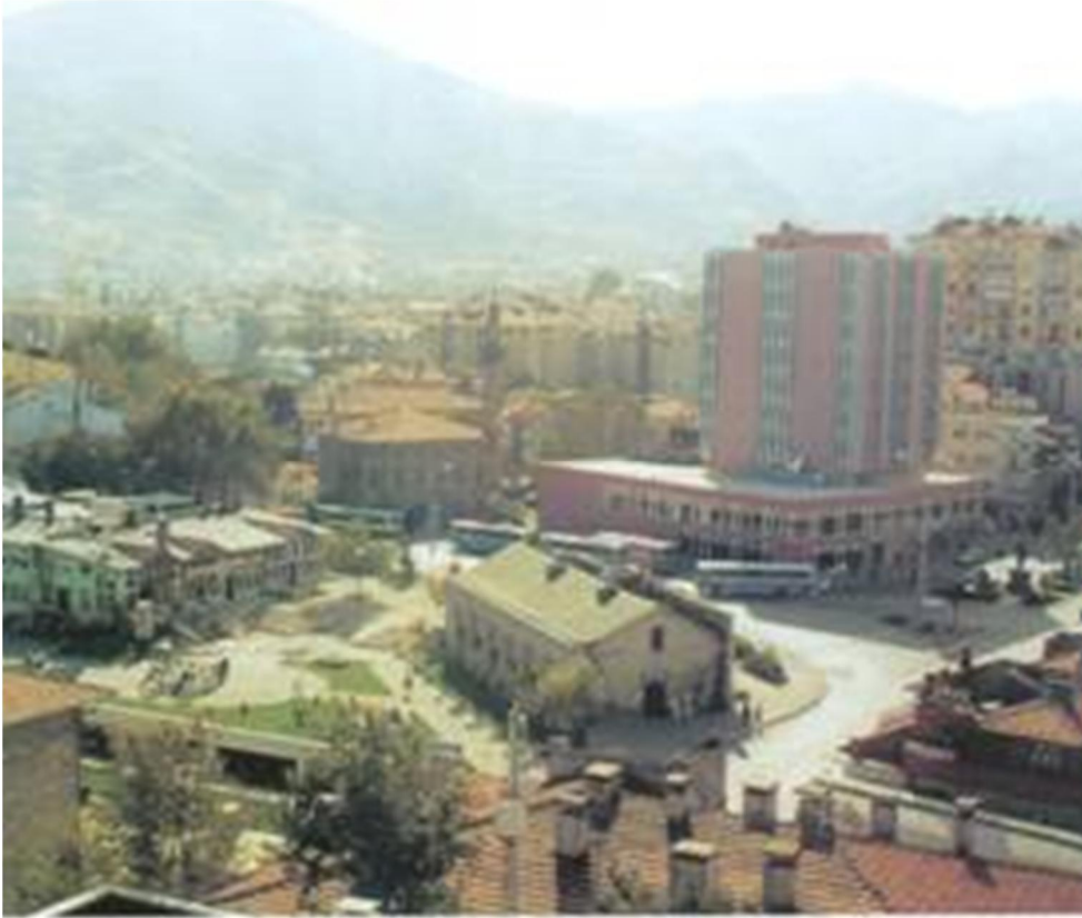
Şekil-10: Geleneksel Doku İçinde Isparta Otel ve Manifaturacılar Çarşısı