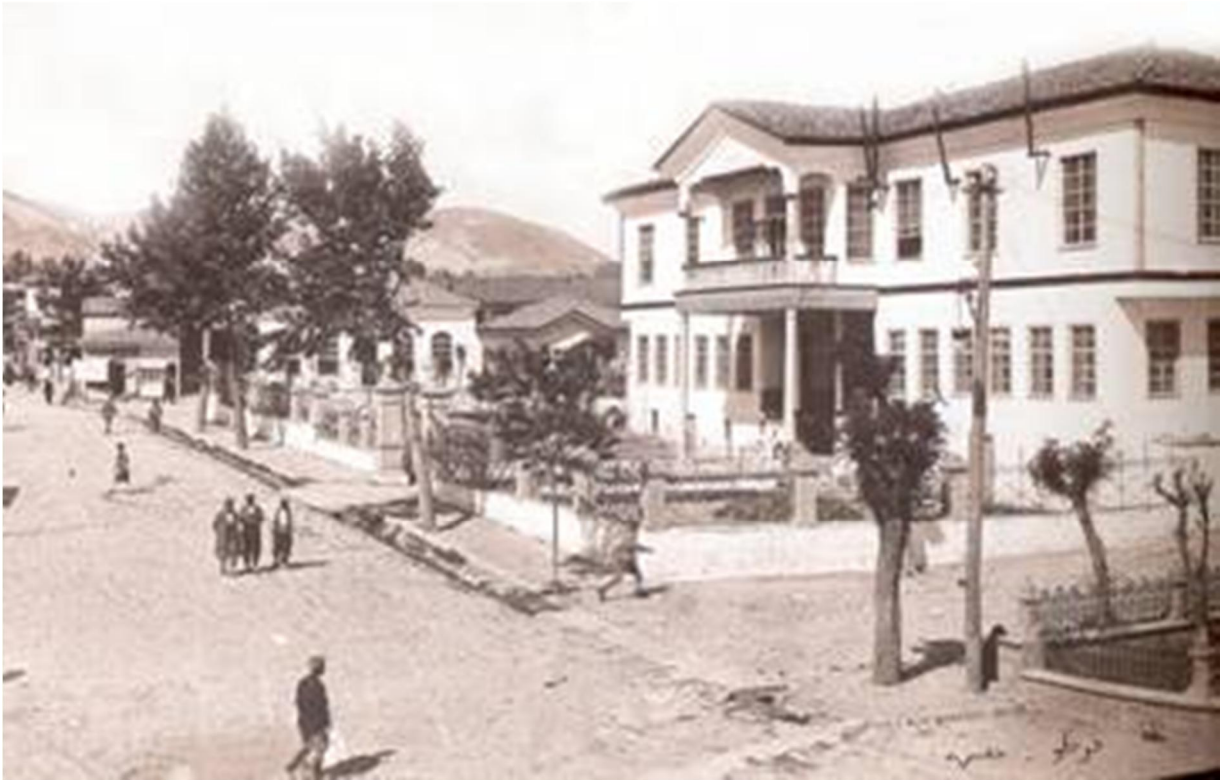
Şekil-3: Tören Caddesine yönelen eski Hükümet Konağı (Kaynak: Isparta 1880-1980, 2001)