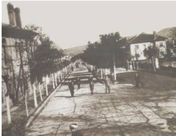
Şekil-7: Cumhuriyet Döneminin en prestijli caddesi: İstasyon Caddesi

merkezine bağlayacak olan caddenin açılışı yapılmıştır. İstasyon Caddesi olarak adlandırılan bu cadde, Erken Cumhuriyet Dönemi boyunca ulus-devletin örgütlendiği ve kendi mekansal üretimlerini gerçekleştirdiği bir faaliyet alanı olarak gelişmiştir (Şekil-7).