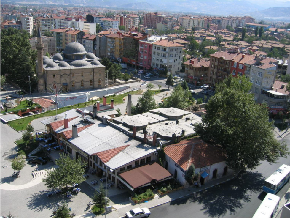
Şekil-11: Tarihi kent merkezi ile geleneksel konut alanlarını ayıran çok katlı yapılar