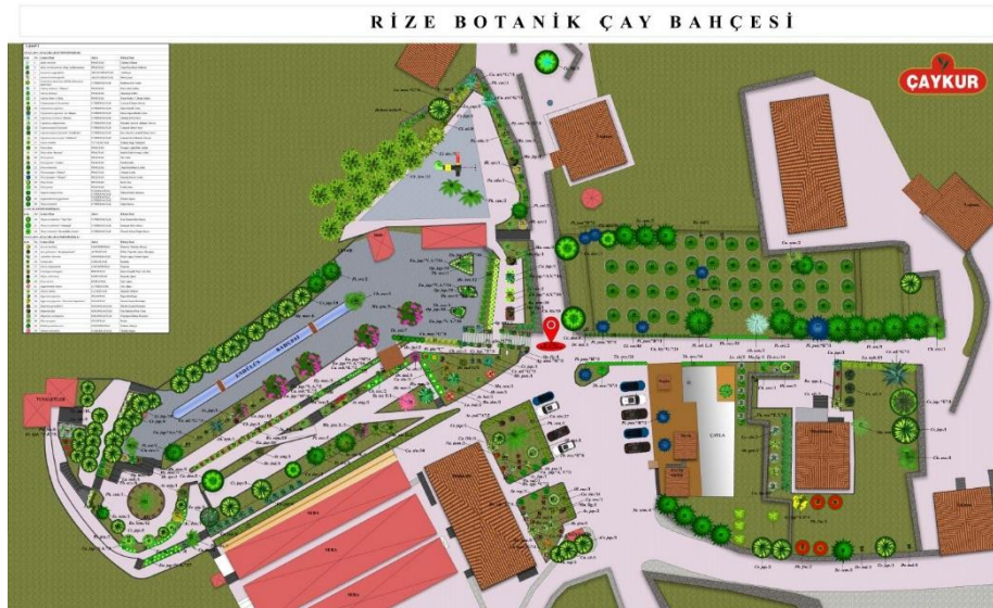
Şekil 1. Çalışma Alanı

Çalışma alanı olarak Rize merkez ilçesi sınırlarında yer alan, kıyıya yaklaşık 1,2 km mesafede, 110 m rakıma ve 51,500 m 2 alana sahip Rize Atatürk Ziraat Botanik Çay Bahçesi seçilmiştir (Şekil 1). Türkiye'nin en fazla yağış alan ili olan Rize, kültürel değerleri, topoğrafyası, yeşil dokusu, teraslanmış çay bahçeleri, yaylaları ve bu alanlardaki biyolojik çeşitliliği ile ön plana çıkan bir kıyı kentidir. Rize ilinde kentsel ve kırsal alanlarda yer alan birçok destinasyon noktası turizm olanakları açısından çeşitlilik gösterebilir kentsel alanda yer alan turizm noktaları kırsal alanlara göre sınırlı kalmaktadır. Bu kapsamda değerlendirildiğinde Rize Ziraat Botanik Çay Bahçesi kentsel turizm alanı içerisinde yoğun olarak kullanılan bir destinasyon noktasıdır. Çalışma alanı kuzeyde deniz ve Rize Kalesi manzarası, güneyde çaylık alanlar ile kaplı dağ manzarası ile tepeden panoramik bir görüntü sunmaktadır. Çalışma alanı içerisinde çay bahçesi, kafeterya, serender (nayla), oturma alanları, satış birimleri, çocuk oyun alanı, ÇAYKUR Genel Müdürlük Konutları, misafirhane, turuncgil bahçesi, meyve bahçesi, yemekhane, çay üretim tesisi (mini), ve seyir terasları yer almaktadır.