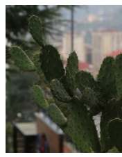
Opuntia ficus indica