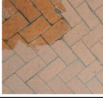
Sert Zemin Döşemeleri