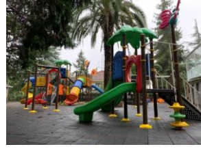
Çocuk Oyun Alanı