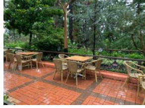
Yeme İçme Alanları