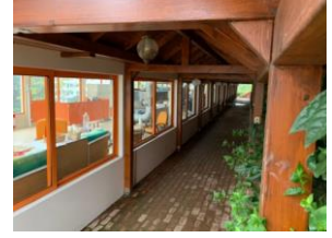
Çay Üretim Tesisi