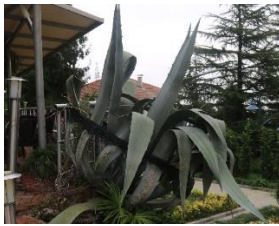
Agave americana L.