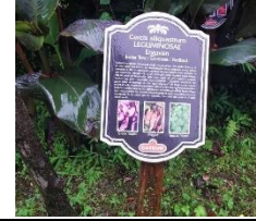
Bitki Tanıtım Etiketleri