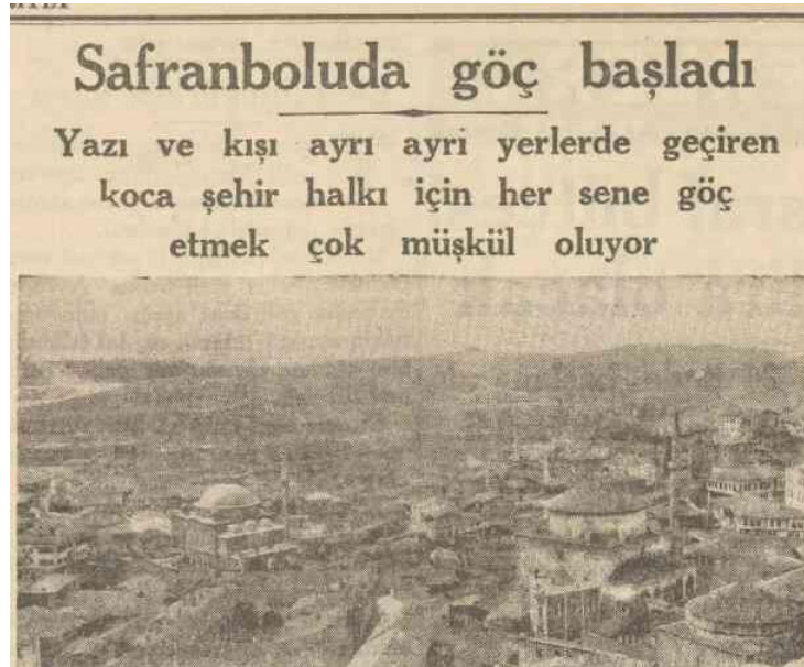
Şekil 10. Safranbolu'da göç haberi (Safranboluda Göç Başladı, 1937, 17 Mayıs)