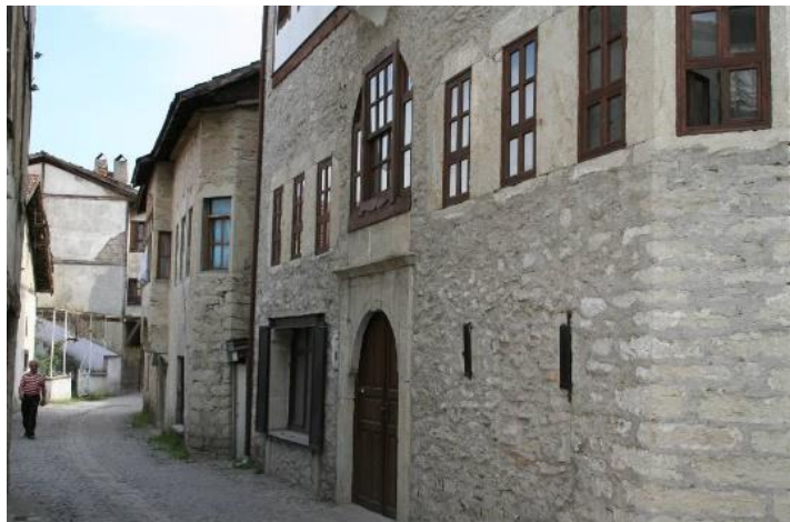
Şekil 5. Kıranköy bölgesi yerleşimi

Yukarıda bahsedilen gelişmelere ek olarak, 20.yüzyılın siyasi gündemi, 1923 yılında yaşanacak olan tehcirin kapılarını aralar. Hristiyan Rumların tehciri ile 7500-8000 civarında olan Safranbolu kent nüfusu, 5000'li rakamlara kadar geriler (Doğanalp Vötzi, 2005, s.309) Safranbolu kentinin orta noktasında kalan Kıranköy ise, iş merkezi olarak dönemin Şehir-Bağlar çatışmasının sonucu, şehri çukurdan çıkartmak için belediyeçilik uygulamalarının etkisiyle bu dönemde önem kazanır (Şekil 5). Tehcir politikasıyla boşalan Kıranköy, şehre yeni bir yerleşim yeri alternatifi oluşturur. Bu durum yine Safranbolu geleneksel evlerinin doğal olarak korunmasına doğrudan hizmet eder.