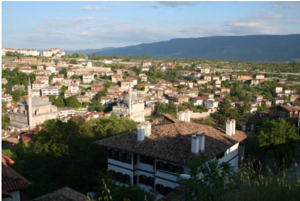
Şekil 2. Safranbolu, kanyon içi yerleşmesi/Eski Çarşı