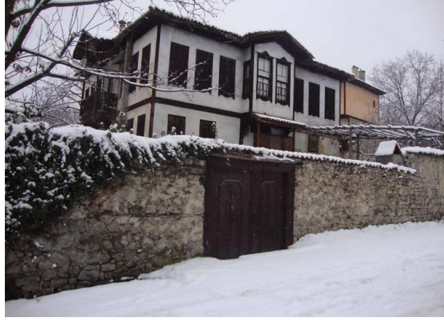
Şekil 4. Bağlar Bölgesi geniş bahçeli konut detayı

Varlıklı ailelerin bir bölümü, sahip oldukları çeltik tarlalarını ve diğer mal varlıklarını satarak Safranbolu'yu terk ederler. Kimi aileler ise oğullarını dönemin gelecek vaat eden uğraşısı bürokrasiye, devlet kurumlarına yönlendirirler. Bazı Safranbolulu ailelerin Şehir-Bağlar çatışması neticesinde evlerini Safranbolu'nun köyünden gelen Safranbolu köylülerine satmaları buradaki maddi varlıkların kaybedilmesine yol açar. Varlıklı ailelerin bir kısmı merkezden Bağlar'a doğru tamamen göçtükleri için Safranbolu tarihi çarşısı ana merkez özelliğini kaybetmeye başlar (Kiray, 1988, s.43, 54). Kentli olarak tanımlanan Safranboluluların bu bölgeyi değişik gerekçelerle terk etmesi buradaki evlerin yok pahasına satılmasına yol açar. Bu evlerin yeni sahipleri Safranbolu'nun köylerinden gelen köy kökenli hemşerileridir. Eğitim, tarım, sağlık işleri başta olmak üzere köylerden kente göçü teşvik eden birtakım nedenler vardır. Ayrıca fabrikada işçi olarak çalışmaya başlayanlar azımsanmayacak sayıdadır. Bu evlerin yeni sahipleri maddi durumları iyi olmadığı için evlerde önemli tadilat işleri gerçekleştiremezler, doğal olarak konutların korunması süreci bu aşamada devam eder.