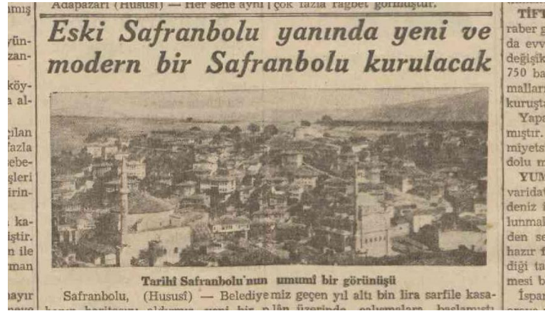
Şekil 8. Safranbolu'nun taşınma süreci (Eski Safranbolu Yanında Yeni ve Modern Bir Safranbolu Kurulacak, 1936, 28 Eylül)