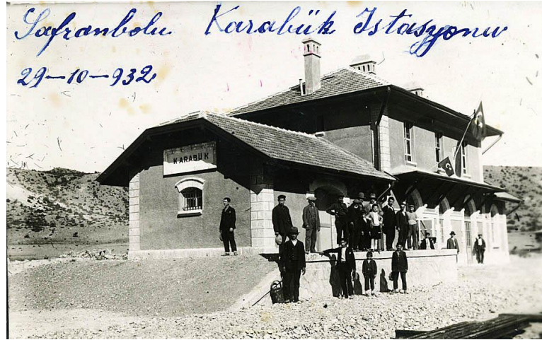
Şekil 6. Karabük tren istasyonu

taşra psikolojisini yaşamaya başlar. Demir yollarının Safranbolu'ya yakın bir noktada inşa edilmesinin Safranbolu'nun yakınına demir fabrikalarının getirilmesine yol açtığı baskın bir görüştür (Yeni Safranbolu, 1936, 6 Haziran). Ticaret, saray bağlantılarıyla ekonomik açıdan parlak günler yaşamış, geleneksel konut dokusu zengin Safranbolu ve 1930'lu yılların endüstri projesi olan modern Karabük kenti coğrafi yakınlıkları neticesinde zorunlu bir etkileşim sahası içine taşınır. Safranbolu cephesinde Karabük endüstri yerleşmesinin kurulmasıyla ilgili ilk değerlendirmelerin genellikle olumlu olduğu söylenebilir; çünkü Karabük'ün bölgeye ekonomik bir hareketlilik sağlayacağı, Safranbolu'nun mevcut dar kabından çıkmasına yardımcı olacağı düşünülür ancak bölgede yaşanan gelişmeler beklenenin aksi bir tabloyu ortaya koyar. Karabük'ün ekonomik ve sosyal bağlamdaki ani parlamışı ve kendi kendine yeten kompakt biçimlenişi, sanılanların aksine ilk yıllarda Safranbolu'yu ekonomik anlamda ciddi bir biçimde etkilemeyecektir (Özkan Altınöz, 2022). Sanayileşmeyle bölgede başlayan konut sorunları hâlihazırda terk edilmiş bir kasaba bekleyişinde olan Safranbolu'yu etkiler. Çarşıda boşalan kimi evler fabrikalarda alt pozisyonlarda çalışanlara kiraya verir.