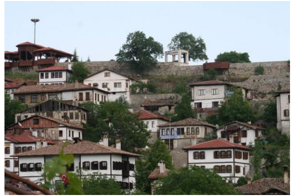
Şekil 3. Safranbolu geleneksel konutları/Eski Çarşı