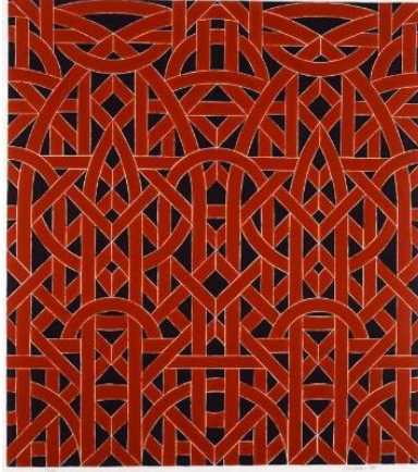
Görsel 3. Valerie Jaudon, Aaron, 1980, Kağıt üzerine pastel boya, 83x 76 cm.

bağlanan bu motifler, belli bir merkezden başlayıp tuvalin tüm alanlarına doğru ölçülü biçimde yayılır. Tek renk içeren çalışmalarının yanı sıra Doğuya özgü halılarda kullanılan renkleri de ön plana çıkaran sanatçı, süslemeyi geleneksel bağlamlarından ayırarak Batılı bir bakış açısıyla yalıtılarak, dekorasyonun kalıcı önemini vurgular. Geometrik simetriye ve birbirini takip eden dekoratif motiflere derinden bağlı bu çalışmalar, Doğu'ya özgü soyut ve figüratif dekorasyon geleneğine sıkı sıkıya bağlıdır.