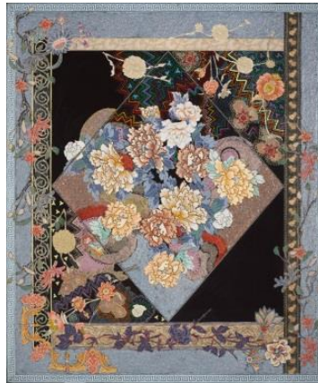
Görsel 2. Miriam Schapiro, Cennet Halısı, 1980, Tuval üzerine kolaj ve akrilik boya, 152x127 cm.

Schapiro'nun uyguladığı famaj çalışmaları Doğu'ya özgü süsleme geleneğinden ödünç aldığı motiflerle özgün bir bütünlük oluşturur. Bu yöndeki eserleri arasında ön plana çıkan “Cennet Halısı” adlı famaj çalışması (Görsel 2) geometrik formlarla kompoze edilmiş ve doğuya özgü bir halı biçiminde tasarlanmıştır. Çiçek desenli kumaş paçaları ve renkli ipleri geometrik biçimlere uygun olarak kolajlayan sanatçı, resme akrilik boya müdahaleleriyle çarpıcı bir derinlik kazandırmıştır. Çalışmayı çepeçevre saran arabesk motifler ise coğrafi sınırlar boyunca uzanan soyut-figüratif dekorasyon geleneğine güçlü atıflarda bulunur.