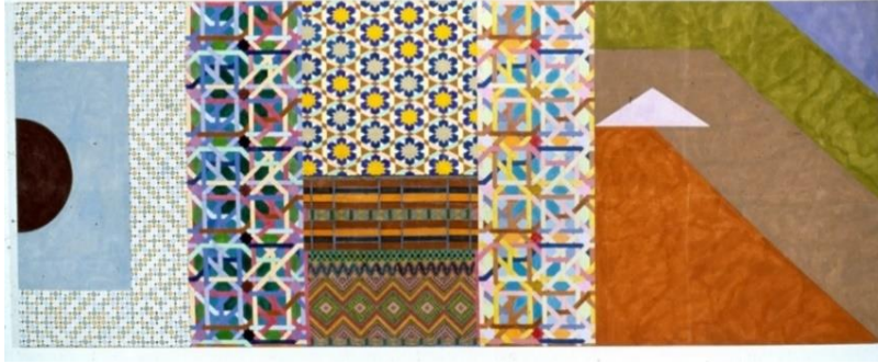
Görsel 1. Joyce Kozloff, Üç Portal, 1977, Tuval üzerine akrilik boya, 457.2x182.88 cm.

Grubun diğer bir sanatçısı olan Miriam Schapiro, tıpkı Kozloff gibi Batılı sanatın baskın tanımlama modellerini terk ederek dekoratif sanatların zengin olanaklarına yönelmiştir. Dekorasyonu bir sanat dili olarak kullanmanın çeşitli biçimlerini araştıran sanatçı “yüksek” ve “düşük” sanat ayırımına dayalı olarak hiyerarşik bir ayırma tabi tutulmuş ürünleri sanatının en önemli bileşeni yapmıştır. Bu amaçla çeşitli renk ve motiflere sahip buluntu kumaş parçalarını çalışmalarının ana unsuru yapan sanatçı, tüm bu parçaları Batılı resim tarzına uygun olarak geometrik ve soyut biçimlerle harmanlamıştır. Özel bir dikiş tekniği kullanarak bir araya getirdiği kumaş parçalarını yer yer akrilik boya müdahaleleriyle zenginleştiren Schapiro, bu uygulama çalışmalarını “famaj” olarak tanımlamıştır. “Famaj, kadınların, kendileriyle özdeşleştirilen malzeme ve teknikleri de kullanarak gerçekleştirdikleri, 'kadın kolajları'dır” (Gouma ve Mathew, 2008, s. 30).