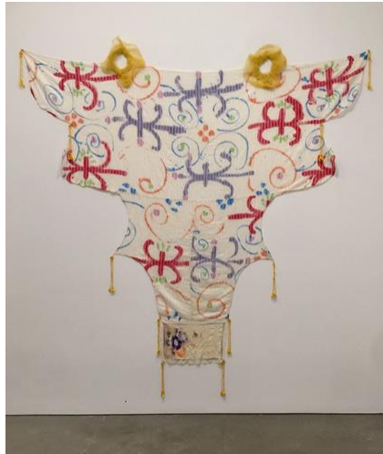
Görsel 4. Robert Kushner, Robert Kushner, Gelinlik, 1978

Grubun en önemli teorisyenlerinden Robert Kushner 1974'te İpek Yolu boyunca Türkiye, İran ve Afganistan üzerinden kararlı bir yolculuğa çıkarak burada incelemeler yapmıştır. İstanbul'da Bizans kiliseleri, dokumacılar, halıcılar, İslam mimarisi ve sanatı ile tanışması, süslemenin hem ilkesel hem de kültürel açıdan tarihini ve estetik boyutlarını keşfetmesini sağlamıştır. New York'a döndükten sonra güzel sanatlar ile dekoratif sanatları eşit bir zemine oturtacak çalışmalar yapan sanatçı daha çok Doğuya özgü geleneksel iğne işi çalışmalar (Görsel 4) yapmış, bu kültürlerin zengin dekoratif geleneklerini Batılı bir sanatçı gözüyle yorumlamıştır.