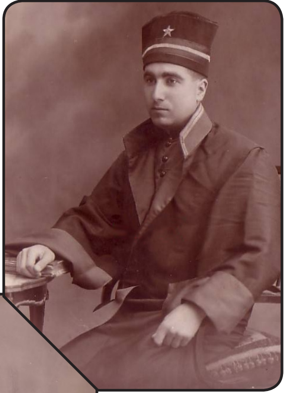
1927 ve 1936 yıllarında Bir Avukat...