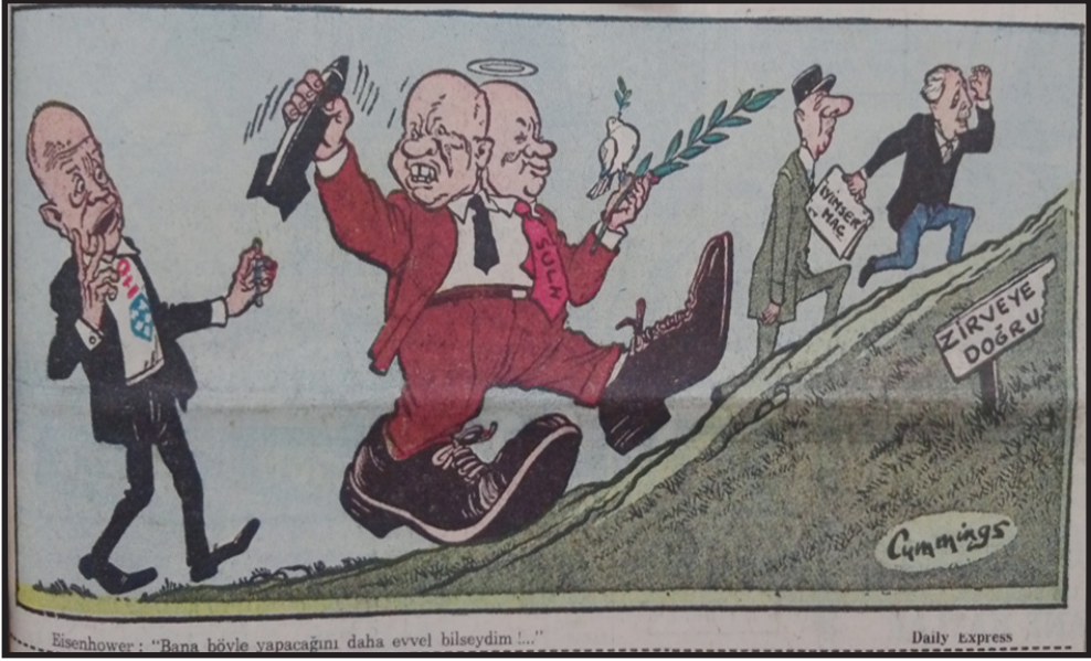
Resim 8: Cumhuriyet, 16.5.1960, s.1.

Eisenhower: "Bana böyle yapacağını daha evvel bilseydim!.."