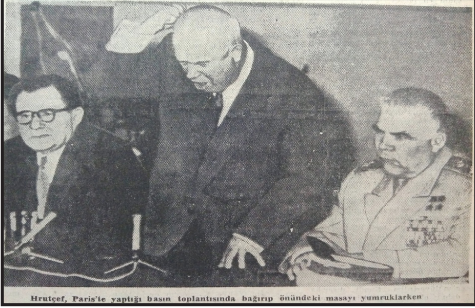
Resim 6: Hürriyet, 18.5.1960, s.1.

Kruşçev, Paris'te yaptığı basın toplantısında bağırip önündeki masayı yumruklarken.