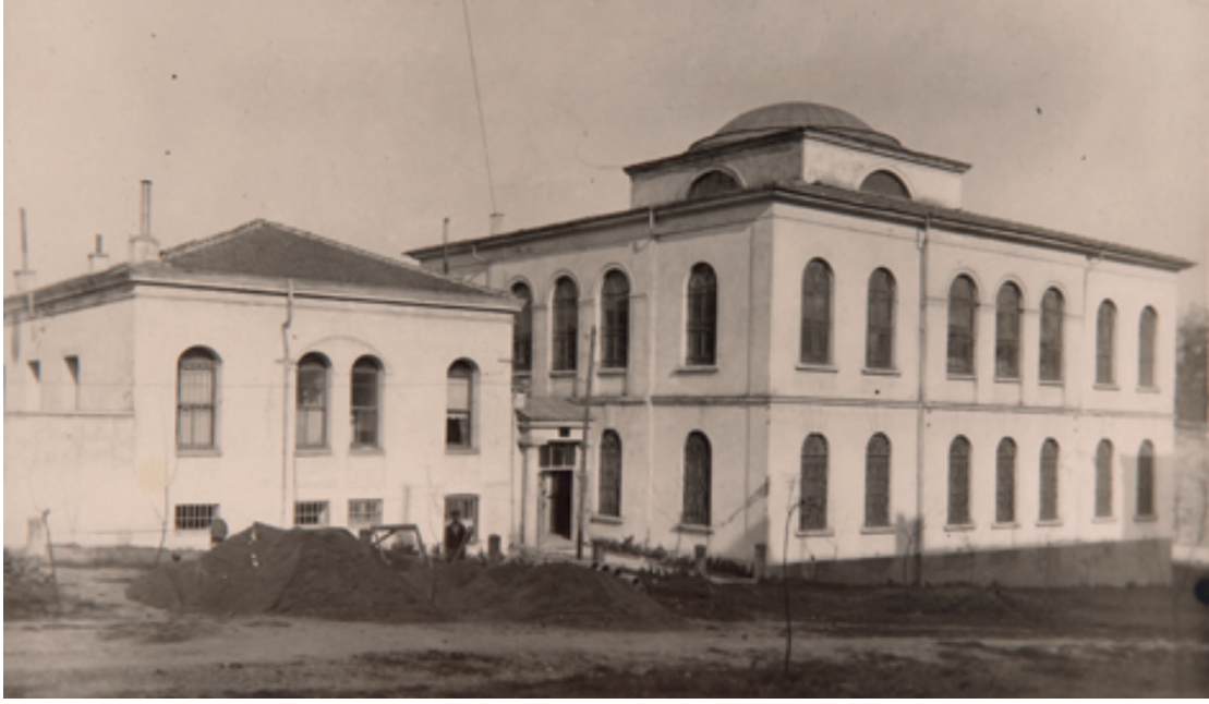
Şekil 1. Hazine-i Evrak Binası (1940'lı yıllar) 46