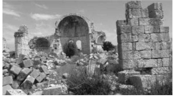
Resim 5a: Corycus Mezar Kilisesi.

Mimari yapı ve elemanlar bakımından Zeno dönemi yapıları ile benzerlik gösteren bölgedeki diğer yapı, Silifke'nin 33 km kuzaybatısında yer alan üç nefli bazilikal planlı Alakilise'dir (Hild-Hellenkemper, 1990, s. 170). Anemurium'daki A-II, I no'lu kilisenin de Zeno dönemi ile ilişkilendirildiği bilinmektedir. Üç nefli bazilikal plana sahip kilise yapısı, zengin mozaik bezemeleri bakımından Zeno dönemi yapıları içinde sayılmaktadır. Mozaikte yer alan "Barış