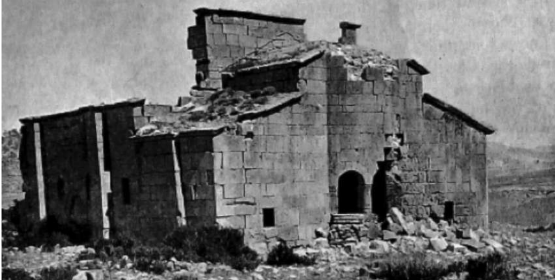
Resim 4: Dağ Pazarı Kubbeli Bazilika (Headlam, 1892).

Dağ Pazarı'daki (Dalisandus/Coropissus) üç nefli bazilikanın tarihi III. - IV. yüzyıldaki pagan tapınağına kadar uzanmaktadır. Yapının, V. yüzyılda bir Hıristiyan kilisesine dönüştürüldüğü araştırmacılar tarafından belirtilmektedir (Hill, 1996, ss. 151-155). Kilisede en dikkat çekici bölümlerden biri çeşitli kuşlardan oluşan narteksin zeminini kaplayan mozaiktir. Mozaik taban, Azize Thecla Kutsal Alanı ile ilişkilendirildiğinde, taban ve yapının restorasyonunun Zeno'nun hükümdarlık döneminde yaptırılmış olabileceği araştırmacılar tarafından önerilmektedir. Dağ Pazarı'ndaki Kubbeli Bazilika da (Resim 4) gerek mimari elemanlar gerekse apsis penceresindeki sütun başlıkları yönünden Alahan Doğu Kilisesi ve Corycus Mezar Kilisesi ile benzerlik taşımakta ve bunlar, "Kubbeli Bazilikalar" olarak sınıflandırılmaktadır. Dağ Pazarı'ndaki Kemerli Kubbeli Bazilika da bu mimari özellikleri nedeniyle Zeno dönemi yapısı olarak kabul edilmektedir (Hill, 1996, ss. 155-160).