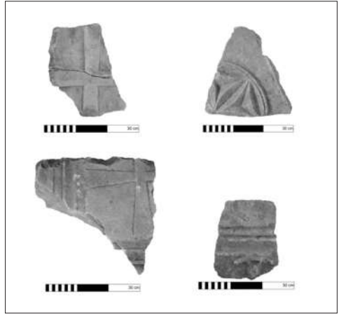
Resim 7: Olba Manastırı'ndan Levha Örnekleri.