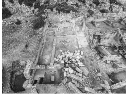
Resim 6a: Manastır Kuzey Kilisesi.