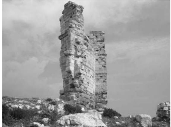
Resim 2: Azize Thecla Bazilikası.