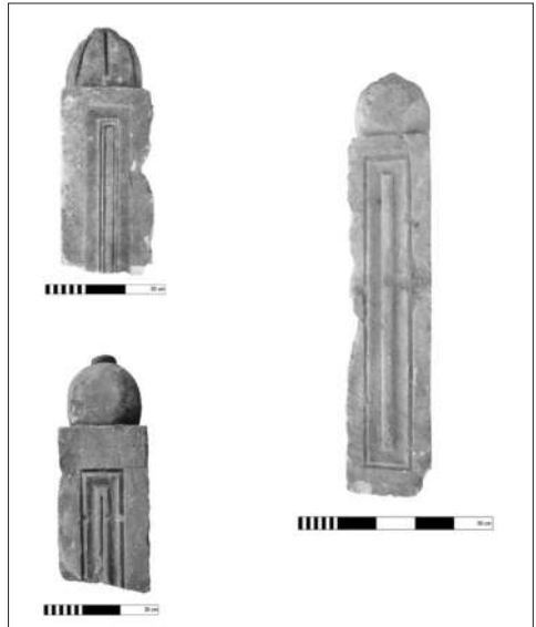
Resim 7b: Olba Manastırı'nda Bulunan Templon Payeleri.