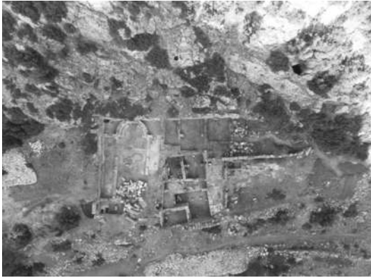
Resim 6: Olba Manastırı.

Olba kentinde başlanan arkeolojik kazılar, kentin Eskiçağ’dan bu yana sürekli yerleşim bulunan bir merkez olduğunu kanıtlamaktadır. Kentte Roma mimarisinin tanıklığını en iyi yapan birçok Eskiçağ yapısında kazı çalışmaları yapılmaktadır. Bu kazı çalışmalarının gerçekleştirildiği alanlardan biri, kentin ve hatta bölgenin Erken Hıristiyanlık Dönemi’ne ışık tutan Olba Manastırı’dır 15 (Resim 6-6a).