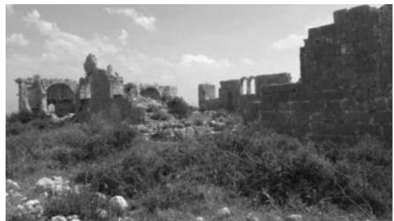
Resim 5c: Corycus A Kilisesi.