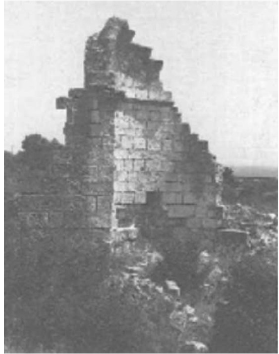
Resim 5b: Corycus Transeptli Kilisesi.