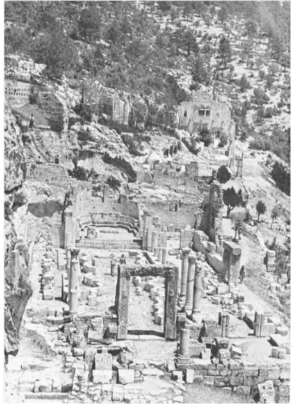
Resim 3: Alahan Manastırını (Gough).

Bölgede Zeno tarafından yaptırılan diğer bir yapı Alahan yapı kompleksidir (Resim 3). Mimari, arkeolojik ve epigrafik veriler, bu yapının Zeno tarafından kurulduğunu göstermektedir. 12 Öte yandan yapının Zeno döneminde yaptırıldığına karşı çıkanlar da bulunmaktadır. Bu konuda Elton, yapıların küçük boyutlu olmalarını göz önüne almakta ve böylesi yapılar için imparatorluk desteğine ihtiyaç duyulmayacağını savunmaktadır. Dolayısıyla yapının finansörünün Zeno olamayacağı görüşündedir. Elton, tarihsel olarak da yapının onun dönemine verilemeyeceğini düşünmektedir. Ayrıca yapıdaki kazılarda ele geçen sikkelerin hemen hiçbirinin Zeno dönemine ait olmaması da Alahan manastırının Zeno dönemine ait bir yapı olarak değerlendirilemeyeceğini göstermektedir (Elton, 2002, ss. 153-157). Ancak Alahan yapı topluluğu, Zeno'nun finanse ettiği başka yapı toplulukları ile karşılaştırıldığında bu yapının da imparatorun döneminin bir eseri olduğu söylenebilir. Zeno'nun ölümü sonrasında yapının tamamlanamamış olması ayrı bir yorumdur. Bu durum, Zeno'dan sonra tahta geçen Anastasius döneminde (492-518) Isauria'ya gelen imparatorluk desteklerinin kesilmesi ile açıklanabilir (Kosinski, 2010, s. 206). Ayrıca Anastasius'un, Isaurialıların Constantinopolis'teki etkinliklerini bitirdiği ve onları Thracia bölgesine sürdüğü bilinmektedir.