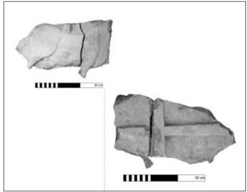
Resim 7a: Olba Manastırı'ndan Levha Örnekleri.