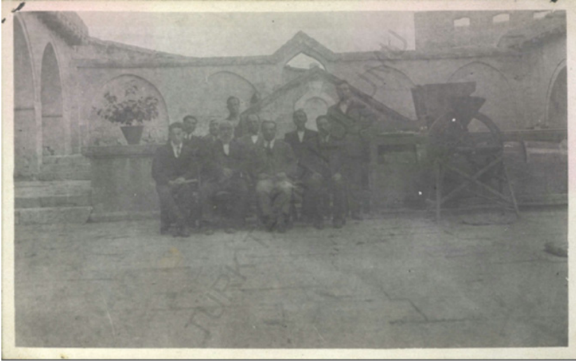
Şekil 1: Kırşehir Valisi İbrahim Hazım Mat, Veliyyittin Hürrem Ulusoy ile Tasnif Heyeti Hacı Bektaş Dergâhının orta avlusunda, Hamit Zübeyir Koşay'da ön sırada oturanlar arasında vardır.