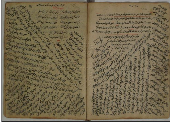
EK 2: İkinci nüshanın ilk ve son sayfaları: