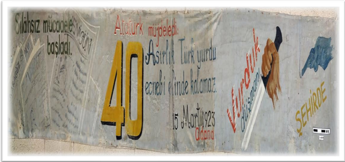
Belge 1: Hatay Kuvayi Milliye Cemiyeti’den hibe bir pankart.

Çalışmanın ana referansı olan Etnografik belgelerin içerik ve tema açısından özellikleri Antakya, İskenderun ve çevresinin bağımsızlık ve Türkiye’ye katılım sürecine tanıklık etmiş olmalarıyla genel bir çerçevede sınırlandırılabilir. Söz konusu belgeler münferit olarak ele alındığında hemen hemen aynı tarihsel süreçte birbirinden farklılık gösteren yönleriyle döneme dair önemli bilgiler ortaya koymaktadır. Bu belgeler özellikle 30 Ekim 1918 ile başlayan Fransız işgal yıllarında kentte gelişen işgal karşıtı mücadelenin tanıklığını yapmış pankartlar, bayrak ve flamalar, üniformalar oluşmaktadır. Bunlar arasında yer alan örneğin pankartlar genel bir projeksiyonla bakıldığında dönemin siyasal ve sosyal yapısını gözler önüne sermenin yanı sıra üzerinde taşıdığı kimi ayrıntıları ile de kültürel yaşama dair dikkat çekici bilgiler sunmaktadır. Çalışmada analitik yaklaşımlarla incelenecek envanterler ayrı ayrı ele alınacağından değerlendirme bölümü sona bırakılmıştır.