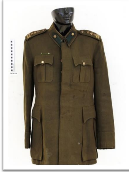
Belge 5: Albay Şükrü Kanatlı'ya ait Albay Ceketini Hatay Arkeoloji Müze Arşivi.