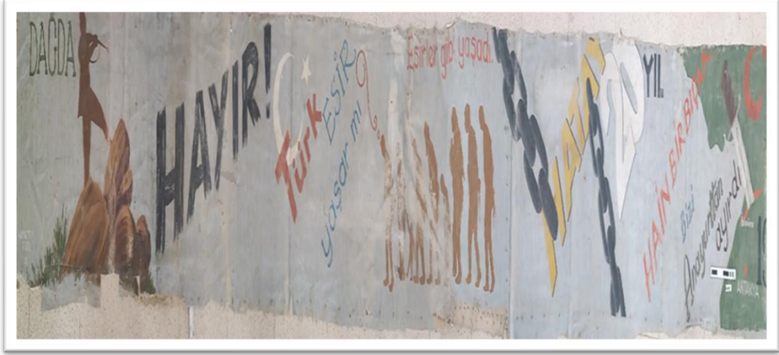
Belge 2: Hatay Kuvayi Milliye Cemiyeti’den hibe bir pankart. Hatay Arkeoloji Müze Arşivi.

Etnografik belgelerden Belge no 2 ‘nin envanter numarası 517’dir. Envanter adı pankarttır. Eserin cinsi bez ve dönemi 19 ve 20.yüzyıl olarak belirtilmiştir. Ölçüleri uzunluğu 660cm eni ise 60cm’dir. Müzeye geliş tarihi 14.07.1975 tarihi olarak kayda geçmiştir. Eser müzeye Hatay Kuvayi Milliye Cemiyeti’den hibe olarak gelmiştir. Müzedeki yeri 2.depo 27 numaralı çekmecedir (Bkz.: Belge No.2).