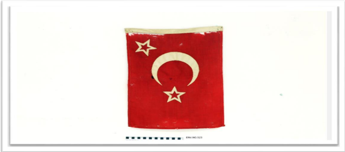
Belge 3: Hatay Devleti bayrağıdır. Hatay Cumhurbaşkanının araba forsu olarak kullanılmıştır.

Eserin tanıtımı için yukarıda bahsi geçen belge gibi bir pankart olduğu görülmektedir. Künyesinde pankartın yağlı boya ile boyanmış olduğu belirtilmiştir. Üzerinde soldan sağa “Dağda” yazısı önünde kayalıklar üzerinde kahverengi giysili elindeki tüfeği ileri doğru uzatan bir insan resmi resmedilmiştir. Önünde “Hayır!” yazısı ile birlikte hilal ve yıldız resmi , “Türk Esir yaşar mı?” yazısı, elleri arkadan bağlı şekilde ilerleyen insanların resmi belirgindir. Ayrıca iki zincir arasında “Hatay 20 Yıl” yazısı “Hain Bir Bıçak Bizi Anayurttan Ayırdı “ yazısı saplanmış bir bıçak resmi yeşil zeminli harita üzerinde Antakya ve İskenderun yazısı yer almıştır. Müze arşivinde Pankartın lekeli olduğu belirtilmiştir.