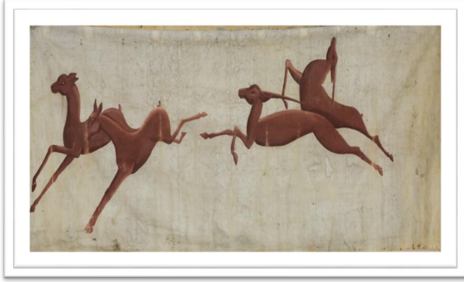
Belge 11: Hatay Kuvayi Milliye Cemiyeti'den hibe bir pankart. Hatay Arkeoloji Müze Arşivi.

Bir diğer resim ve çizim ağırlıklı pankart belge no 11 olup müze arşivinde 515 envanter numarası ile kayda geçmiştir. Belgenin kazı envanter numarası bulunmamaktadır. Müze arşivinde eser adı Pankart olarak belirlenmiştir. Pankartın cinsi bez olup tarihsel 20.yy'a dayanmaktadır. Ölçüleri ise uzunluk 230cm eni 90cm'dir. Pankart müzeye 14.07.1975 tarihinde getirilmiştir. Eser Hatay Kuvayi Milliye Cemiyeti'den hibe olarak müzeye getirilmiştir. Müzedeki yeri 2.Depo çekmece 25'tir. Tanımı ise bir pankart parçası olarak kaydedilmiştir. Pankart yağlı boya ile boyanmış ve üzerinde dört adet koşan ceylan bulunmaktadır. Kayıtlarda pankartın lekeli olduğu notu düşülmüştür (Bkz.: Belge No.11).