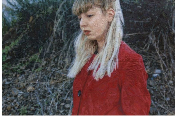
Şekil 8. Elfin , KK8, 2015.

KK8; applike tekniğinin özel bir teknik olmadığını, dikiş yöntemlerinden biri olduğunu ifade etmiştir. Ona göre kumaş resimler, yeni ve farklı olduğundan sanatta ilgi görmüştür. Kumaşlarla resim yapmaya bir sergide bir sorunu çözerken başladığını hatta dikiş makinasını ilk defa bu çalışmada kullandığını, böylece tekstil malzemeleri ile türüne ve tarihine bakmaksızın harika şeyler yapabileceğini fark etmiştir. Sanatçı, aplikelerini oluştururken farklı renkte kumaş ve ipliklere ihtiyaç duyduğunu, bu nedenle kumaşlarını kendi boyadığını ve uygun kumaşı bulmak için kendi ipliklerini boyatan tekstil firmalarından artan bobinleri toplayıp biriktirdiğini dile getirmiştir. Çalışmalarında farklı bir teknik olarak foto grafik bir gerçekliği yakalamak için pleksiglas üzerine endüstriyel akrilik boyayı da kullanmaktadır. Çağdaş sanatı önemseyene değinen sanatçı, çağdaş tekstil sanatının olduğunu düşünmemektedir. Ona göre sanat, düşüncenin forma dönüşmesidir. Sanatçı, resimlerinin içerik olarak değil belki ama biçimsel olarak realisttik olduğunu düşünmektedir (KK8, kişisel görüşme, 4 Mart 2021). Sanatçının kanvas üzerine kumaşlarla yaptığı Elfin adlı çalışmasına ait görsel aşağıda yer almaktadır (Bkz. Şekil 8).