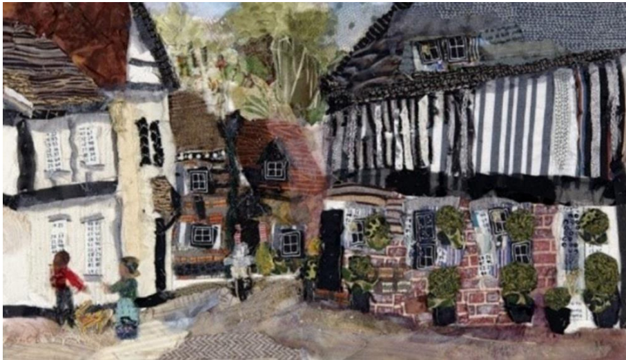
Şekil 2. Princes Risborough Church Street 2 , KK2, 2018.

KK2; applike tekniğinin insanın iğne ipliği keşfettiğinden beri giysilerin onarılması, geliştirilmesi ve süslenmesi için kullanıldığını ancak, kendi ülkesinde (İngiltere) güçlü bir applike geleneğinin farkında olmadığını dile getirmiştir. Bu bağlamda; aileden gelen bilgi ve becerisinin olmadığını, çalışmalarında geleneksel applikeyi kullanmayıp kendi applike tarzını geliştirdiğini ifade etmiştir. Sanatçının belirttiğine göre, çalışmasına başlarken kumaş kolajı için birçok kumaş parçasını katmanlayıp el dikişi ile bir araya getirmektedir. Geri dönüşüm amaçlı kullandığı kumaşlar; ipek, baskılı pamuk, dantel, şifon, organze, boncuklu ve ışıltılı parçalardır. Malzemeleri; iğneler, makas ve pamuk ipliğidir. Çalışmalarında özellikle kumaşlarla resim yaptığını aktarmıştır. Kumaşı araç olarak görmekten ziyade, kumaşı kullanan bir sanatçı olarak görmeyi tercih etmektedir. Ona göre çağdaş tekstil sanatı, gerçek bir sanat formu ve sosyal tarihin bir parçası olarak kabul görmeye başlamıştır. Sanatçı, cesur renk kombinasyonlarını kullanmayı sevdiğini, gördüklerini yorumlayarak tanıdık konulara yenilik katmaya çalıştığını belirtmiştir. Claude Monet ve Edgar Degas gibi Empresyonist ressamların yanı sıra Gustav Klimt'ın çalışmalarından çok etkilendiğini de eklemiştir (KK2, kişisel görüşme, 4 Mart 2021). Sanatçının applike çalışmalarından Princes Risborough Church Street 2 adlı eseri aşağıda yer almaktadır (Bkz. Şekil 2).