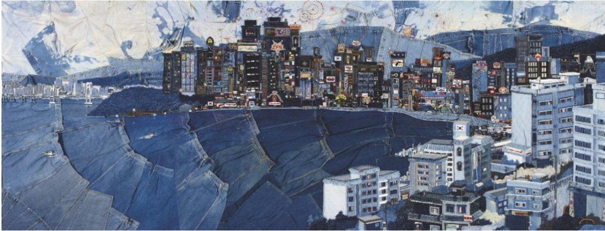
Şekil 11. A Sightseeing City, Choi So-Young, 2010.

İkinci el denim kumaşlarıyla şehir manzaraları yapan Koreli sanatçı Choi So-Young , çoğunlukla denim pantolonların cepleri, kemer halkaları, dikişleri ve düğmeleriyle şehirdeki sokakları, binaları yapmaktadır (Artnet, t. y.). Sanatçının, A Sightseeing City Houses adlı çalışması aşağıda yer almaktadır (Bkz. Şekil 11).