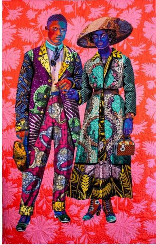
Şekil 3. Broom Jumpers , KK3, 2019.

KK3; öncelikle, annesi ve büyükannesinden herhangi bir dikiş eğitimi almadığına, çalışmalarında kumaş katmanlarını üst üste dikmek için kendi geliştirdiği basit bir applike tekniği kullandığına değinmiştir. Malzemelerinin ipek, pamuk, kadife, dantel, saten, denim, deri ve kendisini ilgilendiren her tür kumaş olduğunu, öncelikle applike ve kapitone tekniklerini kullandığını, ayrıca vintage fotoğraflara dayalı eskizler yaptığını ifade etmiştir. Çalışmaları için fotoğraf seçip eskiz oluşturduğunu, sonra küçük kumaş parçalarını kesip üst katman olarak applike ettiğini, üst katman bittiğinde ise arka plan kumaşı, yorgan dolgusu ve desteği seçerek üç katmanı birbirine sabitlediğini aktarmıştır. Sanatçıya göre çağdaş tekstil sanatında applike tekniği; çizim, boyama, yontma, kapitone veya dokuma gibi başka bir sanatsal tekniktir ve bunları oluşturmanın farklı bir yolu vardır. Kendisini kapitoneyi portre yapmak için kullanan bir sanatçı olarak gördüğünü ve çalışmalarını yaparken bu teknik ile resim yapabildiğini, şekillendirebildiğini ve çizbildiğini dile getirmiştir (KK3, kişisel görüşme, 4 Mart 2021). Sanatçının, kullandığı teknikleri yansıtan Broom Jumpers adlı çalışması aşağıdaki görselde yer almaktadır (Bkz. Şekil 3).