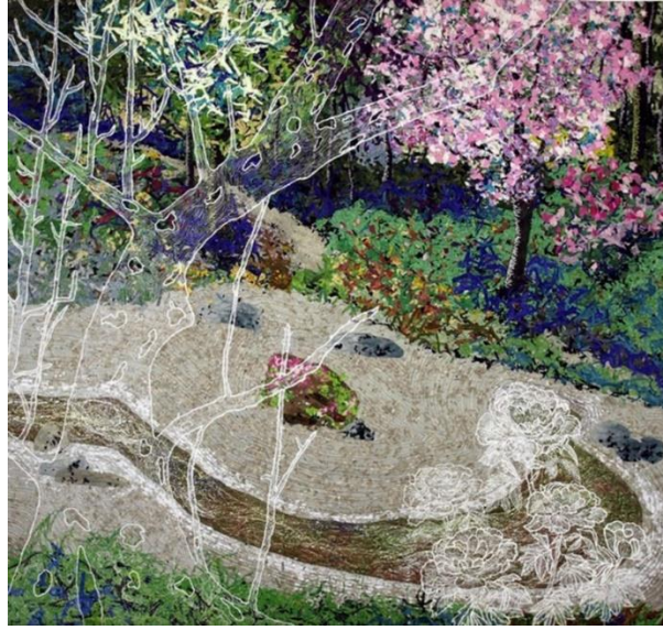
Şekil 7. Peony Dimensions , KK7, 2010.

KK8; applike tekniğinin özel bir teknik olmadığını, dikiş yöntemlerinden biri olduğunu ifade etmiştir. Ona göre kumaş resimler, yeni ve farklı olduğundan sanatta ilgi görmüştür. Kumaşlarla resim yapmaya bir sergide bir sorunu çözerken başladığını hatta dikiş makinasını ilk defa bu çalışmada kullandığını, böylece tekstil malzemeleri ile türüne ve tarihine bakmaksızın harika şeyler yapabileceğini fark etmiştir. Sanatçı, aplikelerini oluştururken farklı renkte kumaş ve ipliklere ihtiyaç duyduğunu, bu nedenle kumaşlarını kendi boyadığını ve uygun kumaşı bulmak için kendi ipliklerini boyatan tekstil firmalarından artan bobinleri toplayıp biriktirdiğini dile getirmiştir. Çalışmalarında farklı bir teknik olarak foto grafik bir gerçekliği yakalamak için pleksiglas üzerine endüstriyel akrilik boyayı da kullanmaktadır. Çağdaş sanatı önemseyene değinen sanatçı, çağdaş tekstil sanatının olduğunu düşünmemektedir. Ona göre sanat, düşüncenin forma dönüşmesidir. Sanatçı, resimlerinin içerik olarak değil belki ama biçimsel olarak realisttik olduğunu düşünmektedir (KK8, kişisel görüşme, 4 Mart 2021). Sanatçının kanvas üzerine kumaşlarla yaptığı Elfin adlı çalışmasına ait görsel aşağıda yer almaktadır (Bkz. Şekil 8).