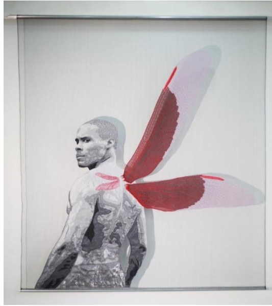
Şekil 1. Dragonfly , KK1, 2017.

bağlamında çağdaş sanatı benimsediğini aktarmıştır (KK1, kişisel görüşme, 4 Mart 2021). Sanatçının 2017 yılında yaptığı Dragonfly adlı çalışması aşağıda yer almaktadır (Bkz. Şekil 1).