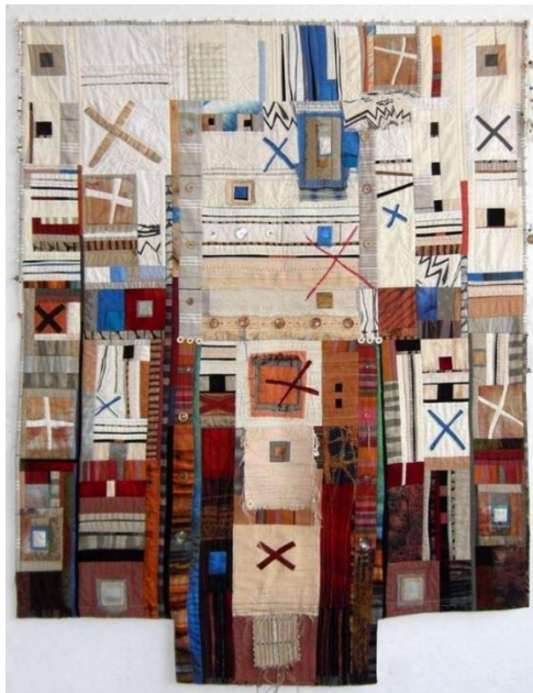
Şekil 10. Grounded , KK10, t.y.

KK10; ülkesinde yapılan tekstil işlerinin çoğunun nakış, dokuma sepet işi ve boncuk işi olduğunu belirtmiştir. Hem geleneksel el applikesi hem de farklı tipte çağdaş el ve makine applikesi kullandığını dile getirmiştir. Çalışma süreci ile ilgili verdiği bilgilere göre; geleneksel el appliğinde düz applike ve ters applike, makine appliğinde ise yüzey applike ve ters applike kullanmaktadır. Bunun yanı sıra, çok fazla doğrusal dikiş ve el işlemesine başvurmaktadır. Tasarım ve üretim aşamasının yavaş ve doğaçlama gittiğini ifade eden sanatçı, bu süreçte katı olmayıp çalışmasının yapısal gelişimine izin vermektedir. Ona göre, çalışmaları estetik ve teknik olarak sağlam olmalıdır. Bu bağlamda, çalışmalarına çizgi, şekil, renk, doku gibi tasarım unsurları açısından bakmaktadır ve kullandığı teknikler sanatçıların sesini duyurabilecek ve izleyicinin ilgisini çekecek şekilde yansımalıdır ve her parça, belirli bir stile bağlı olmaktan ziyade sahip olduğu değeri aktarabilmelidir. Sanatçı, çalışmalarını soyut olarak tanımlamaktadır (KK10, kişisel görüşme, 4 Mart 2021). Sanatçının, applike tekniğini kullanarak yaptığı bir çalışmasına aşağıda yer verilmiştir (Bkz. Şekil 10).