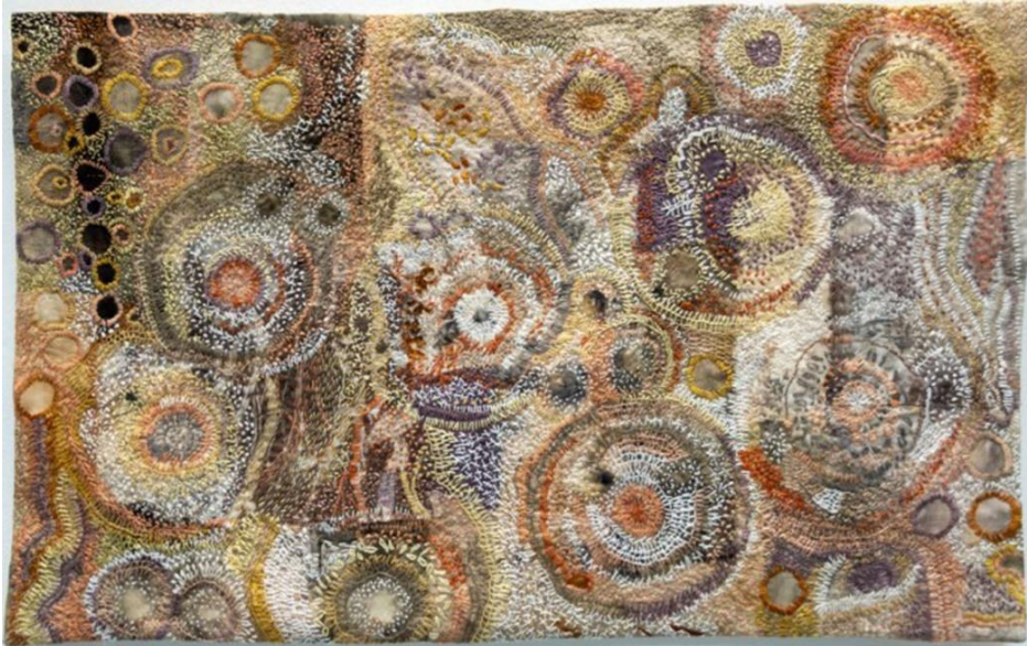
Şekil 5. Travelling Through the Land of Non Sense , KK5, 2019.