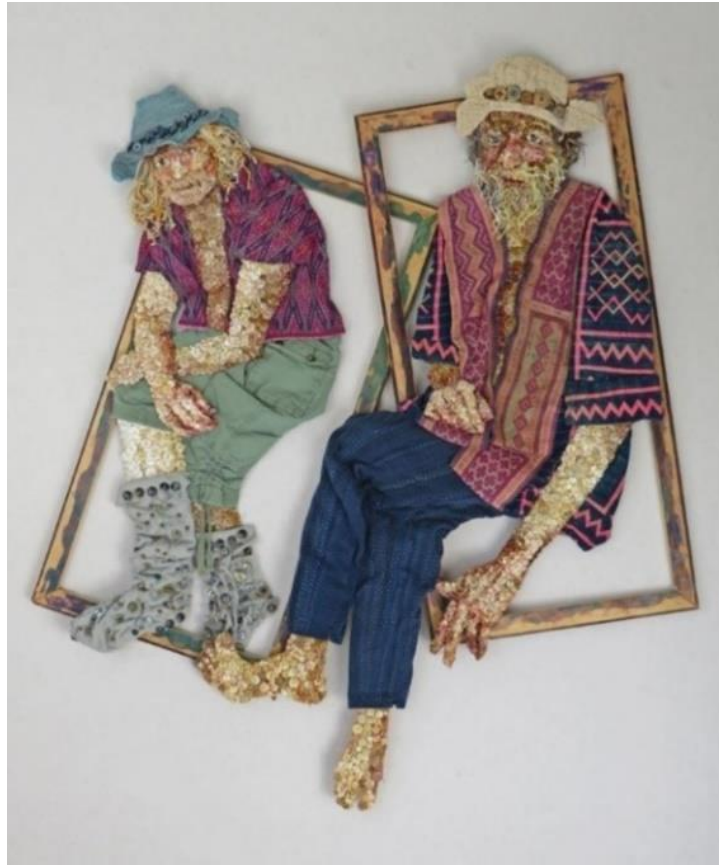
Şekil 6. Gentle Men On The Street , KK6, 2020.

KK7; ülkesinde geleneksel giysi olan Kimono ve Obi (kuşak) yapımıcılığında bazı applike tekniklerini gördüğünü belirtmiştir. Yorganlarında kullandığı applike tekniğini kendisinin geliştirdiğini belirten sanatçı, çalışma süreci ile ilgili verdiği bilgilere göre; öncelikle tasarımlarını kâğıda çizerek (büyütürken veya küçültürken), beyaz pamuklu kumaşa kalemle aktarmaktadır. Tasarımlarında akrilik boya kullanmasının yanı sıra, renkli ve küçük pamuklu kumaş parçaları kesip renk paleti olarak kullanmaktadır. Kumaş yüzeyini boyadıktan sonra üstüne yumuşak tül altına da destek kumaşı koyup iğne ile sabitleyerek yüzeyi yorgan gibi üç katman haline getirmektedir. Son olarak ise, oluşturduğu yüzeyin üzerine çeşitli ve renkli iplikler ile makine yardımıyla kapitone dikişli aplikler eklemektedir. Ormanda fotoğraf çekmeyi seven sanatçı, fotoğraflardan bazı fikirler aldığını ifade etmiştir. Ayrıca, yorganlarının çoğunda izlenimci bir yol izlediğini, empresyonist manzaralar için ise boyanmış kumaşı siyah tül ile kapladığını belirtmiştir. Ona göre, çağdaş sanatta applike teknikleri çok çekici ve sanatın anlatımı için kolaydır (KK7, kişisel görüşme, 4 Mart 2021). Sanatçının applike tekniğini kullanarak yaptığı Peony Dimensions adlı çalışması aşağıda yer almaktadır (Bkz. Şekil 7).