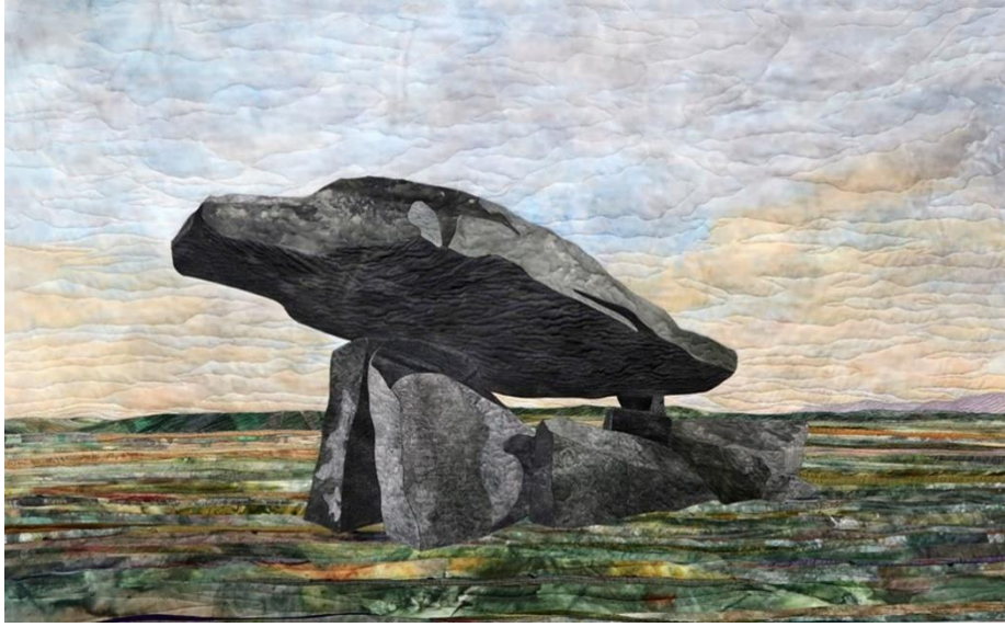
Şekil 4. Kilclooney Dolmen, KK4, 2016.