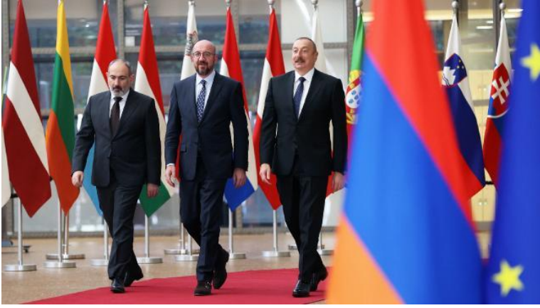
Azerbaycan Cumhurbaşkanı İlham Aliyev, Ermenistan Başbakanı Nikol Paşinyan ve AB Konseyi Başkanı Charles Michel. 22

Dışişleri Bakanlığı tarafından son olarak 6 Nisan'da Brüksel'de gerçekleştirilen görüşmelerin de olumlu bir şekilde karşılandığı beyan edilmiştir. İkincisi gerçekleştirilen bu görüşmelerde barış antlaşmasına dair hazırlıkların ve ortak sınır konularında bir uzlaşma sağlanması memnuniyet verici bir gelişme olarak değerlendirilmiştir. Brüksel'de Avrupa Birliği Konseyi Başkanı Charles Michel'in ev sahipliğinde ikincisi gerçekleştirilen bu görüşme neticesinde iki ülke Dışişleri Bakanlarının barış anlaşması için hazırlıklara başlama talimatı vermiş olmaları önemli bir gelişmedir. 23 Türkiye'nin bu görüşmelerden memnuniyet duyması Güney Kafkasya özelinde ve Kafkasya genelinde barış, huzur ve istikrarı öncelediğinin en önemli göstergelerinden biri olmuştur. Bu nedenle Karabağ'ın otuz yıllık işgali süresince sorunun çözümü için inisiyatif almayan uluslararası kuruluşların yeni dönemde sürece dâhil olmaya çalışmalarını gerek bölgenin giderek artan stratejik önemi gerekse de Rusya Ukrayna savaşıyla yeniden gündeme gelen enerji arz ve nakil güzergâhlarının güvenliğiyle doğrudan bağlantılı olduğunu belirtmekte yarar vardır.