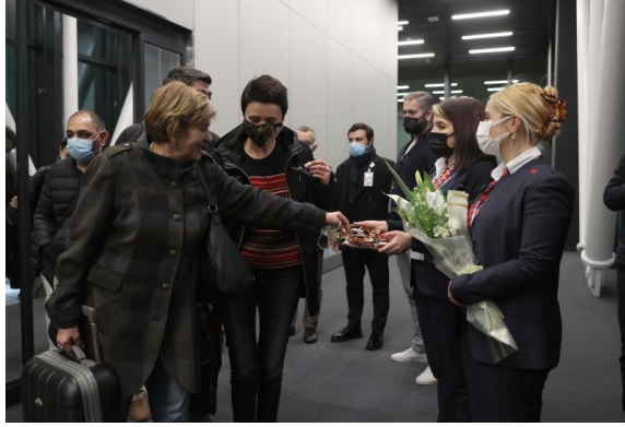
“Ermenistan’dan Kalkan flyOne ’ın Uçağının Yolcuları” 34

İki ülke ilişkilerinde başlayan normalleşme süreci daha sonra Viyana görüşmeleriyle devam etmiştir. Mart 2022’de Ermenistan Dışişleri Bakanı Mirzoyan’ın Antalya Diplomasi Forumu’na katılması ise görüşmelerin olumlu sürdüğünün bir diğer emaresi olmuştur. Nitekim son ana kadar Ermenistan’dan yetkililerin resmi düzeyde ADF’ye katılıp katılmayacaklarının açıklanmaması ve katılımın görüşmelerin olumlu geçmesine bağlı olduğunun belirtilmesi aynı zamanda sürecin ne kadar hassas bir yapıya sahip olduğunu da göstermesi açısından önemlidir.