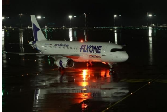
“İlk Uçuş gerçekleşti: Ermenistan’dan Kalkan flyOne ’ın Uçağı İstanbul’da” 35

İki ülke ilişkilerinde başlayan normalleşme süreci daha sonra Viyana görüşmeleriyle devam etmiştir. Mart 2022’de Ermenistan Dışişleri Bakanı Mirzoyan’ın Antalya Diplomasi Forumu’na katılması ise görüşmelerin olumlu sürdüğünün bir diğer emaresi olmuştur. Nitekim son ana kadar Ermenistan’dan yetkililerin resmi düzeyde ADF’ye katılıp katılmayacaklarının açıklanmaması ve katılımın görüşmelerin olumlu geçmesine bağlı olduğunun belirtilmesi aynı zamanda sürecin ne kadar hassas bir yapıya sahip olduğunu da göstermesi açısından önemlidir.