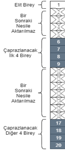
Şekil 2. Yeni nesil için çaprazlama uygulama yöntemi

Çaprazlama algoritmasında toplam 38 istasyon olduğundan 38 gen bulunmaktadır. Çaprazlama için tek noktadan mutasyon yöntemi seçildiğinden ilk 19 gen bir bireyden alınırken diğer 19 gen başka bireyden alınmaktadır böylelikle çaprazlama sonucunda yeni birey elde edilmiş olur. Tek noktadan çaprazlamanın nasıl uygulandığı Şekil 3’de verilmiştir.