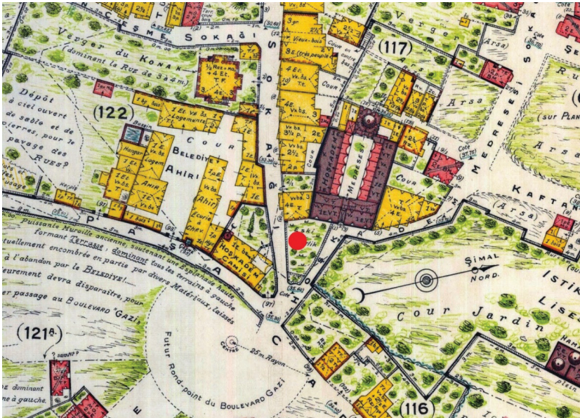
Görsel 2. Pervititch Haritası'nın detayında Ankaravî Mehmed Efendi Medresesi ve Hoşkadem Mescidi'nin konumları. (Jacques Pervititch Sigorta Haritalarında İstanbul, İstanbul, 2000)