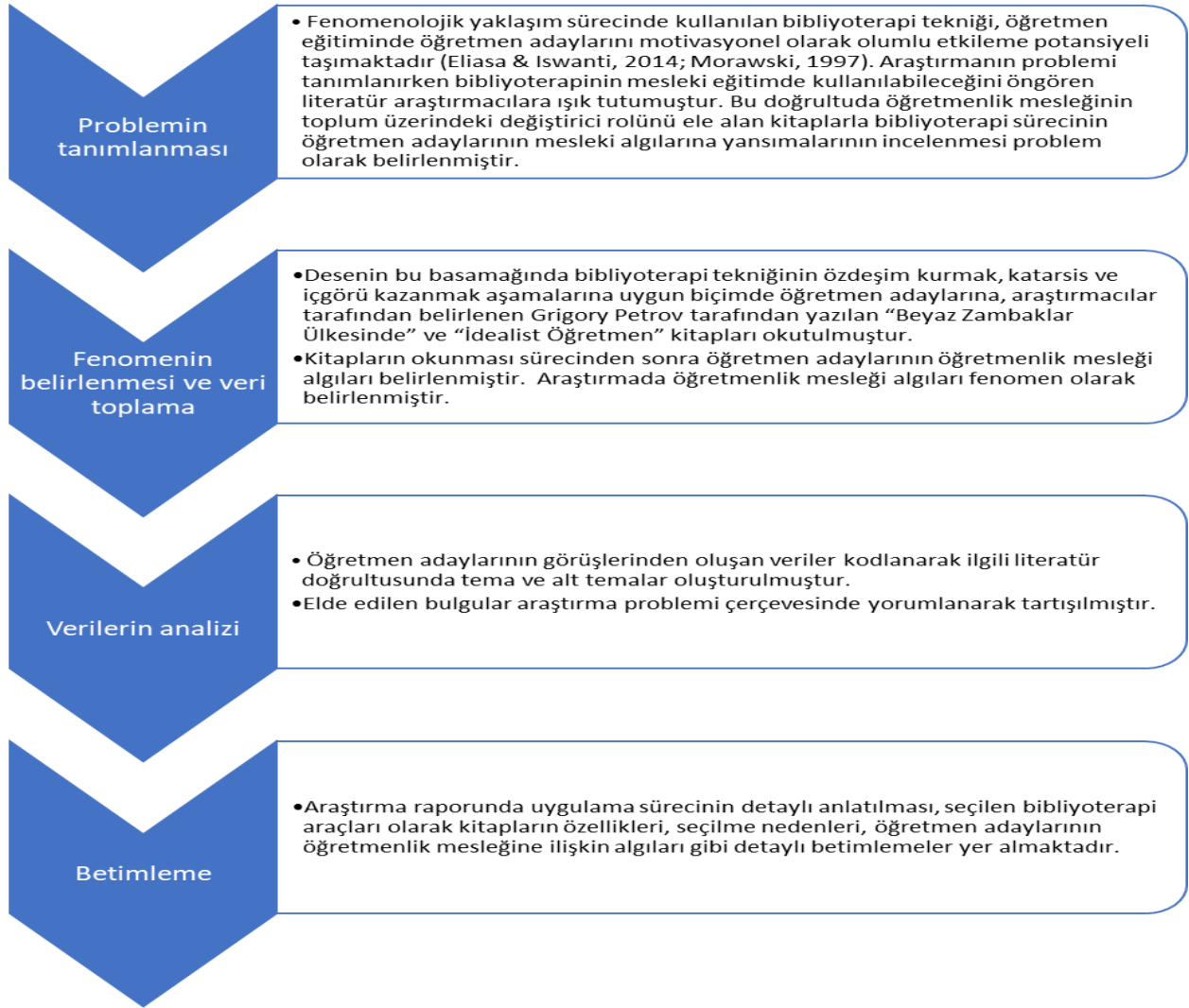
Şekil 1. Araştırmada kullanılan fenomenolojik araştırma deseni uygulama süreci