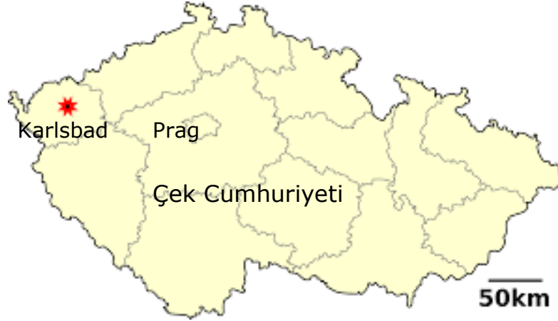
Şekil 1: Karlsbad (Karlovy Vary)'in Coğrafi Konumu

Prof. Dr. Afet İnan çalışmasına başlarken önsöz bölümünde bu esere kaynaklık eden tarihi vesikaların başkaca hiçbir yerde daha önce kullanılmadığını belirtmekte ve Karlsbad'da kaydedilen günlüklerin mahiyetleri hakkında açıklama yapmaktadır. Ne yazık ki bugün elimizde Mustafa Kemal Paşa'nın tam tekmil bir hatıra kaydı bulunmamaktadır. Nitekim Mustafa Kemal Paşa anı defterinin sonlarında bu konuyla ilgili olarak düşüncelerini şöyle aktarır: