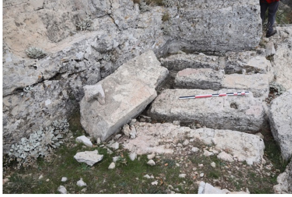
Figür 5: Duvar taşlarının temin edildiđi ocak