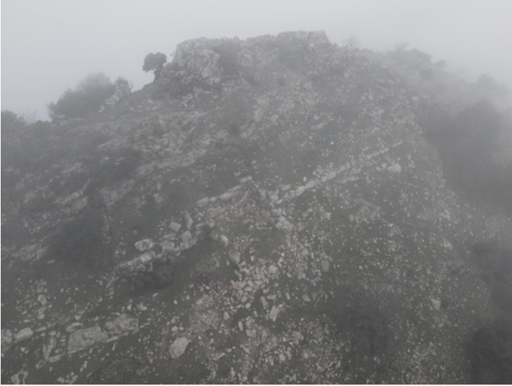
Figür 2: Kartal Dađı, Hellenistik Kale.