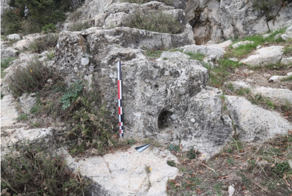
Figür 6: Kartal Dađı Açık Hava Kutsal Alanı, Basamaklı platform