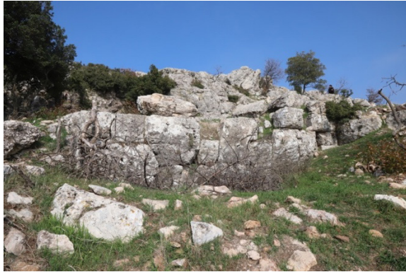
Figür 9: Bosajlı Hellenistik Duvarlar