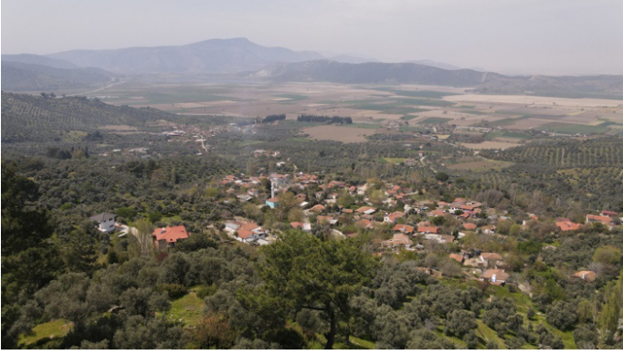
Figür 1: Tire Küçükkale'den Küçük Menderes Vadisi.