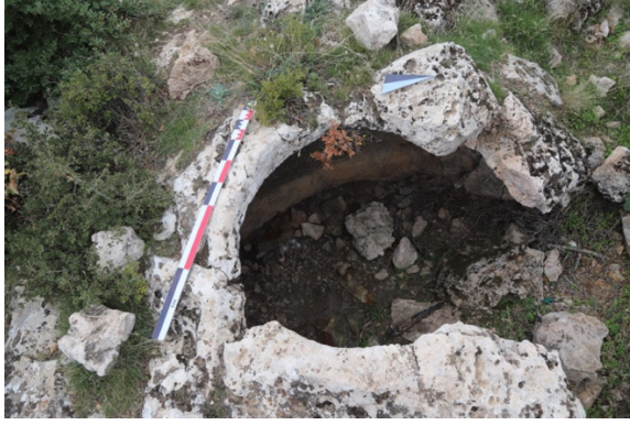
Figür 4: Kartal Dađı Hellenistik Kale'nin Sarnıcı