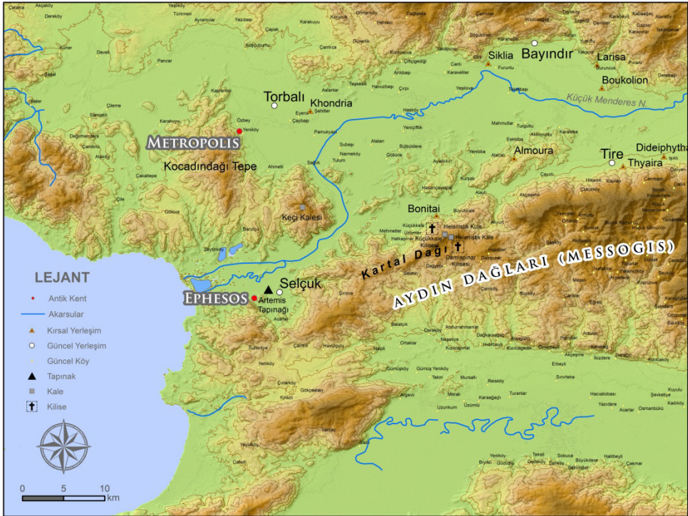
Harita 1: Kartal Dağı ve Kayastros Vadisi Yazar tarafından hazırlanmıştır