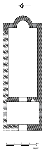
Figür 10: Küçükale Kilisesi güney naos duvarı, apsisi ve plan çizimi