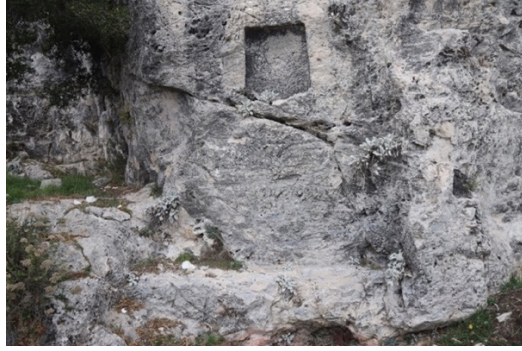
Figür 7: Kartal Dağı Açık Hava Kutsal Alanı, Nişli Kaya Yüzeyi