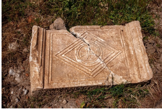
Figür 10: Germencik Dampınar Kilisesi, Korkuluk Levhası