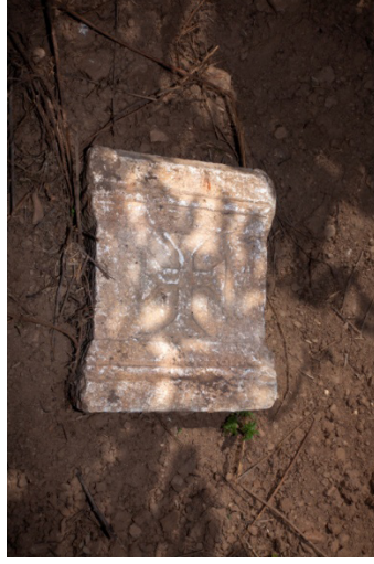
Figür 11: Dampınar Kilisesi, Pilaster Parçası