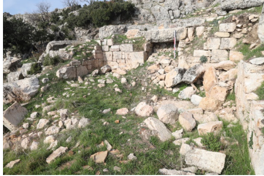
Figür 8: Kaledeki Kule Olarak Tanımlanan mekan