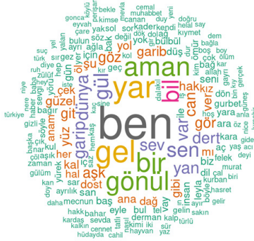
Şekil 2: Neşet Ertaş'ın Türkü Sözlerinde En Çok Kullanılan 2-Gram Öğeler