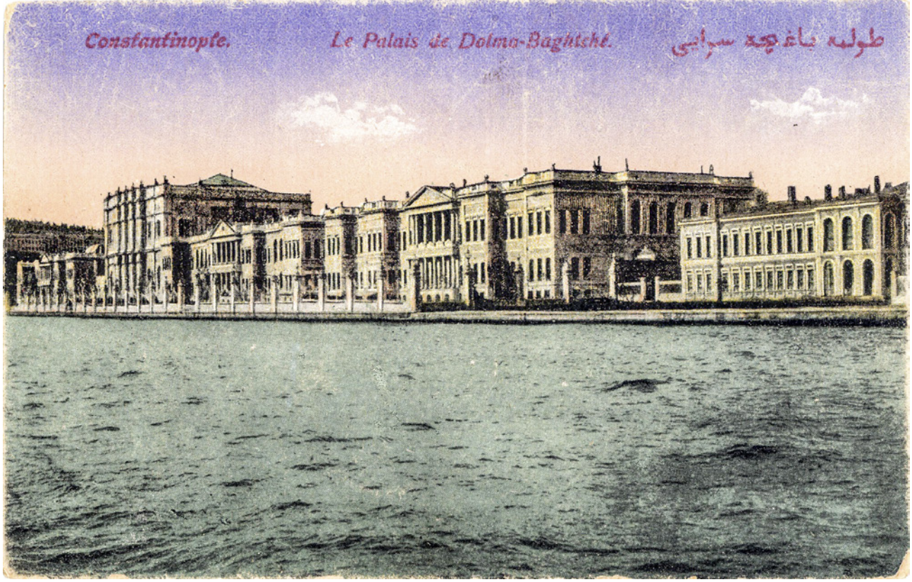
2 Boğaz üzerinden gözlenen Dolmabahçe Sarayı'nın bir kartpostaldaki görünümü 14

göstergelerinden biri olarak değerlendirilir. 11 Yaklaşık 600 metre boyunca Boğaz kıyısında uzanan saray, tasarımındaki bütüncül yaklaşım, mimari üslubu ve kullanılan bezemelerin zenginliği ile Batı'daki çağdaşları ile benzer bir dile sahiptir. Döneminde oldukça yaygın olarak kullanılan eklektik üslupta tasarlanan yapı; Antik Yunan, Neoklasik, Rönesans, Barok, Rokoko, Ampir üslûplarına ait öğeleri bir arada barındırır. 12 Her ne kadar benzeri mimari yakla-