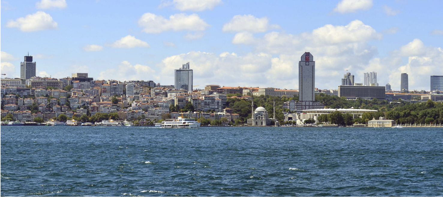
3 Boğaz üzerinden gözlenen silüette Dolmabahçe Sarayı ve yüksek yapılar (Şevkin, 2016)