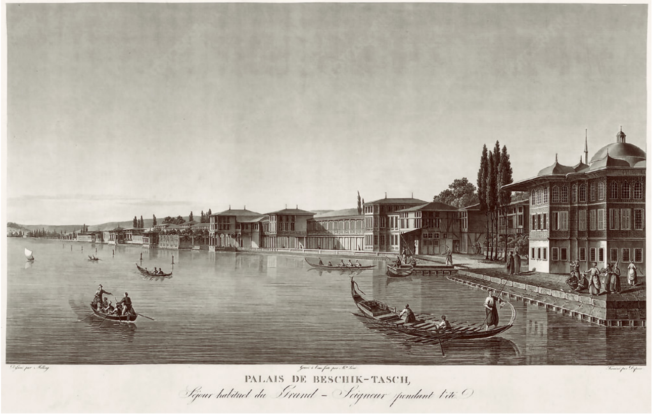
1 Antoine Melling'in çiziminde Beşiktaş Sahil Sarayı, 1819 10

18. yüzyıldan itibaren Boğaz kıyılarında yaşanan dönüşümün odak noktalarından birini Dolmabahçe-Beşiktaş aksı oluşturur. Bu alanda yer alan ve Beşiktaş Sahil Sarayı veya Eski Beşiktaş Sarayı olarak anılan kompleks, tek seferde tasarlanıp inşa edilmiş bir yapı olmaktan ziyade zaman içinde gelişen bir yapılar grubudur. (Resim 1) Sultanın görünmezliği ve mahremiyeti ile doğrudan ilişkili olan Topkapı Sarayı'nın gitgide gözden düşmesi ve padişahların sahil saraylarında daha fazla zaman geçirmesi, Osmanlı hanedanının Suriçi'nden çıkarak Beşiktaş'a doğru taşınma isteğinin ilk işaretlerini verir. Dolayısıyla sözü geçen yapılar grubu, ilerleyen yıllarda kent morfolojisinde önemli bir yer tutacak olan sahil sarayı tipolojisinin de öncüsüdür. 9