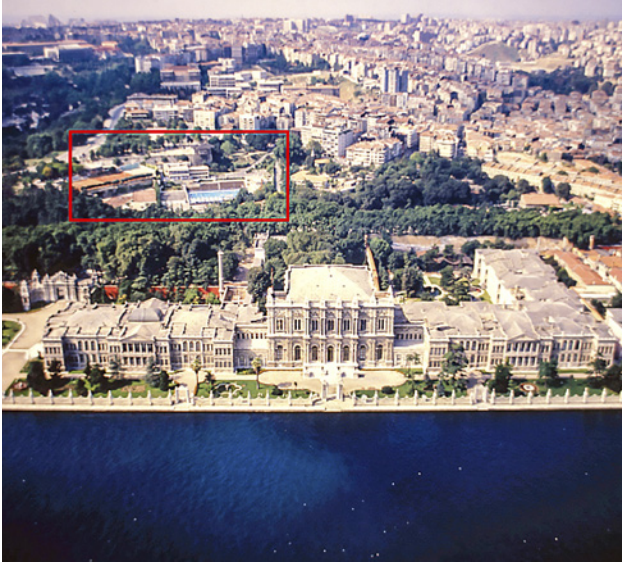
5 Kırmızı ile işaretli alanda inşa edilen Swissotel, yer seçimi dolayısıyla kent silüetine önemli bir etki yapar. 23