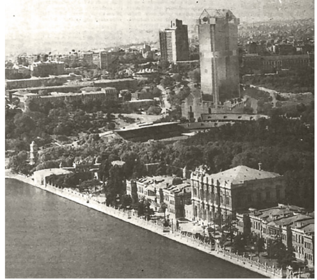
6 Taşkılla ile İnönü Stadi arasında kalan yeşil alanda inşa edilmesi planlanan Süzer Plaza'nın silüette yaratacağı etkiyi gösteren bir foto-montaj. 24

alan yapılaşmaya açılırken, Sedat Hakkı Eldem'in tasarımı olan Taşlık Kahvesi de yıkılır. 22 (Resim 5) Swissotel, her ne kadar parçalı bir yaklaşımla tasarlanmış olsa da konumu ve üzerine yerleştiği topoğrafyanın etkisi ile hemen altında yer alan Dolmabahçe Sarayı'nın silüetteki algısını önemli ölçüde dönüştürür.