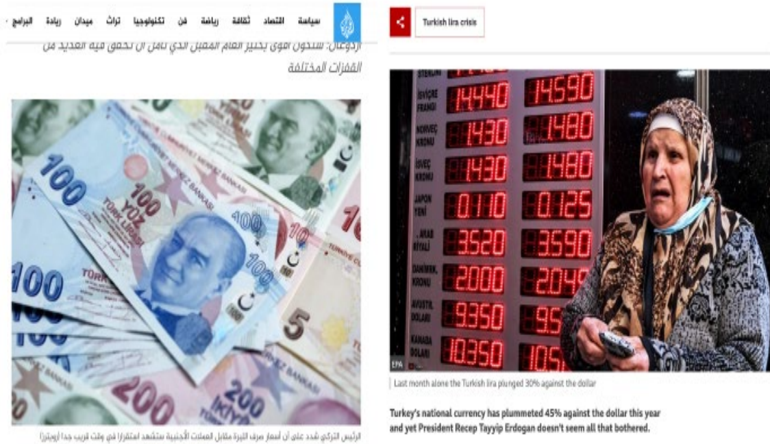
Şekil 1: Al Jazeera (solda) ve BBC’de (sağda) kullanılan haber fotoğraflarından örnekler

Kullanılan görsellerin seçiminde iki web sitesinde farklılaşma olduğu bulgulardan anlaşılmaktadır. Görsellerin haberin içeriğinden önce okuyucuya ön fikir verdiği ve algı oluşturduğu göz önünde bulundurulduğunda, buradaki haber görsellerinin bilinçli bir tercih ile konuyu çerçeveleme amacıyla kullanıldığı anlaşılmaktadır. Al Jazeera’de yayınlanan haberlerde kullanılan fotoğraflar daha çok Türk Lirası banknotları, Türk bayrağı, Cumhurbaşkanı Recep Tayyip Erdoğan resmi ve bunların birlikte kullanıldığı görsellerden oluşmaktadır. BBC’de ise ağırlıklı olarak döviz bürosu resimleri ve döviz kuru ekranları, geleneksel çarşı/pazar resimleri, alışveriş yapan insanlar, fiyat etiketi gibi görseller kullanılmaktadır. Aşağıda verili örnekte iki haber sitesinin aynı konudaki haber için kullandığı fotoğraflardaki farklılık bu durumu daha iyi açıklamakta ve haberlerde yer alan görsellerin yarattığı çerçeve etkisini göstermektedir. Al Jazeera’de güçlü bir para birimi algısı uyandıran yeni ve parlak görümlü TL banknotlarının görüntüsü kullanılırken, BBC’de bir döviz bürosu önünde yüksek kurları gösteren elektronik ekran yanında üzgün ve ağlamaklı bir kadın fotoğrafı kullanılmıştır.