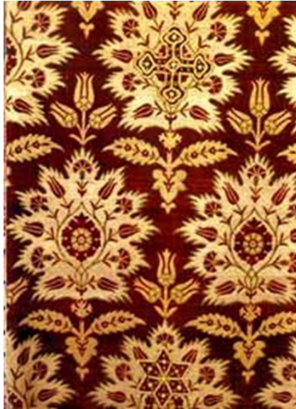
Fotoğraf 3: Batılılaşma öncesi Osmanlı Devleti Kumaş deseni örneği Kaynak: https://tr.pinterest.com/pin/32629993547537765/ 27.05.2021