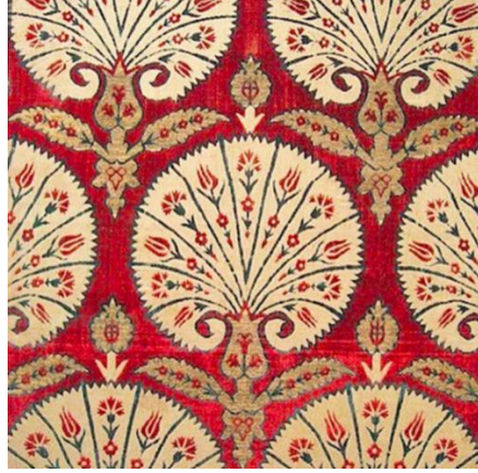
Fotoğraf 4: Batılılaşma öncesi Osmanlı Devleti Kumuş desen örneği 28.05.2021