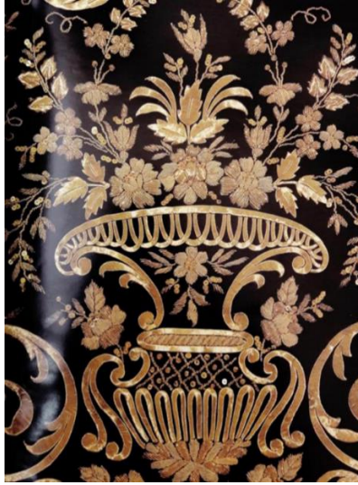
Fotoğraf 6: Batı üslubuyla (Barok) dokunmuş Osmanlı Devleti saraylarına kullanılmış olan kumaş örneği Kaynak: Bilgin, 2019: 97

Görüldüğü gibi Osmanlı Devleti, bir yandan gelecekte diğer toplumlarla rekabet edebilecek yeni bir iktisadi ortam oluşturmaya, diğer yandan da Avrupa karşısında ortaya çıkmaya başlayan güç dengesindeki zaafı kapatmaya çalışmışlardır. Bu sebeple; Osmanlı Devleti reformistleri iktisadi ortamı değiştirip geliştirecek yasal düzenlemeleri yapmaya çalışmaktan vazgeçmemişlerdir. Çünkü uluslararası alanda yaşanmakta olan ölümcül rekabet sebebiyle, uzun vadede elde edilecek kazanımları beklemeye müsaade eden bir ortam oluşmamıştır. Durum göz önünde bulundurularak gerekli düzenlemelerin yapıldığı Osmanlı Devleti, Batı'ya ayak uydurma noktasında ıslahatlar düzenledikten sonra kendi millî üslubunu oluşturarak kumaş sanatındaki yenilik ve değişiklikleri başarılı bir şekilde uygulamıştır.