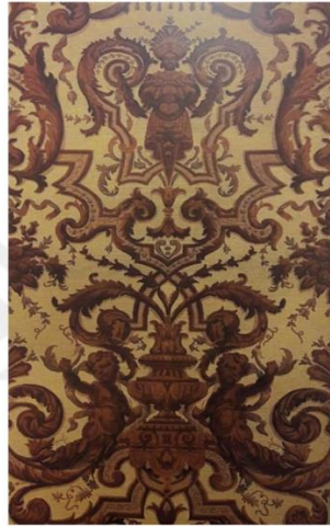
Fotoğraf 5: Batılılaşma sonrası Batı üslubuyla dokunmuş Osmanlı Devleti saraylarında kullanılmış olan kumuş örneği

Batılılaşma etkileriyle birlikte ise özellikle Osmanlı Devleti'nin son dönem kumuş sanatının üretim merkezini teşkil eden Hereke fabrikası, eski Türk sanat üsluplarını koruyarak ve Batı sanat üsluplarından da gerektiği ölçüde yararlanarak, kumuş yapı ve desenlerinde başarılı bir şekilde uyguladığını fotoğraf 5 ve 6'daki örneklerde görmekteyiz (Bilgin, 2019: 1).