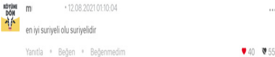
Resim 11. Doğal Kimlik Ögesini Nefret Aşağılama Unsuru Olarak Kullanma/ Simgeleştirme Kategorisi Okur Yorumu

Ele alınan ilk içerikte Suriyeli sığınmacıların istenmediğı ayrımcı bir dille ifade edilmiştir. Paylaşımında vurgulanan “bunlar daha iyi günler bela olacaklar” ifadesi, Suriyelilerin bir tehdit olarak görüldüğünü ortaya koymaktadır. Cümle içinde yer alan “şerefsiz ırk” söylemi ile kimliğe ilişkin negatif bir simgeleştirme yapılmış ve kimlik unsuru temel alınarak nefret söylemi üretilmiştir.