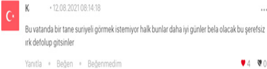
Resim 10. Doğal Kimlik Ögesini Nefret Aşağılama Unsuru Olarak Kullanma/ Simgeleştirme Kategorisi Okur Yorumu

Bu kategoride, doğal kimlik unsuru simgeleştirilerek nefret söylemlerine dönüştürülmüştür. “Suriyeli” veya “Arap” ifadelerinin kullanıldığı bu içeriklerde, söz konusu kimlik aidiyetlerine sahip olan kişiler negatif bir şekilde simgeleştirilmiş, ayrımcı ve ötekileştiren bir söylem üretilmiştir. Bu kategoride 41 nefret söylemi tespit edilmiştir.