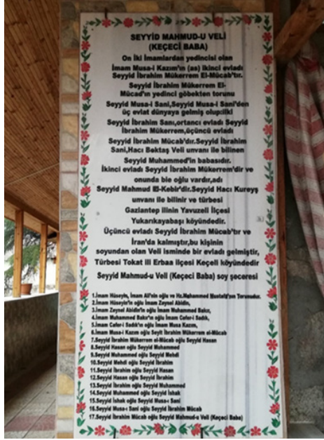
Şekil 1: Keçeci Baba'nın Türbede Mevcut Olan Şeceresi