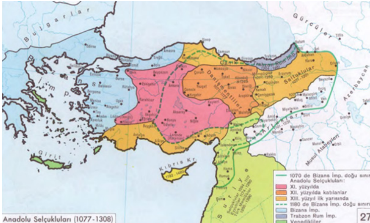
Şekil 2: Anadolu Selçuklular Döneminde Anadolu (Unit, 1992, 27)

Sözlü kaynaklara ve köydeki Ocak dedelerine göre Ahi Mahmud Veli, Horasan bölgesinde Nişabur'da doğmuş (Pehlivan, 2002) ve 13. yüzyılda Horasan'dan Anadolu'ya gelmiştir. Danişmentliler havzasında (Şekil 2) kurulup edep- erkân süren Keçeci Baba Ocağındaki Ocakzade dedeler, Keçeci Baba'nın Hacı Bektaş Veli'nin amcası olduğunu, 1349 senesinde Anadolu'da şehit düşüğünü ifade etmektedirler. Tepecik'in Keçeci Baba Türbesi'ndeki sancağındaki yazıdan okuduğu üzere, "Keçeci Baba'nın Ali Haydar, Altunbıyık ve Seyyid Mehmed isminde üç oğlu olduğu" görülmektedir (Tepecik, 2019, 29).