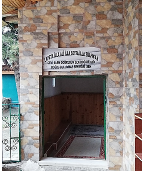
Şekil 3: Keçeci Baba Türbesi