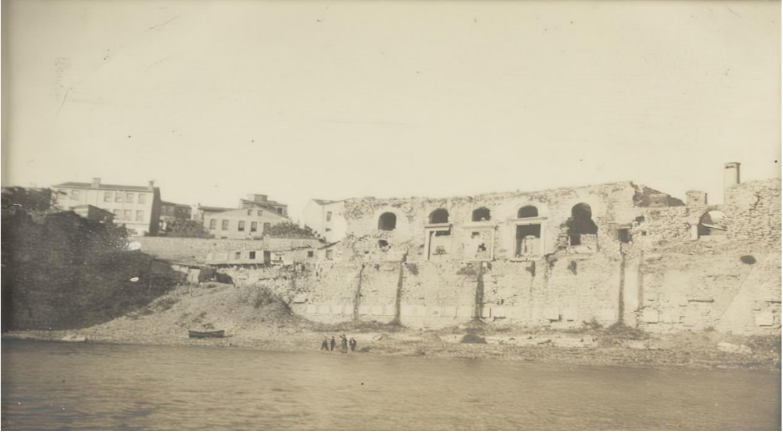
Şekil 2: Bukoleon Sarayı ve Cephesi/ Ahırkapı-1890'lar 4

Bu bakımdan tarihi süreç içerisinde çok defalar eklemelere maruz kalan ve bazı kısımlarının tekrardan yapılmış olmasına rağmen Bukoleon Sarayı'nın günümüze kalan ve görülebilen ön cephesi üç yüz metre uzunluğunda iki bölümden oluşmaktadır. Bu bölümler Bukoleon Kraliyet Limanı ile sarayı birbirine bağlayan anıtsal merdiven, cephenin 90 derecelik bir açıyla kırıldığı bölümde bu iki parçayı birbirinden ayırmaktadır. Sarayın batı parçası 1870'lerdeki demiryolu yapımında zarar görmüştür. Doğu parçası ise günümüzde kısmen ayakta durmaktadır (Berger, 1994, s. 327). Saray, surların üzerinde deniz seviyesinden yaklaşık 13,5 m. yükseklikte yer alırken, fener kulesi çevresinde 19 metreyi bulmaktaydı. Doğu parçasının doğudaki sınırını pharos adı verilen ve bugün sadece alt kısmı ayakta duran yapı oluşturmaktadır. Pharos, 22,5 m. yüksekliğinde aşağıdan yukarıya doğru gittikçe daralan 3 katlı bir deniz feneridir (Utkan, 1996, s. 12-17). Batı parçası ise sur boyunca Çatladıkapı'ya ve günümüzde mevcut olmayan Belisarius Kulesi'ne uzanmaktadır. Belisarius Kulesinin, Kraliyet Limanı'nın giriş ve çıkışlarını kontrol altında tutmak amacıyla kullanılmış olduğu tahmin edilmektedir. Nitekim bu Kule, 1950'li yıllarda sahil otoyolunun yapımı sırasında sahil surlarının bir bölümü ile birlikte yıktırılmıştır (Köroğlu, 2006, s. 6).