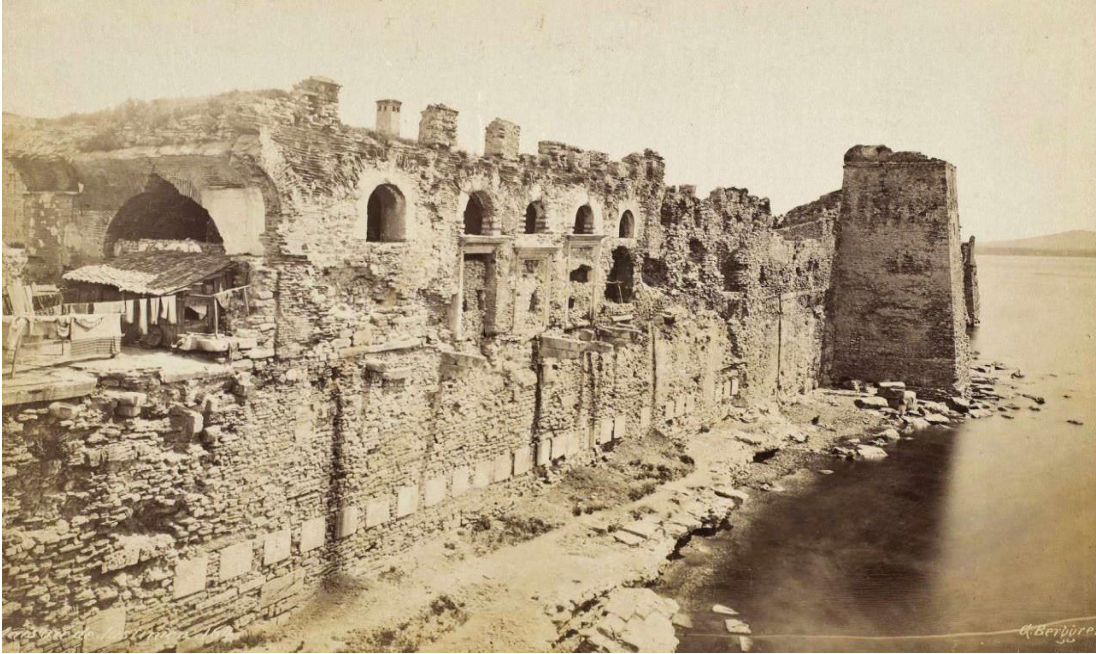
Şekil 1: Bukoleon Sarayı Fener Burcu ve Saray Cephesi, Ahırkapı. 3

Kaynaklar Bukoleon sarayının yerini; Büyük Saray'ın güney-batı köşesi dışında olduğunu ifade ederken, adını ise Sasani kralı II. Sapor'un Bizans'a sığınan ve burada bir süre yaşayan kardeşi Hormisdas'dan aldığı belirtilir (Eyice, 1988, s. 12). Özellikle bu ismin kaynağı olarak Büyük Konstantinus döneminde (MS. 306-337) İstanbul'a sığınarak Hıristiyanlığı kabul eden ve ülkesinin tahtının ardıldığından mahrum bırakılarak bir kuleye kapatılan ve karısı sayesinde buradan kurtulup Büyük Konstantinus'a iltica eden Sasani prensi Hormisdas'ın (Hürmüz), İmparator Konstantinus'un izniyle şimdiki Küçük Ayasofya Camiinin doğusunda Marmara denizi kıyısında İran'daki evine benzer bir saray yaptırdığı ve ismini saraya verdiği ve sonrasında da bu sarayın Bukoleon Sarayı olarak adlandırıldığı tahmin edilmektedir (Millingen, 1899, s. 279). Kıyıda bulunan bu sarayda sonraları VI. yüzyılda Iustinianus oturmuş ve İmparator olduktan sonra, bu binayı Büyük Saray'ın sınırları içine aldırılmıştır. Daha eski adı bilinmeyen fakat içinde Sasani prensi Hormisdas'ın yaşadığı için onun adı ile tanınan, VI. yüzyıldan sonra da Iustinianus evi olarak şöhret bulan bu yapı, bugün Marmara surları üzerinde cephesi görülen yapı olarak teşhis edilmektedir (Eyice, 1988, s. 12).