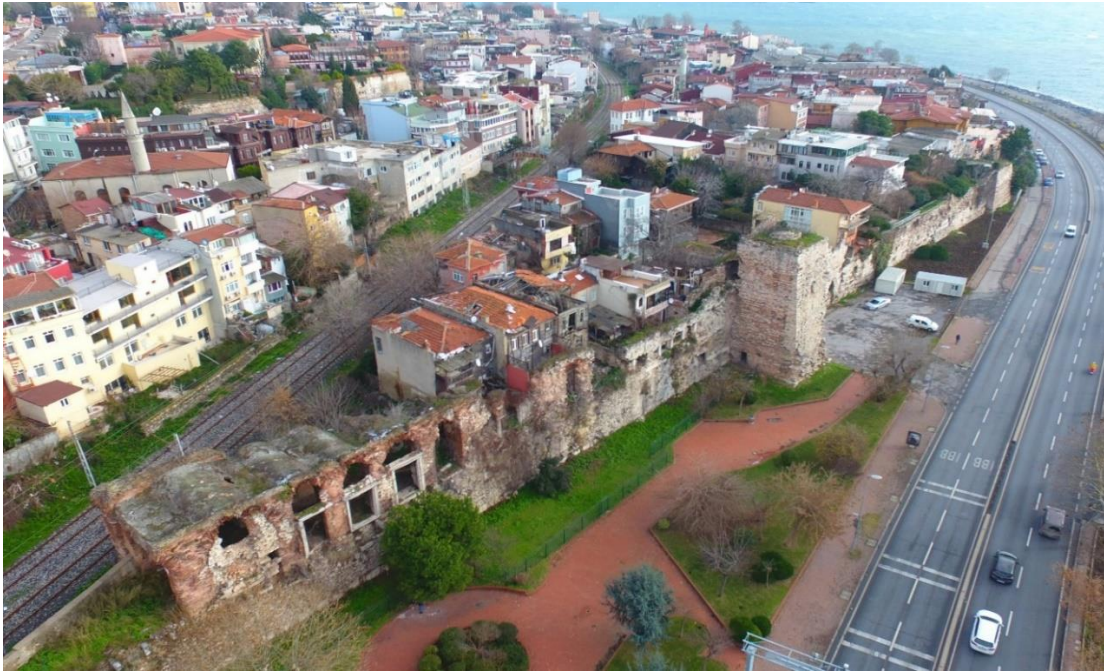
Şekil 3: Bukoleon Sarayı 5

Sarayın diğer önemli bir bölümünü oluşturan ve merdivenlerle çıkılan Pharos/Faros Fener Terası, ünlü Altın Salon'un (Hrisotriklinos) önünde, deniz feneri de sarayın güneydoğu ucundaydı. Fener muhtemelen sarayın limanını aydınlatıyordu. Kuban, gezgin Cristoforo Buondelmonti'nin, 15. yüzyılın başlarında hâlâ ayakta olan bu faros'tan söz ettiğinden bahseder. Aynı teras üstünde, V. Konstantinos tarafından yapılarak Meryem Ana'ya adanan, tahta çıkış törenlerinin yapıldığı ünlü şapelin yanı sıra, Avios Demetrios Kilisesi ile Aziz İlyas Mezar Odası da bulunmaktaydı. Kuşkusuz bunların en büyüğü I. Basilios'un bu terasa bir köprüyle bağlanan Yeni Kilisesiydi. Kaynaklarda çok sayıda odadan ve şapelden söz edilmesine karşın, adları ve olası kurucularından başka, bu yapıların yerleri ve biçimleri bilinmemektedir. Ortaçağda Bizans Büyük Sarayı çok sayıda kilise, şapel ve barındırdığı kutlu emanetleriyle bir manastırı andırmaktaydı. Büyük Saray'daki ve kentteki kutsal eşyalar, her yere yayılmış manastırlar ve ikon kültü, Konstantinopolis'i Kudüs gibi bir hac merkezine dönüştürmüştü. Dönemin dinsel mimarisi gibi saray mimarisi de çok büyük boyutlu değildir. Bütün bu odalar, pavyonlar ve şapeller boyutları açısından çok