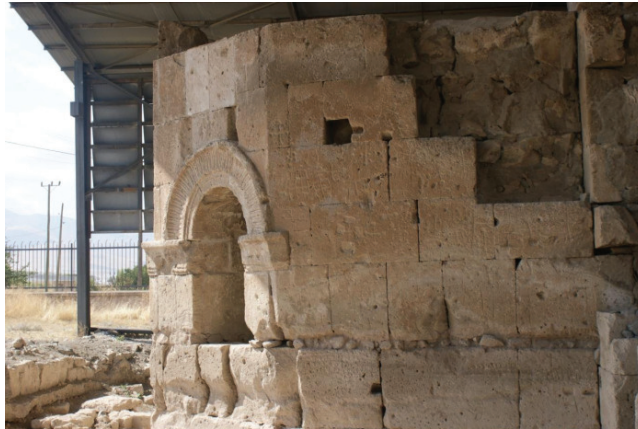
Fotoğraf 5: Andaval Konstantin ve Helena Kilisesi kuzey çephesinde kazıma haçlar (Nalçacı, 2010)

1837 yılında Anadolu'yu gezmeye başlayan seyyah W.J. Hamilton 1842 tarihli seyahatnamesinde Niğde'nin 8 km doğusunda yer alan Andaval (Aktaş)'da Konstantin adına yapılmış bir kilise olduğundan bahseder (Hamilton, 1842: 297). Yapının ilk planını çizen Strzygowski, kiliseyi Ajos Konstantinos olarak adlandırmıştır ve rivayete göre, Kudüs yolculuğu sırasında Helena'nın yaptırdığını söyler (Pekak, 2016: 105). Aynı zamanda N. ve M. Thierry de 326 yılında Helena'nın kutsal topaklara yaptığı ziyaret sırasında bu kiliseyi inşa ettirdiğinden bahsetmektedir (Thierry-Thierry, 1963: 29-30). Günümüzde Konstantin ve Helena kilisesi olarak bilinen ve birçok kez onarım görmüş olan kilisenin araştırmacılar tarafından 5. ve 6. yüzyıla tarihlenip Helena tarafından yaptırıldığı şüpheli görünse de; daha sonraki dönemlerde bu alanın hacılar tarafından sık ziyaret edilip, kutsal bir alana dönüştüğü kilise duvarlarına hacılar tarafından kazınmış haçlardan anlaşılmaktadır (Pekak, 2016: 105) (Fotoğraf 5). Helena'nın Andaval'a uğradığı göz önüne alındığında Helena'dan sonra bu yolu kullanan hacıların da yol rehberlerinde yer alması gidiş yolunda bu yolu kullandığını ortaya koymaktadır. Muhtemelen Helena Kudüs'e giderken Colonia Archelais (Aksaray) bağlantı yolundan Caeseria (Kayseri)'ya geçmiş olmalıdır (Harita 5).