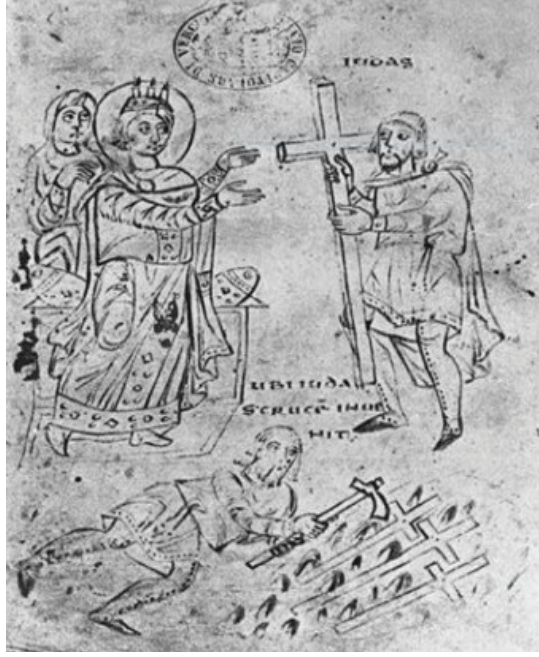
Fotoğraf 1: Gerçek Haçın Bulunuşu Nationale El yazması, Paris, 9 yy başı

Helena'nın 326'da başlayan Kudüs yolculuğu, Hıristiyan kutsal topraklarına yapılan ilk hac ziyaretidir. Yolculuğa Roma'dan başlayan imparatoriçe buradan kısa bir süre önce oğlu tarafından yeni kurulan Bizans'ın başkenti Konstantinopolis (İstanbul)'e ulaştı ve Roma askeri yolunu takip etti (Gosch ve Stearns, 2007: 42). Roma yol sisteminde İmparator Diocletianus (284-305) döneminde 292 yılında değişikliğe gidilmiş, Nikomedia'nın (İzmit) Roma İmparatorluğu'nun dört başkentinden biri olması ile bu yöne doğru giden yollar önem kazanmıştı. 330 yılında İmparator Konstantin'in imparatorluğun yeni başkenti olarak Konstantinopolis'i (İstanbul) ilan etmesi ile İmparatorluğun merkezi Roma değil Konstantinopolis (İstanbul) olmuş, artık bu yöndeki yollar önem kazanmaya başlamıştır (Ramsay, 1960: 77).