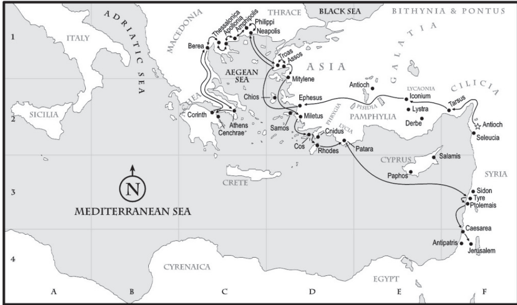
Harita 3: Aziz Paulus'un 3. Mision Yolculuğu (https: bible.org)