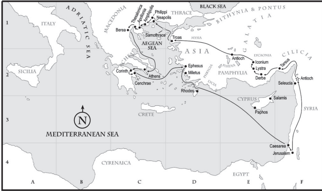
Harita 2: Aziz Paulus'un 2. Misyon Yolculuğu

İlk yolculuğundan kısa bir süre sonra Anadolu, Yunanistan ve Balkanlar'da misyon faaliyetlerinde bulunmak için 49-52 yıllarında ikinci misyon yolculuğuna çıkan Paulus, Antiocheia (Antakya)'dan başladığı yolculuğunda Karaman, Derbe, Lystra, Phrygia, Galatia, Mysia ve Troia'da faaliyetlerini sürdürmüştür. Daha sonra gördüğü bir rüya ile Makedonya'ya geçerek Makedonya ve Yunanistan'da Niapolis, Philippi, Apollonia, Selanik ve Korint şehirlerine ziyarette bulunur. Buradan deniz yolu ile Efes'e geçer ve bir süre burada kaldıktan sonra deniz yoluyla Filistin'e, buradan da Kudüs'e ulaşır. Kudüs'te kısa bir süre kaldıktan sonra Antakya'ya geri dönerek ikinci yolculuğunu tamamlamış olur (Harita 2) (Elçilerin İşleri:15: 36-18: 22). Aziz Paulus'un ikinci seyahati sırasında izlediği yolları takip ederek sırasıyla Tarsus, Silifke, Mut ilçelerinde Aziz Paulus'un doğduğu ve yaşadığı yerler ile Paulus ve Hıristiyan azizlerin anısına yapılmış erken dönem kiliselerini görmek mümkündür.