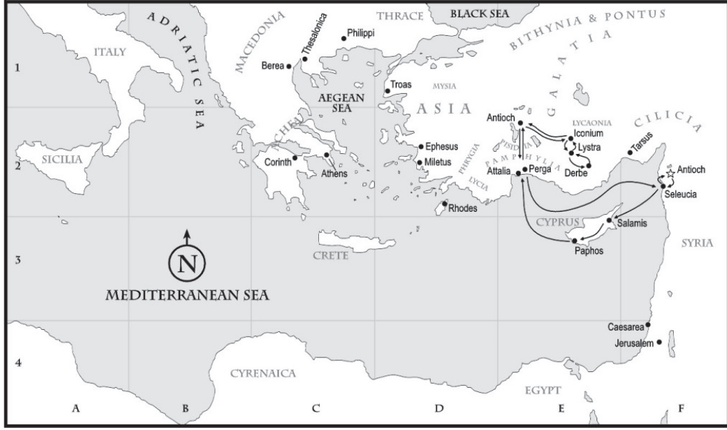
Harita 1: Aziz Paulus'un 1. Misyon Yolculuğu (https: bible.org)