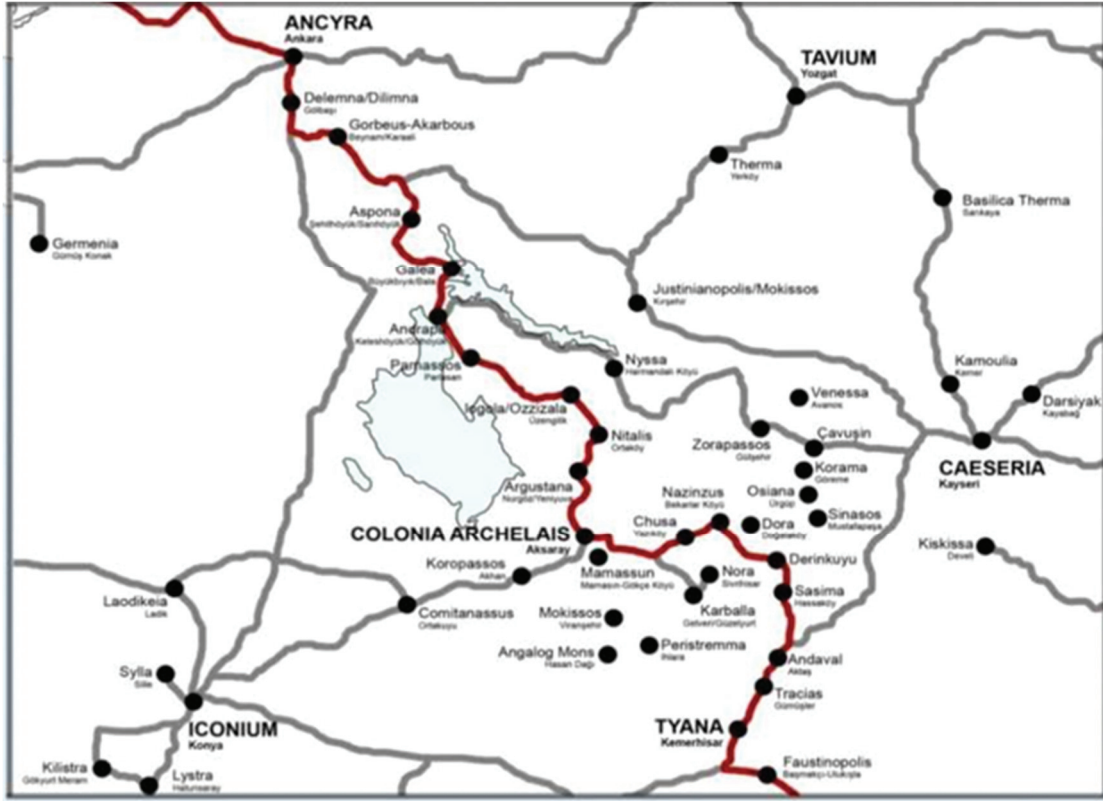
Harita 6: Orta Anadolu Hac Yolları (Şengül, 2019)

Anadolu'da Batı'dan Doğu'ya uzanan hac yolunun Thracia, Bithynia ve Galatya üzerinden geçtiği üç temel nokta bulunmaktadır (Nikomedia, Ankyra, Tarsus) (Harita 5). Bu merkezlerden Ancyra (Ankara), Anadolu'nun ortasında askeri ve ticari yolların kesiştiği bir konumunda yer almaktaydı ve yol şebekesinin düğüm noktası olarak, doğrudan doğruya bir bağlantı merkezi niteliğinde olduğu şeklinde yorumlanmıştır (French, 1981: 16). Dördüncü yüzyılda Ankara'nın Galatia eyaletinin başpiskoposluk merkezi olduğu ve burada sırasıyla 314, 358 ve 375 yıllarında üç kilise konseyinin toplandığı bilinmektedir. Hıristiyanlığın yayılmaya başlamasıyla birlikte, Ankara başta Ortodoks ve Arian uyuşmazlığı olmak üzere çeşitli teolojik tartışmaların ve ayrımcı grupların da merkezi haline gelmiştir. Bu şehri Erken Hristiyanlık tarihi açısından önemli kılan iki şehit ise Aziz Clements ve Plato'dur (Serin, 2014: 66).